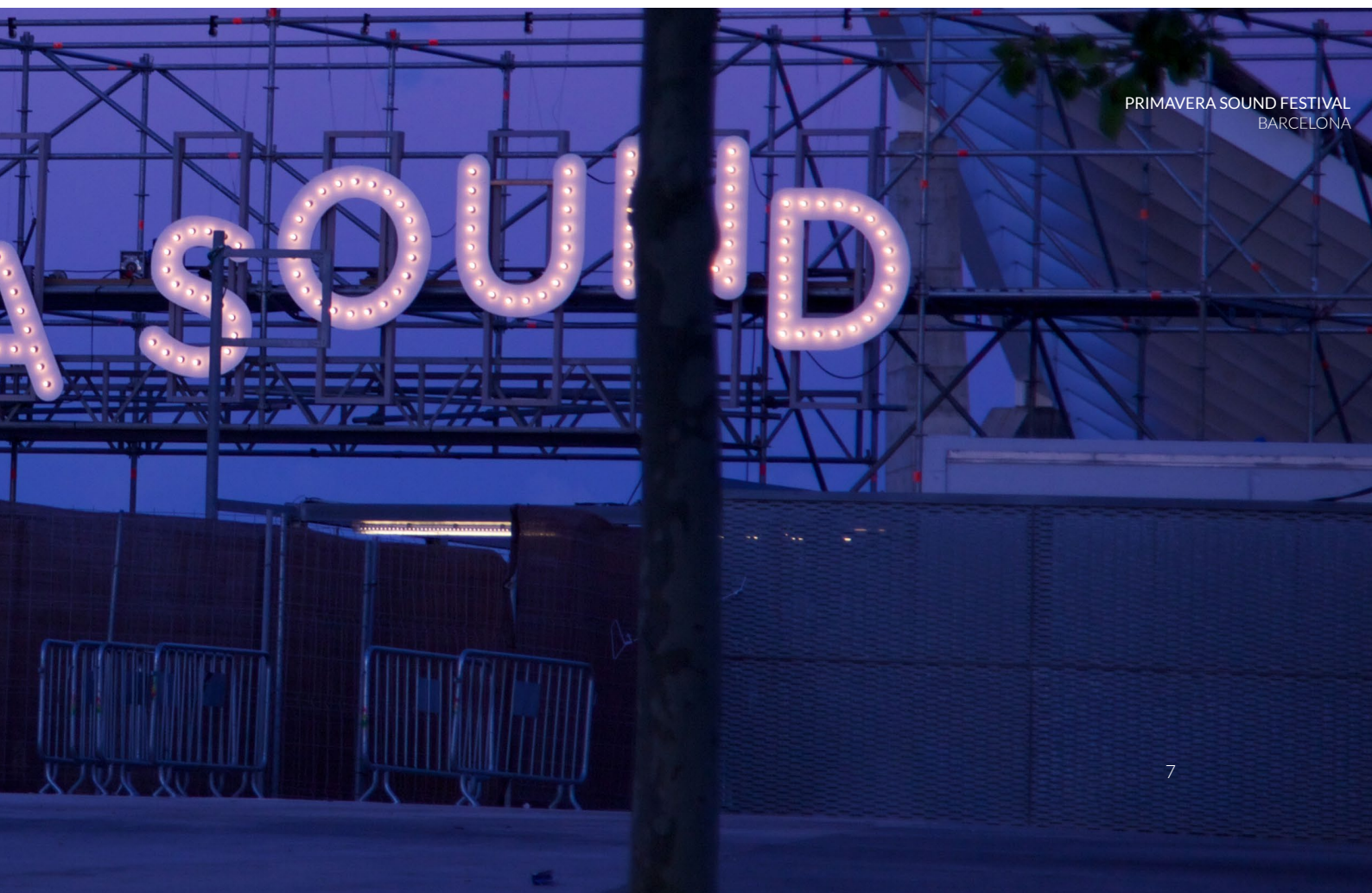
PRIMAVERA SOUND FESTIVAL BARCELONA

Weitere Informationen und Ticketverkauf: www.primaverasound.es