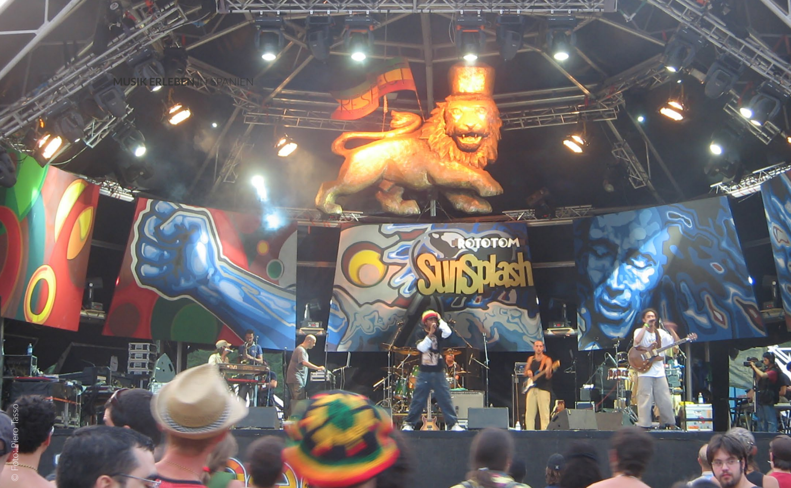
▲ ROTOTOM SUNSPASH BENICÀSSIM