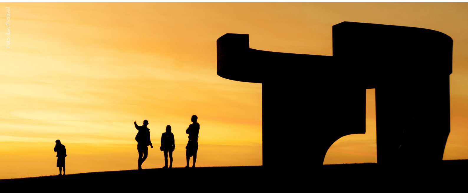
▲ ELOGIO DEL HORIZONTE GIJÓN

Metrópolis ist außerdem ein hundefreundliches Festival, auf dem Haustiere auch willkommen sind. Dies sieht man vor allem beim Cosplay-Wettbewerb, an dem Hunde und Besitzer gemeinsam verkleidet als ihre Lieblingsfigur teilnehmen.