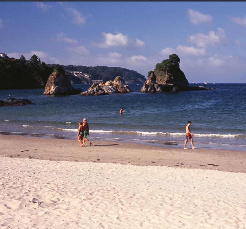
▲ STRAND VON COVAS - OS CASTELOS VIVEIRO, LUGO

Vier Tage, vier Bühnen und 100 Bands, die sich zwischen Hardrock, Hardcore , Punk, Heavy Metal und allen denkbaren Varianten bewegen. Dies fasst das knallharte Angebot des Resurrection Fest zusammen, das Ende Juni und Anfang Juli inmitten der wunderschönen Natur des Fischerdorfes Viveiro (Lugo) stattfindet.