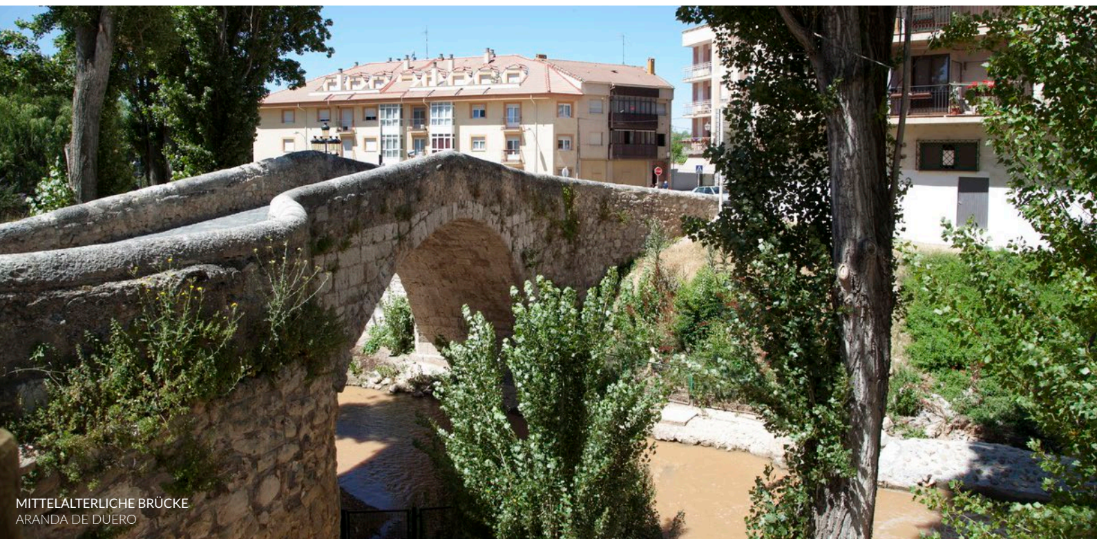
MITTELALTERLICHE BRÜCKE ARANDA DE DUERO

Das musikalische Angebot wird durch die tolle Atmosphäre, die auf dem Campingplatz herrscht, und durch viele parallele Aktivitäten ergänzt: ein Wettbewerb für Kurzfilme und Demos, Vorträge, ein Wettbewerb für junge Talente und Sonorama Baby mit einem speziell für Kinder entwickelten Programm.