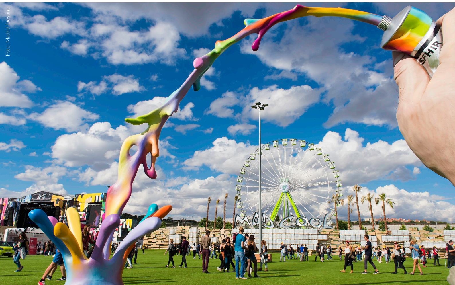
▲ MAD COOL FESTIVAL MADRID