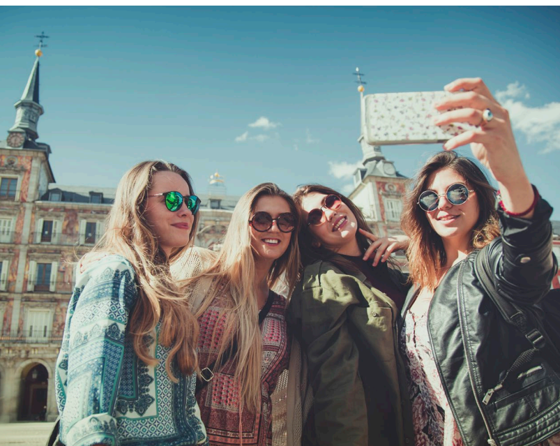
▲ PLAZA MAYOR MADRID