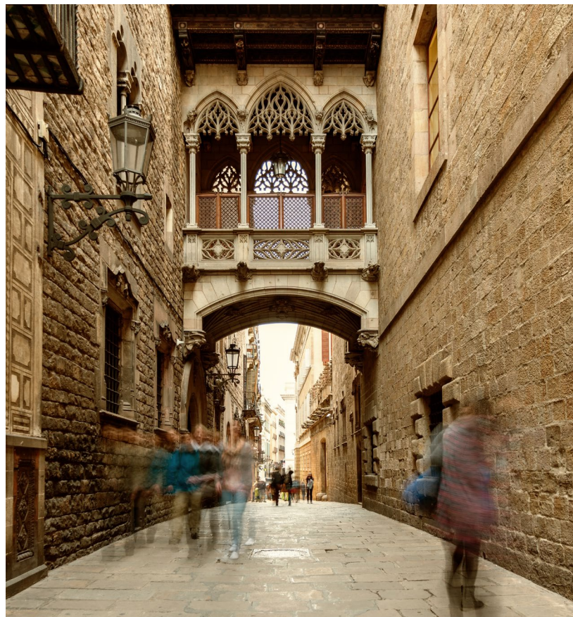
▲ BARRI GÒTIC BARCELONA

Wenn Sie alles, was eine Stadt wie Barcelona zu bieten hat, nutzen wollen, ist dies ganz einfach. Die Lage von Sónar de Día in der Nähe des Stadtzentrums ermöglicht es Ihnen, alle ihre Reize kennenzulernen. Die katalanische Hauptstadt gilt als die Stadt des Modernisme schlechthin. Hier finden Sie die bedeutendsten architektonischen Schätze von Antoni Gaudí, die zum UNESCO-Weltkulturerbe erklärt wurden, beispielsweise die Sagrada Família oder den Park Güell . Zudem sind auch Überreste