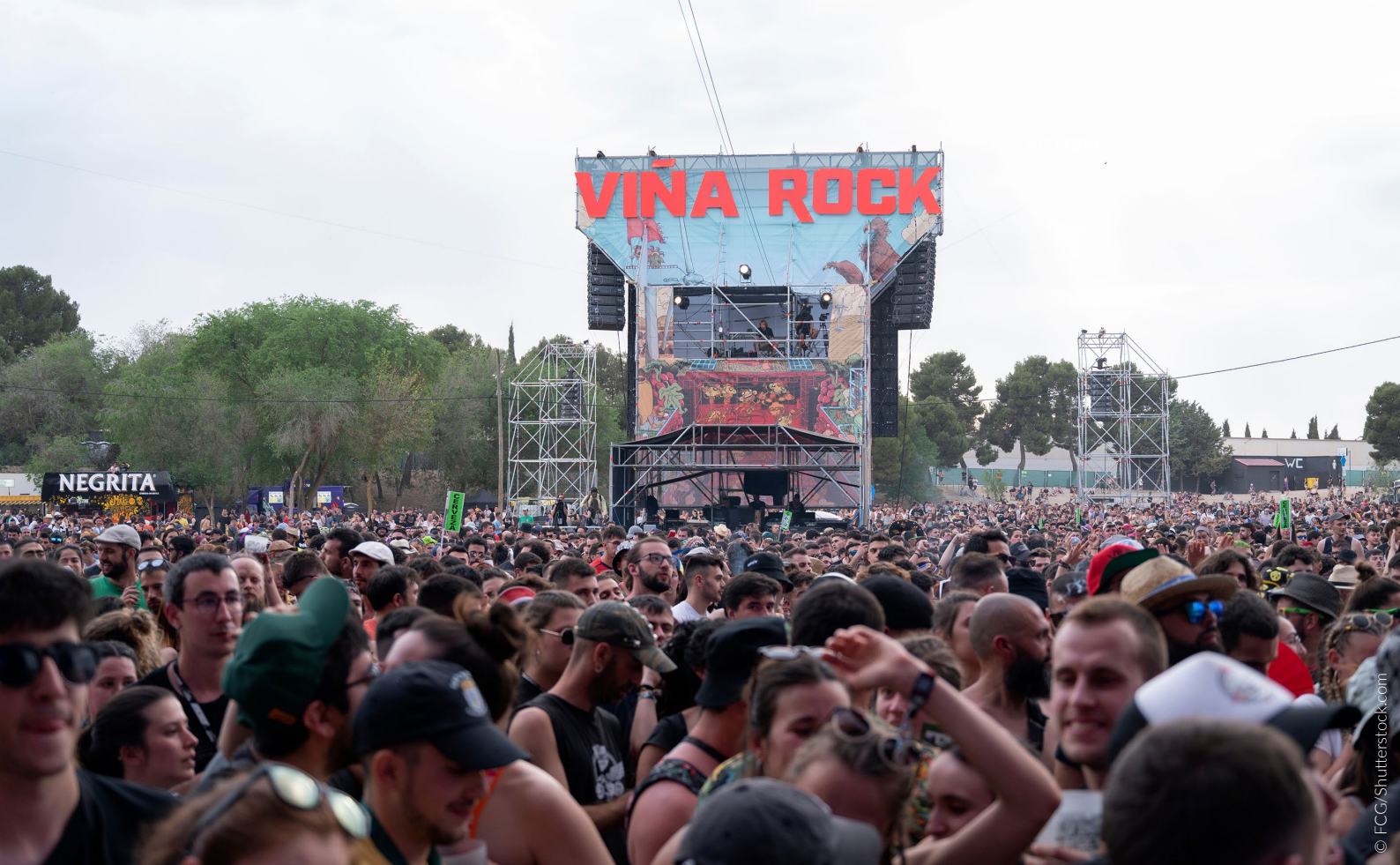
▲ FESTIVAL DE MÚSICA VIÑA ROCK VILLARROBLEDO, ALBACETE