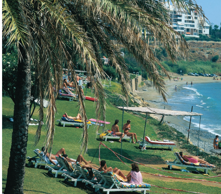
▲ STRAND VON ESTEPONA MÁLAGA

Das Gelände verfügt über Food Trucks , einen Barbereich und Ruhezone. Die Kühlung durch Wassernebel und kostenlose