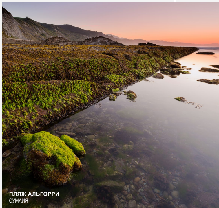
ПЛЯЖ АЛЬГОРРИ СУМАЙЯ

Вы можете проехать 60 километров побережья провинции Гипускоа и взглянуть с высоты ее громадных обрывов на Атлантический океан. Загляните в небольшие рыбацкие поселки, чтобы искупаться на их пляжах и попробовать местные блюда морской кухни. Или посетите геопарк Коста-Баска, территорию между побережьем Бискайского залива и баскскими горами, образованную муниципалитетами Мутрику, Деба и Сумайя.