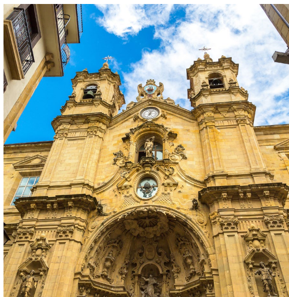
▲ ЦЕРКОВЬ САНТА-МАРИЯ ДЕЛЬ КОРО

федральным собором дель-Буен-Пастор (Доброго Пастыря), театром Виктори-и-Евгении и зданием городского совета, в котором находилось большое городское казино до запрета азартных игр в 1924 году.