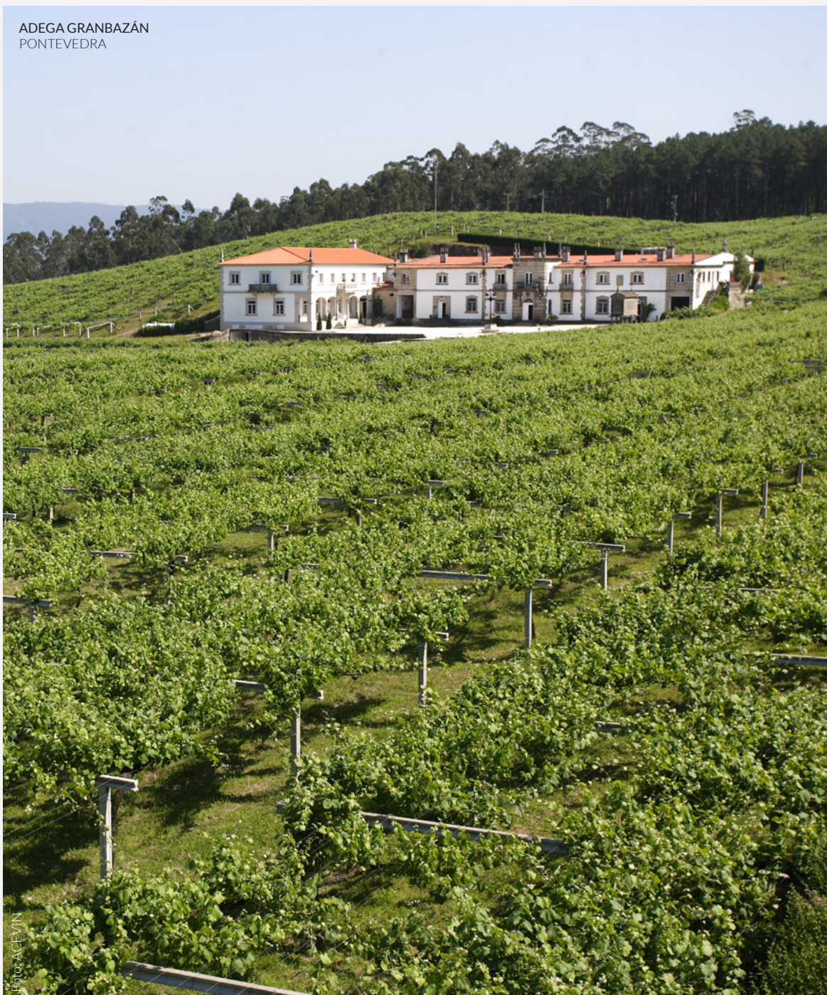
ADEGA GRANBAZÁN PONTEVEDRA

Deixa-te envolver pelo colorido das paisagens desta parte de Espanha. Aqui concentram-se algumas das zonas vinícolas mais prestigiadas. La Rioja , o País Basco , a Catalunha e a Galiza oferecem mil percursos para conheceres a sua apreciada gastronomia e a arte dos seus vinicultores.