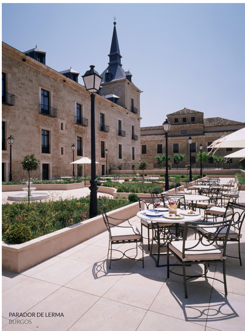
PARADOR DE LERMA BÚRGOS

Em Espanha poderás combinar os bons vinhos com o trabalho, o prazer e a diversão em adegas históricas, com caldos ancestrais situados debaixo da terra e onde se elaboram vinhos de forma artesanal. Ou contar com salas perfeitamente climatizadas em edifícios vanguardistas, desenhados por alguns dos melhores arquitetos do mundo. Contrastes sedutores para desfrutar de experiências únicas entre vinhedos e adegas.