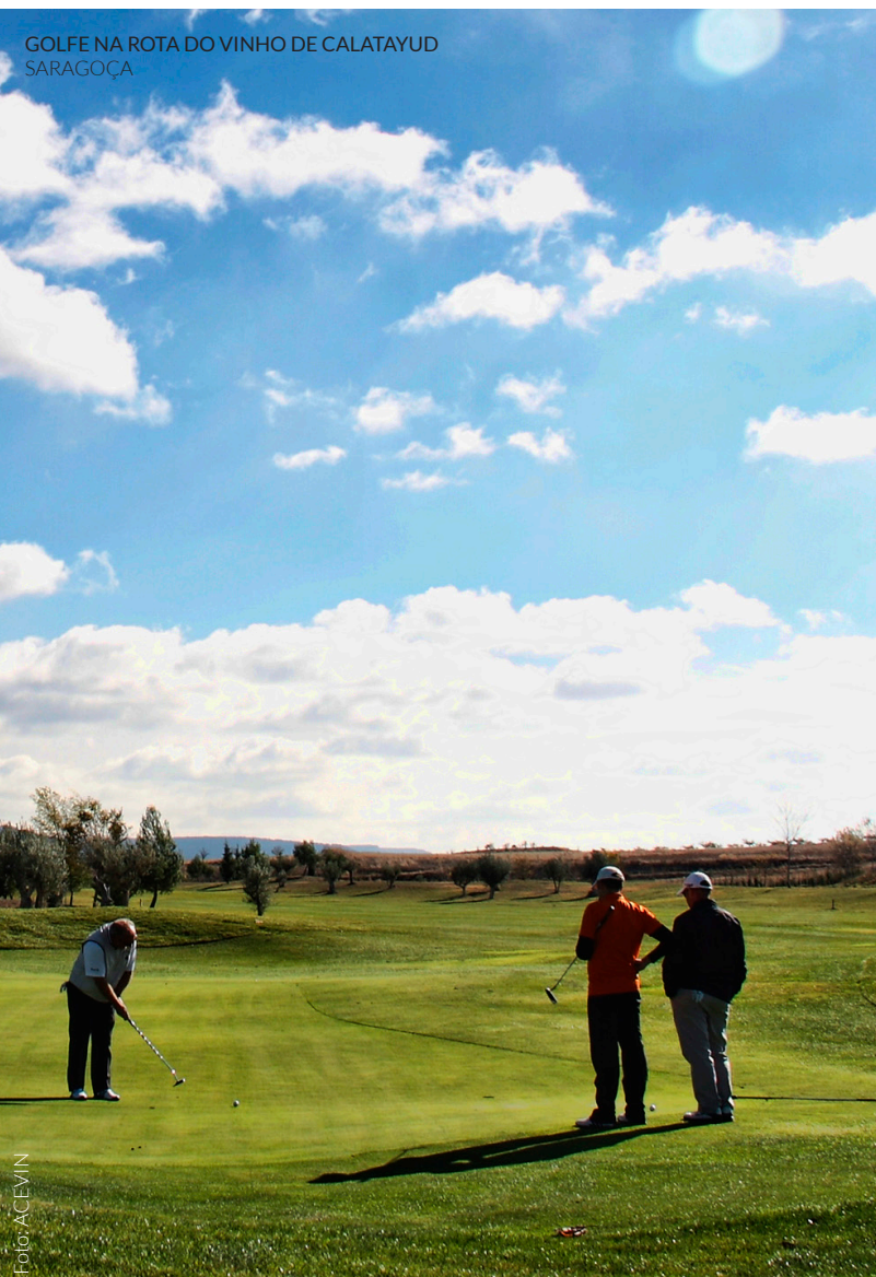
GOLFE NA ROTA DO VINHO DE CALATAYUD SARAGOÇA