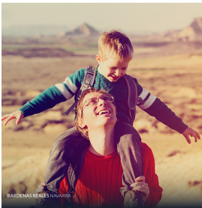
BARDENAS REALES NAVARRA