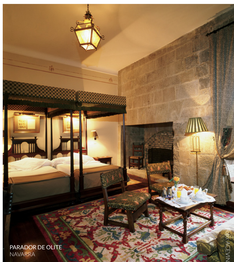
PARADOR DE OLITE NAVARRA

Vive uns dias inesquecíveis enquanto repões forças em qualquer um dos paradores de turismo de Espanha. A sua excelente oferta gastronómica e a sua variedade de serviços são uma garantia de qualidade e conforto. Alguns deles estão enquadrados nas rotas do vinho que percorrem a península. Em La Rioja poderás alojar-te no parador de Olite , integrado no monumental palácio medieval da localidade riojana. Se o teu destino é Ribera del Duero, aproveita a ocasião para passares umas noites no parador de Lerma . O moderno parador de Cádiz é perfeito para te adentrares na rota do brandy de Jerez, na sua piscina exclusiva e as suas instalações vão-te fazer sonhar acordado.