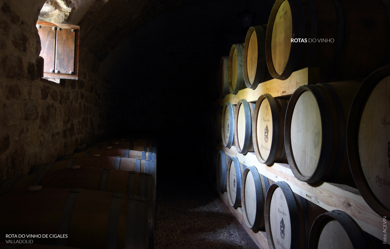
ROTA DO VINHO DE CIGALES VALLADOLID