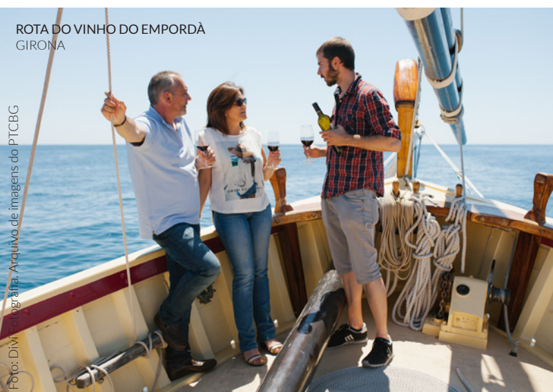
ROTA DO VINHO DO EMPORDÀ GIRONA