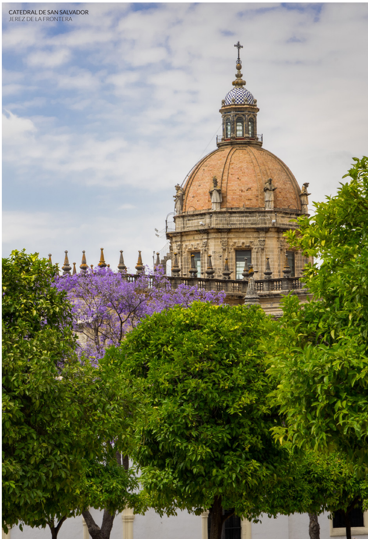
CATEDRAL DE SAN SALVADOR JEREZ DE LA FRONTERA