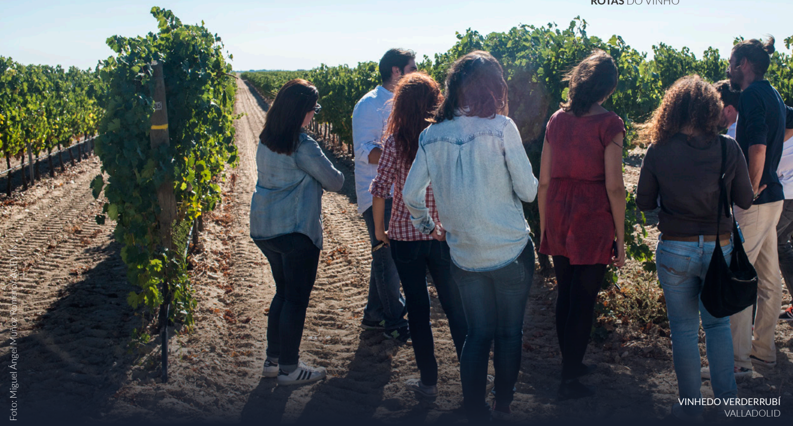
VINHEDO VERDERRUBÍ VALLADOLID