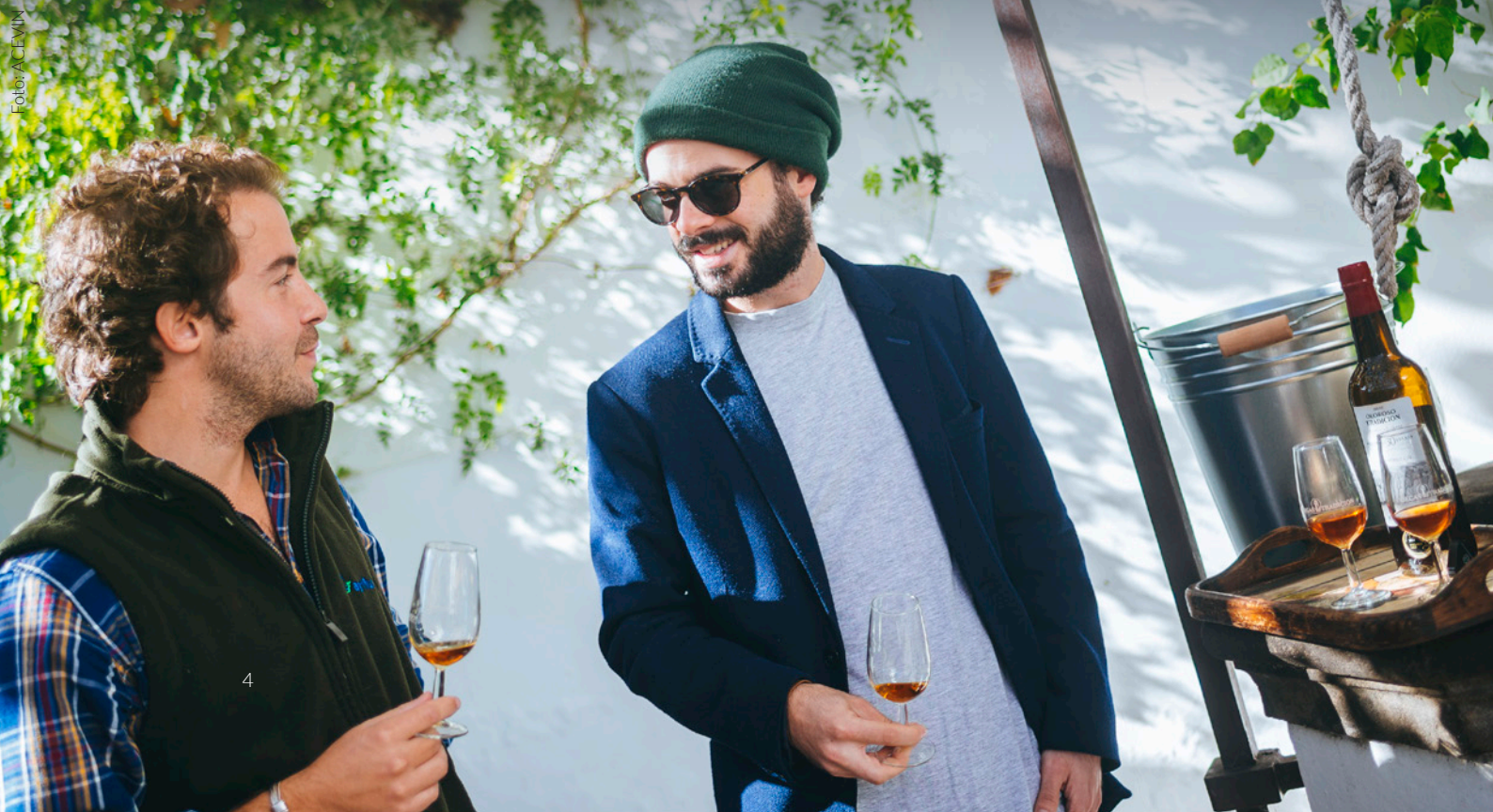
JEREZ DE LA FRONTERA CÁDIS

Aproveita um dos produtos estrela espanhóis com um plano enoturístico. Mergulha na cultura das suas gentes e ergue o teu copo para brindar.