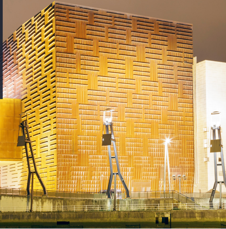
▲ KONGRESSPALAST EUSKALDUNA

Die hervorragende Lage seiner Veranstaltungszentren und sein breites Dienstleistungsangebot machen Bilbao (Baskenland) zu einer der attraktivsten europäischen Städte für Kongresse, Messen und Incentive-Reisen. Umgeben von einer grünen Landschaft mit herrlichen Wäldern und Bergen bietet sie eine Vielzahl an Möglichkeiten für die aktive Freizeitgestaltung.