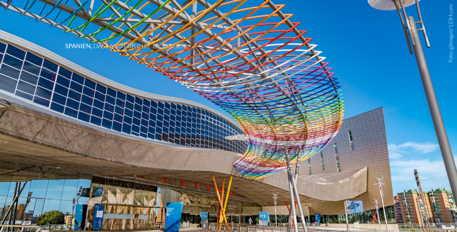
▲ MESSE- UND KONGRESSPALAST