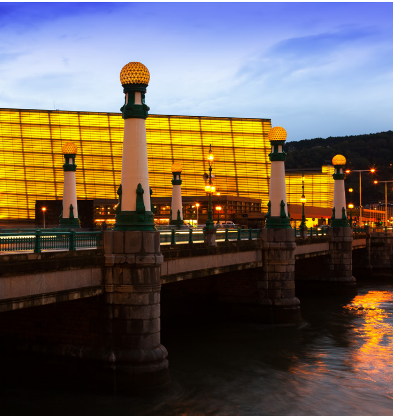
▲ KONGRESSPALAST KURSAAL