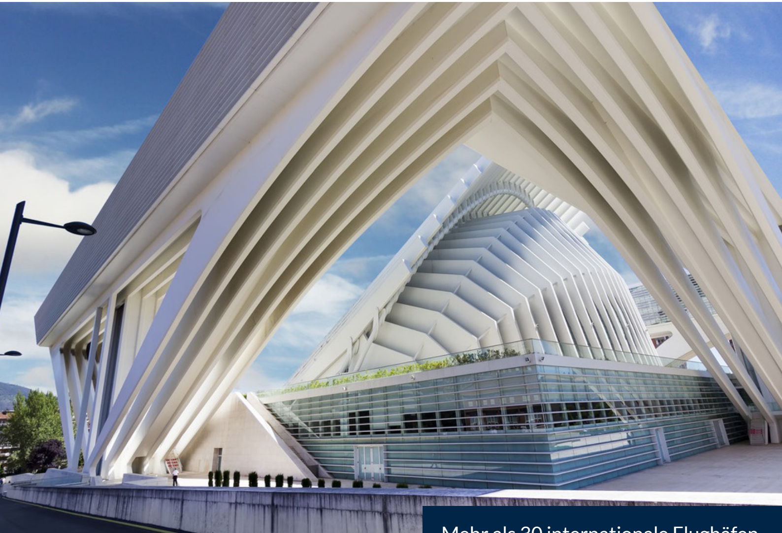
▲ KONGRESSPALAST OVIEDO

Ebenso verfügen die wichtigsten internationalen Verbände der Branche wie ICCA , SITE und MPI über spezielle Sektionen, in denen die spanischen Experten vertreten sind.