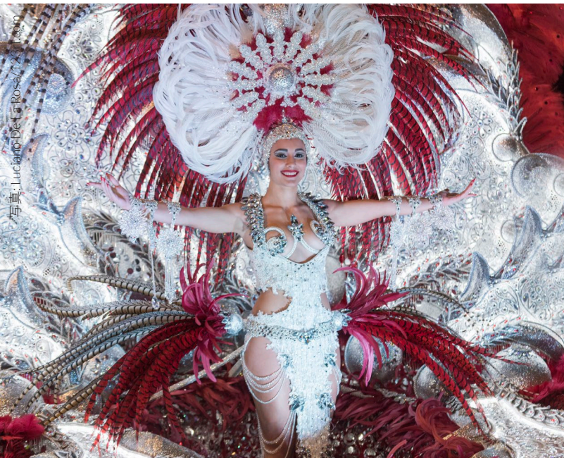
▲ テネリフェのカーニバル

スペインでは、一年を通じてさまざまな祭りが開催されます。祭りに参加してスペインを深く知り、感じ取り、そして味わいましょう。