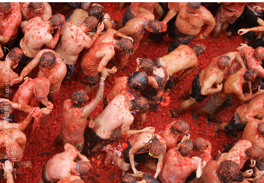
▼ トマト祭り(トマティーナ) ブニョール

参加者がトマトを投げ合うこの楽しいお祭りは、バレンシア州のブニョールで開催されます。この陽気な「戦い」に参加しませんか？