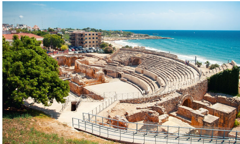
▲ 古代ローマ円形劇場 タラゴナ

バレンシアは、コントラストが鮮やかな、まさに地中海の真髄を体現した街です。歴史的な地区では、前衛的な建築群に驚かされることでしょう。科学と文化のための施設としてヨーロッパ随一の規模を誇る 芸術科学都市 は、ぜひ訪れておきたいものです。