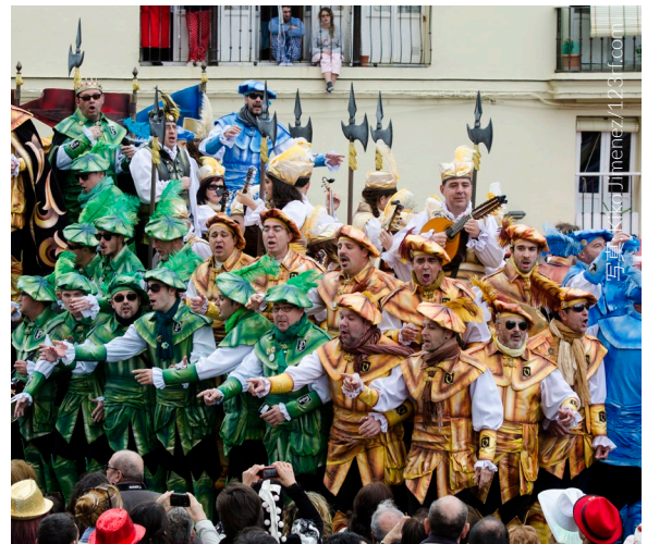
▲ カディスのカーニバル

火祭りが開催されると、バレンシアの街は音楽とユネスコ無形文化遺産に認定された世界的に有名なお祭り一色に染められます。この数日間、街のあちこちには二ノット（ユーモアたっぷりに社会風刺を込めた巨大な張り子人形）が闊歩します。最終日にこの人形が燃やされる瞬間が、祭りのクライマックスです。