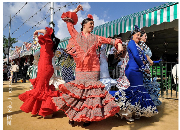
▲ 春祭り セビージャ

春祭りのセビージャは、朝から晩まで賑やかな雰囲気になります。祭りの会場と立ち並ぶ仮設小屋には音楽が鳴り響き、さまざまな料理を前に、シェリー酒（フィノ）や「レブヒート」と呼ばれるシェリー酒のソーダ割りのグラスを手にした人々が賑やかに談笑します。伝統料理の「ペスカイト・フリート」（魚のフライ）はぜひおためしください。馬や馬車による華やかなパレードも見逃せません。