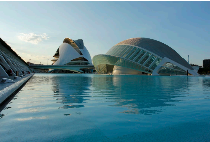
▲ 芸術科学都市 バレンシア