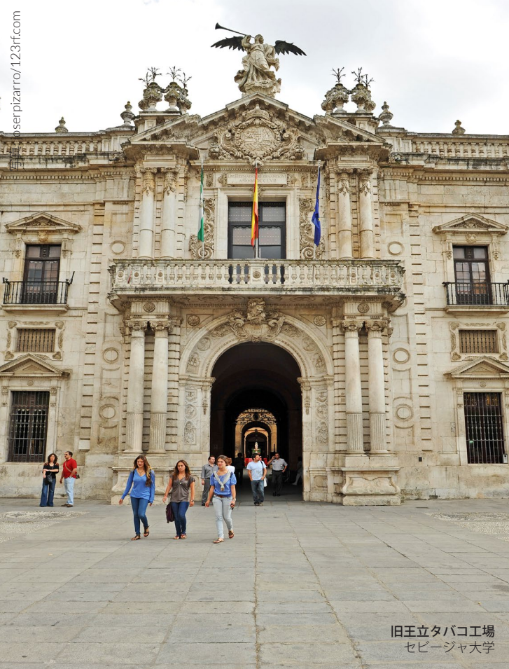
旧王立タバコ工場 セビージャ大学