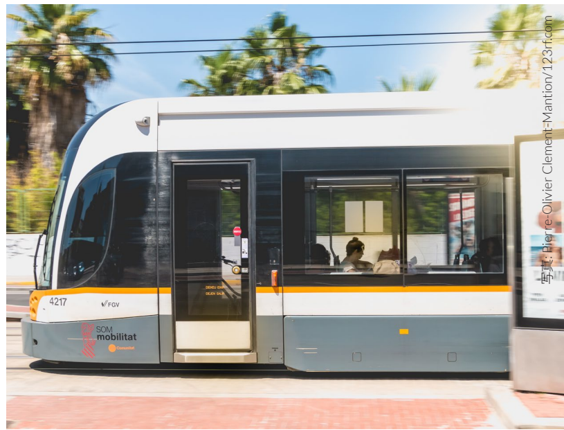
▲ トランビア (トラム) バルセロナ

ヨーロッパ各地からは、さまざまな会社が長距離バスを運行しています。スペイン国内でも、都市と都市を結ぶ インターシティバス が走っています。また、主要都市には市内を巡る 観光バス もあります。