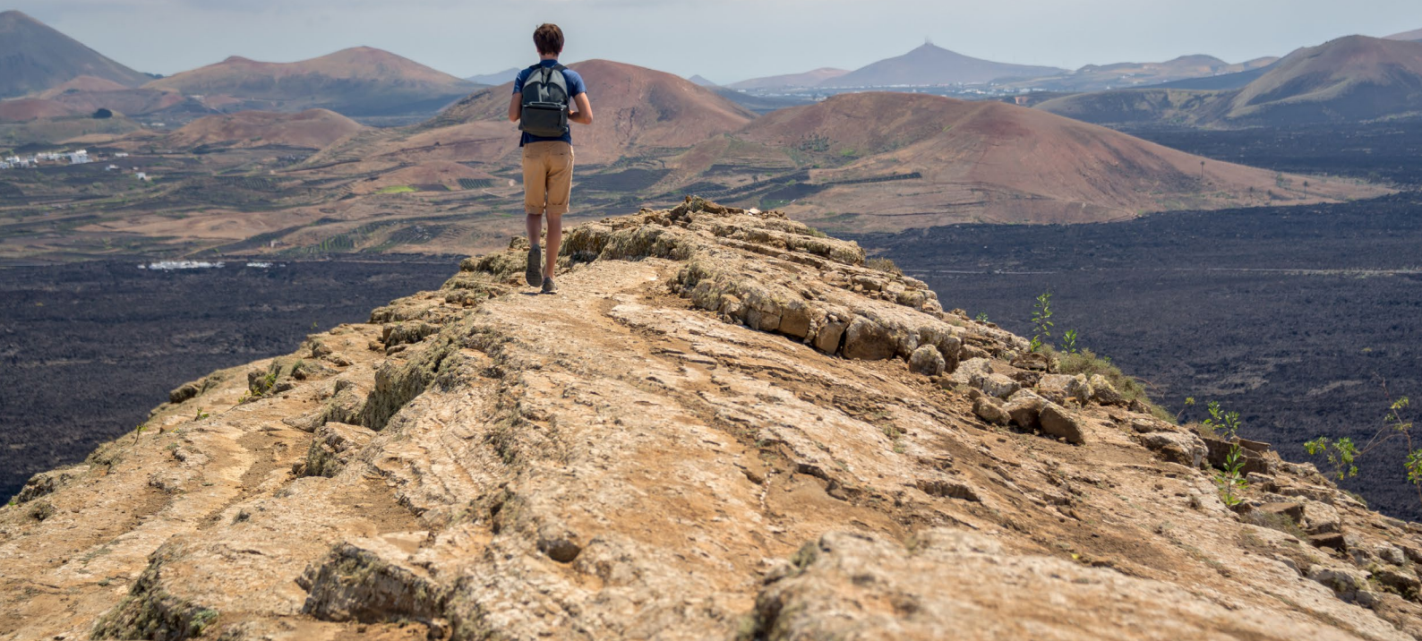
▲ ティマンファヤ国立公園 ランサロテ島