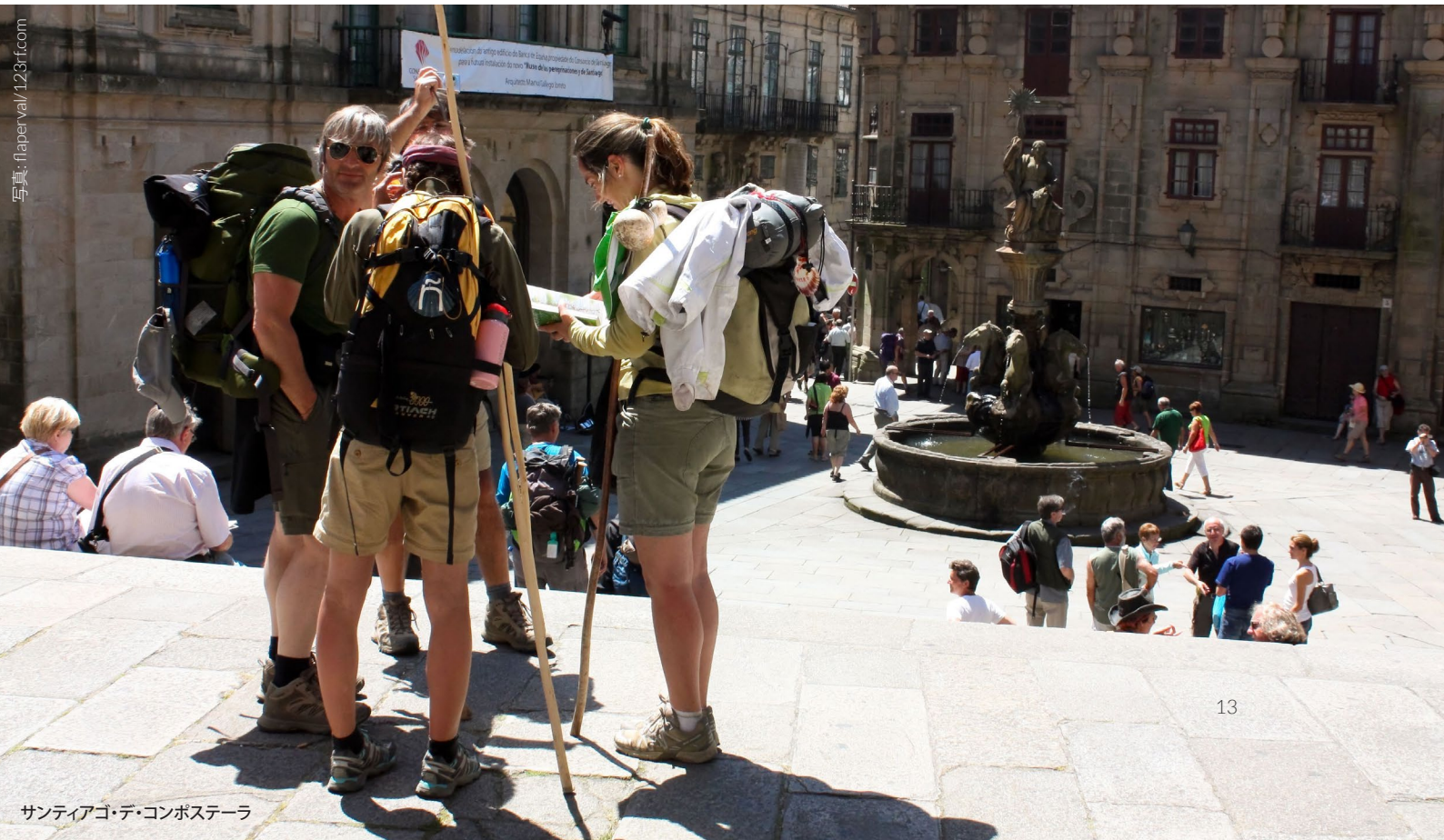
サンティアゴ・デ・コンポステーラ