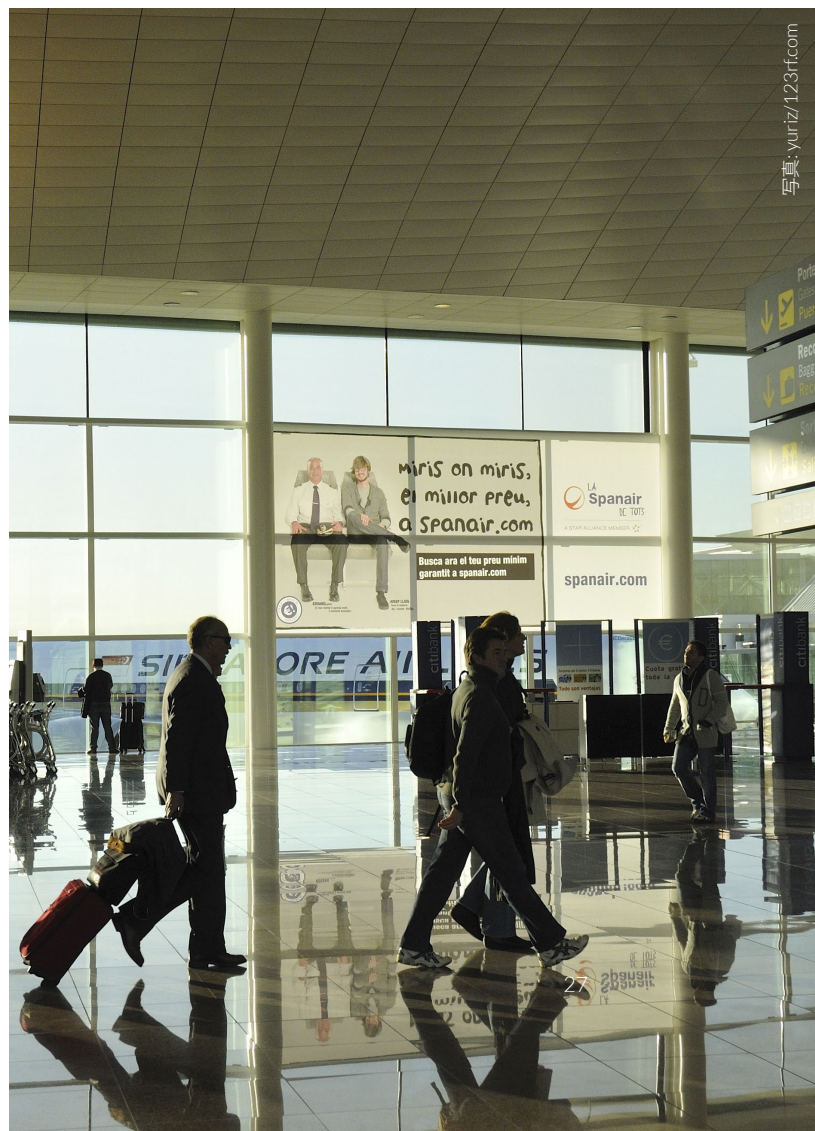
▼ バルセロナ=エル・プラット空港

スペイン国内の多くの空港には、世界の主要都市へと運航している路線を持つ航空会社が参入しています。国際路線の数が多い空港は、 アドルフォ・スアレス・マドリード=バラハス空港 、 バルセロナ=エル・プラット空港 、 パルマ・デ・マヨルカ空港 、 マラガ=コスタ・デル・ソル空港 、 グラン・カナリア空港 、 アリカンテ=エルチェ・ミゲル・エルナンデス空港 、 テネリフェ・スール空港 です。カナリア諸島を形成する7つの島にはそれぞれ空港があり、バレアレス諸島ではマヨルカ島、イビサ島、メノルカ島にあります。