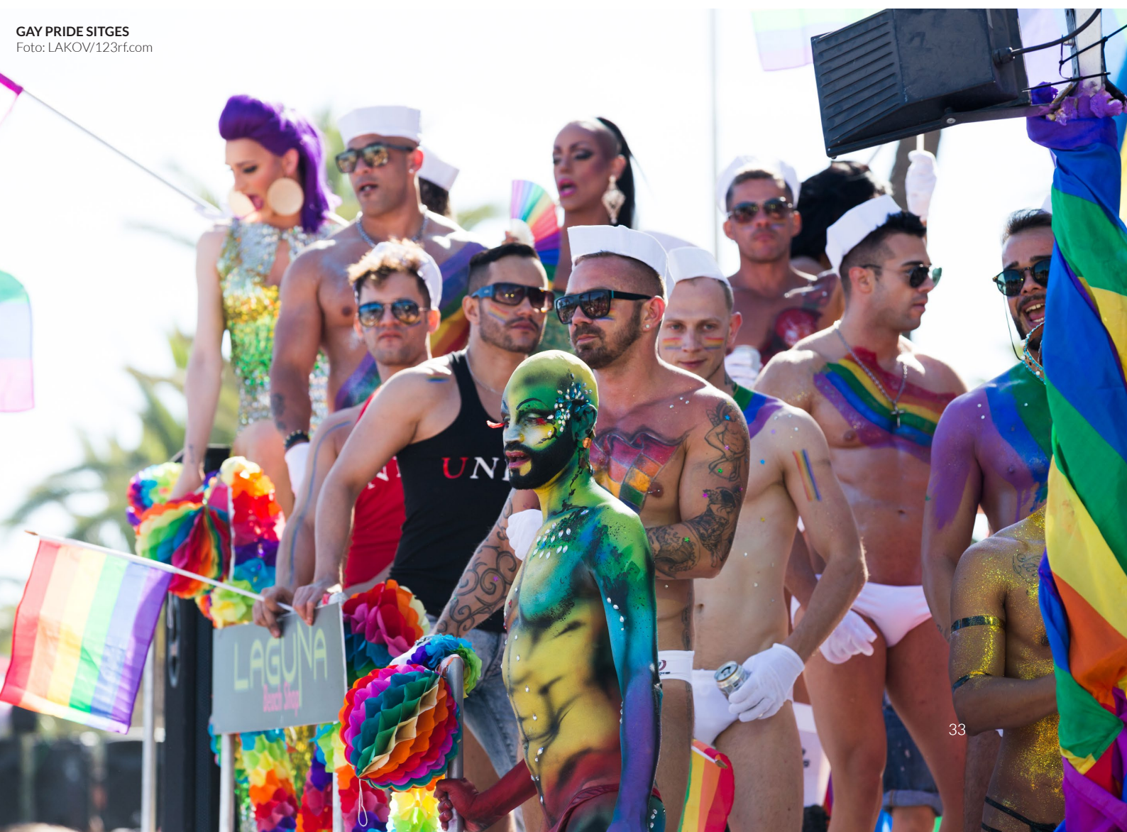
GAY PRIDE SITGES

Due settimane di festa ininterrotta... accetti la sfida? Visita Barcellona nel mese di agosto e scopri questo festival popolarissimo. Partecipa alle sue famose feste in piscina , balla al ritmo della musica selezionata dai Dj del momento e divertiti con la grande festa del parco acquatico Illa Fantasia . Il festival offre anche un programma di attività culturali e sportive , come pure incontri su temi LGBTIQ+.