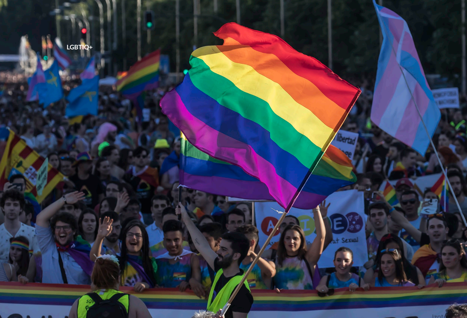
▲ SFILATA DEL GAY PRIDE VICINO ALLA PORTA DI ALCALÁ MADRID