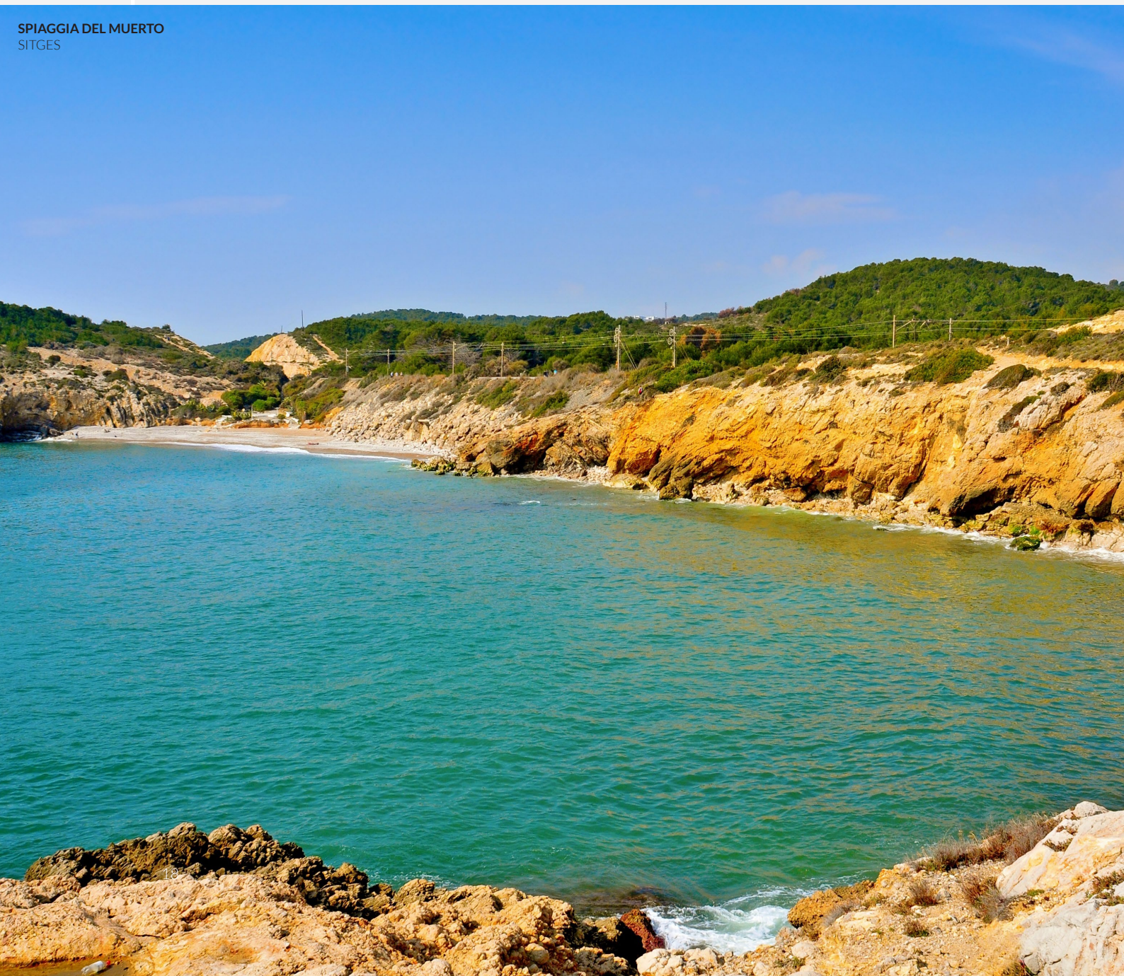
SPIAGGIA DEL MUERTO SITGES

Se vai a Barcellona, riserva qualche giornata per goderti Sitges. Le strade pittoresche, le spiagge e un'ampia offerta per il pubblico LGBTIQ+ ne fanno il luogo ideale da abbinare a una visita al capoluogo catalano. In questo paesino del litorale ti aspettano musei, ristoranti, discoteche, negozi e lunghe passeggiate. Vieni a scoprirlo!