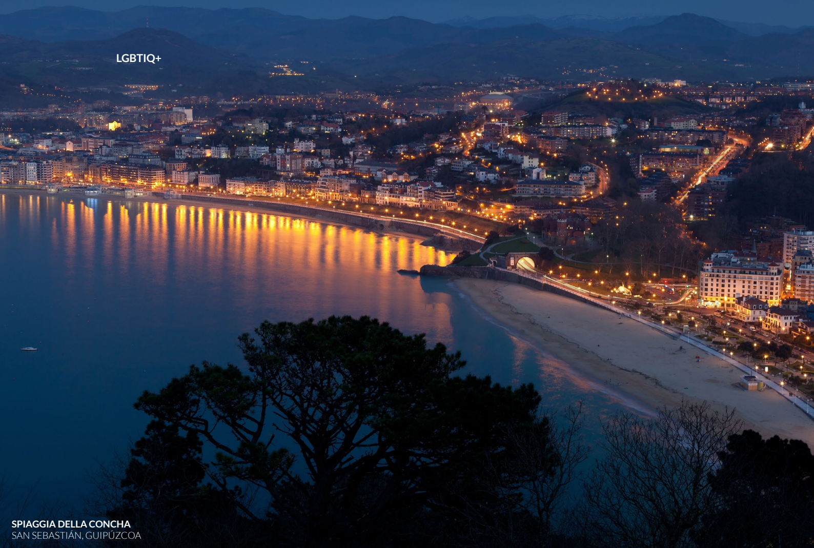
SPIAGGIA DELLA CONCHA SAN SEBASTIÁN, GUIPÚZCOA