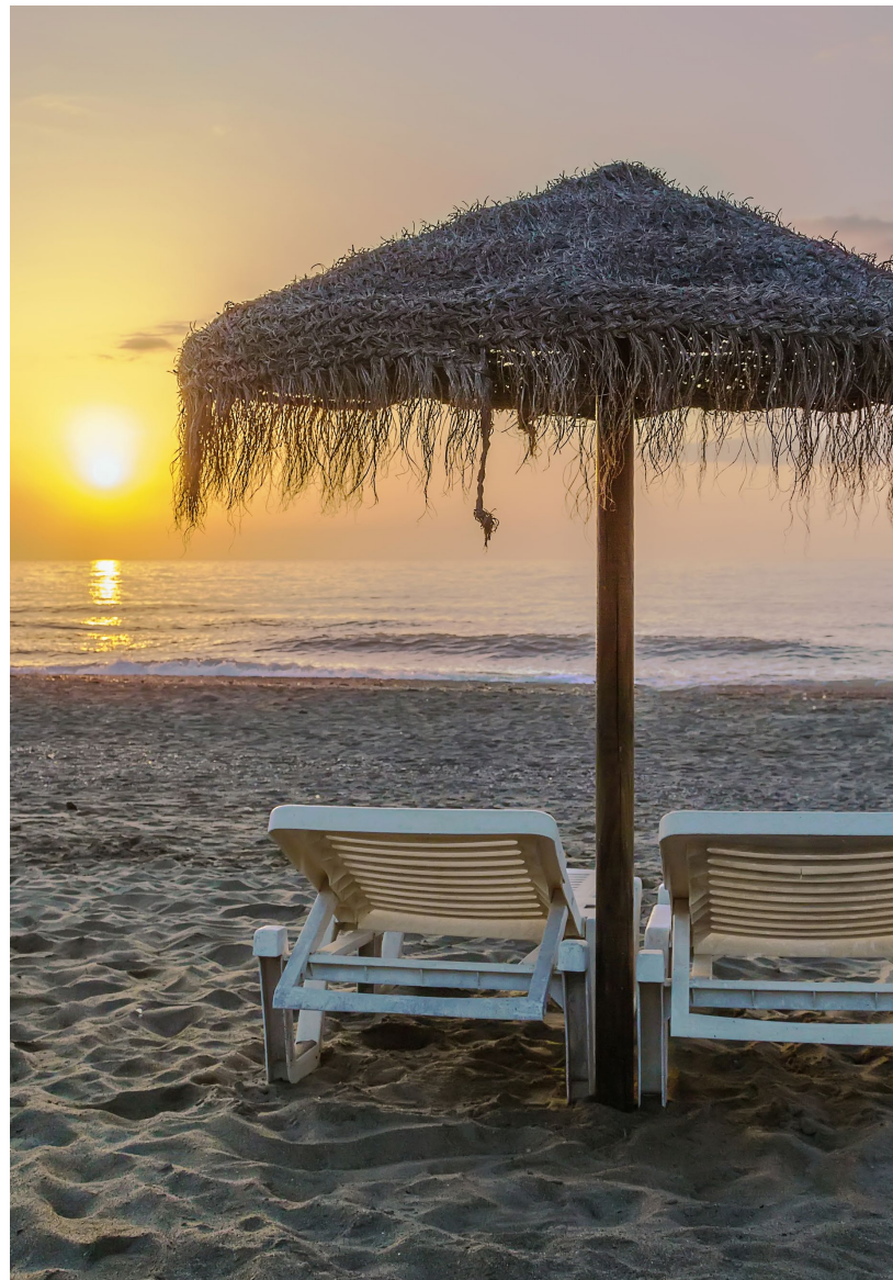
▲ SPIAGGIA DI TORREMOLINOS MALAGA

Quando ti sarai stancato del tumulto del lungomare, potrai lasciarti alle spalle il fermento della zona più turistica visitando il barrio del Calvario . È uno dei quartieri più tradizionali di Torremolinos. Potrai prendere qualcosa in una delle sue tipiche taverne confondendoti con la gente del posto. Piazza Blas Infante e la fontana dei Manantiales non ti lasceranno indifferente.