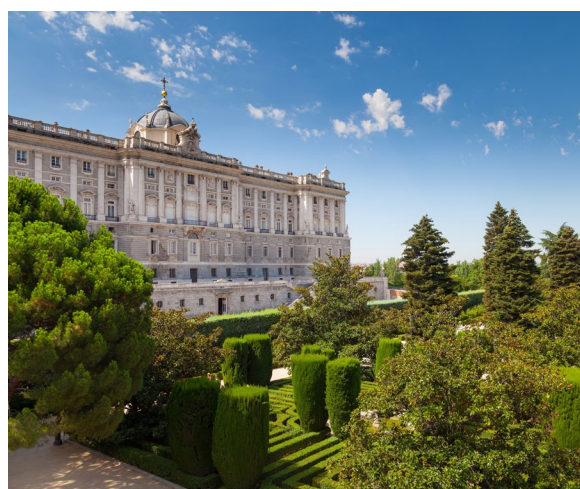
▲ PALAZZO REALE