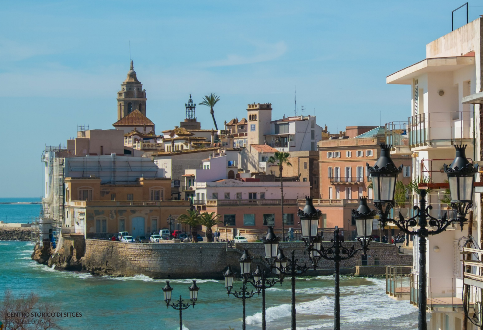
CENTRO STORICO DI SITGES BARCELONA