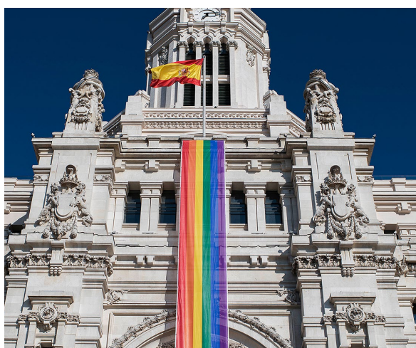
▲ COMUNE DI MADRID

Vieni a conoscere la capitale della Spagna e ti accorgerai che la diversità si respira in ogni angolo della città. Vuoi perderti in un quartiere appositamente pensato per te? Visita Chueca!