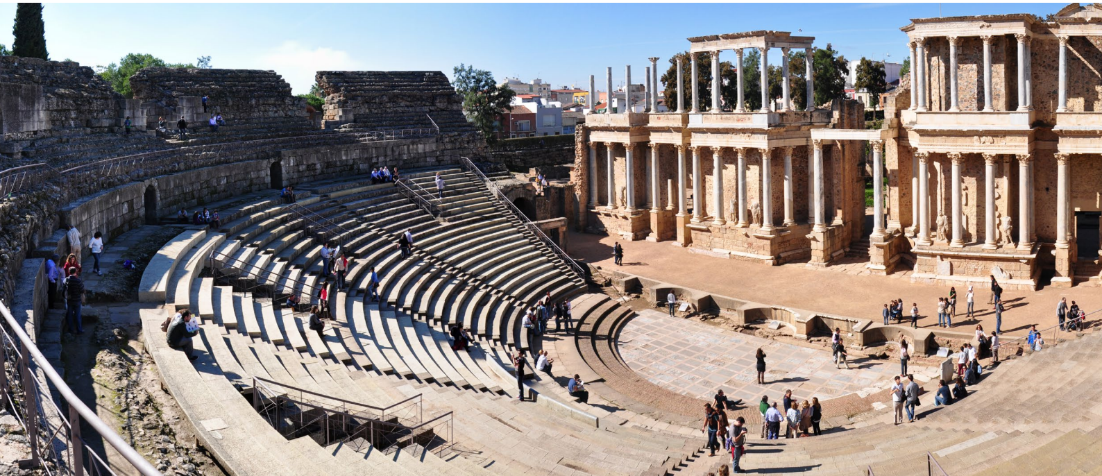
▲ RÖMISCHES THEATER, MÉRIDA