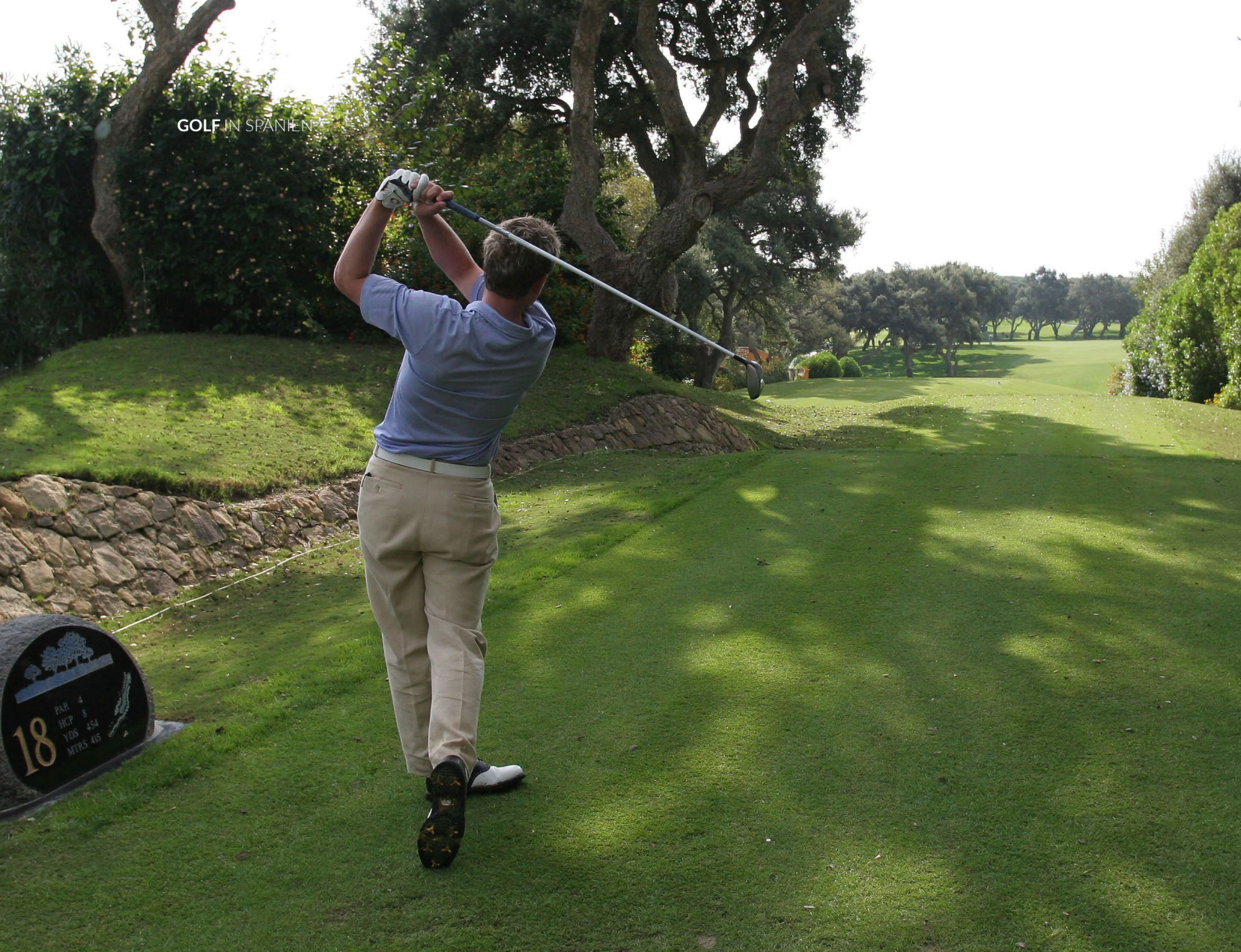
▲ REAL CLUB DE VALDERRAMA CÁDIZ