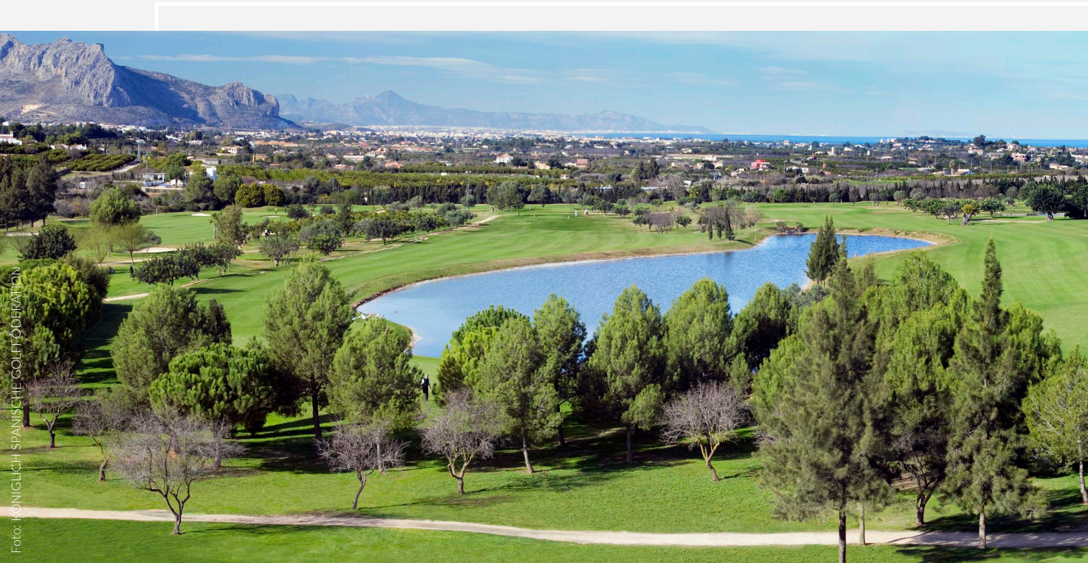
▲ SELLA GOLF RESORT & SPA, DENIA

An der kantabrischen Küste im sogenannten „Grünen Spanien“ erwarten Sie Golfplätze aller Art. Dort finden Sie, verteilt auf Galicien, Kantabrien, Asturien und das Baskenland, zudem auch zahlreiche Restaurants mit Michelin-Sternen. Fünf Minuten vom Zentrum von Donostia-San Sebastián entfernt bietet der in die Berglandschaft eingebettete Real Nuevo Club Golf de San Sebastián Basozabal einen der anspruchsvollsten Parcours des Landes. Er besitzt ein Restaurant mit Terrasse, wo Sie die exquisite Küche der Region und einen herrlichen Panoramablick auf die Landschaft genießen können. Wer die Haute Cuisine liebt, sollte in den Restaurants Martín Berasategui, Akelarre und Arzak einkehren, von denen jedes seine drei Sterne zweifellos verdient hat.