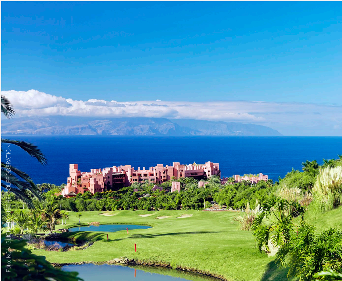
▲ ABAMA GOLF, GUÍA DE ISORA TENERIFFA

Verbinden Sie zwei Ihrer Leidenschaften: Golf und gutes Essen. Das gibt Ihnen die Möglichkeit, unsere Gastronomie auf vergnügliche und genussvolle Weise zu entdecken und neue Reiseziele zu entdecken, wo Sie Ihr Handicap verbessern können.