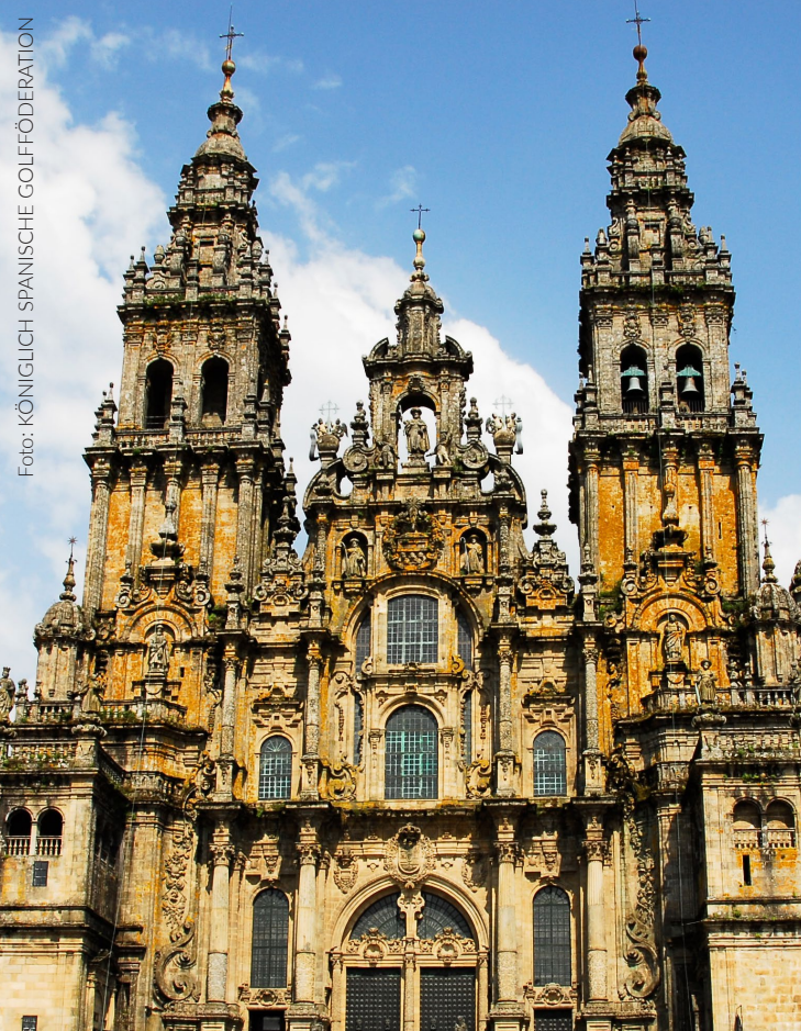
▲ KATHEDRALE VON SANTIAGO SANTIAGO DE COMPOSTELA