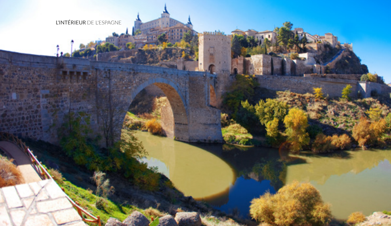
▲ PONT D'ALCÁNTARA TOLÈDE