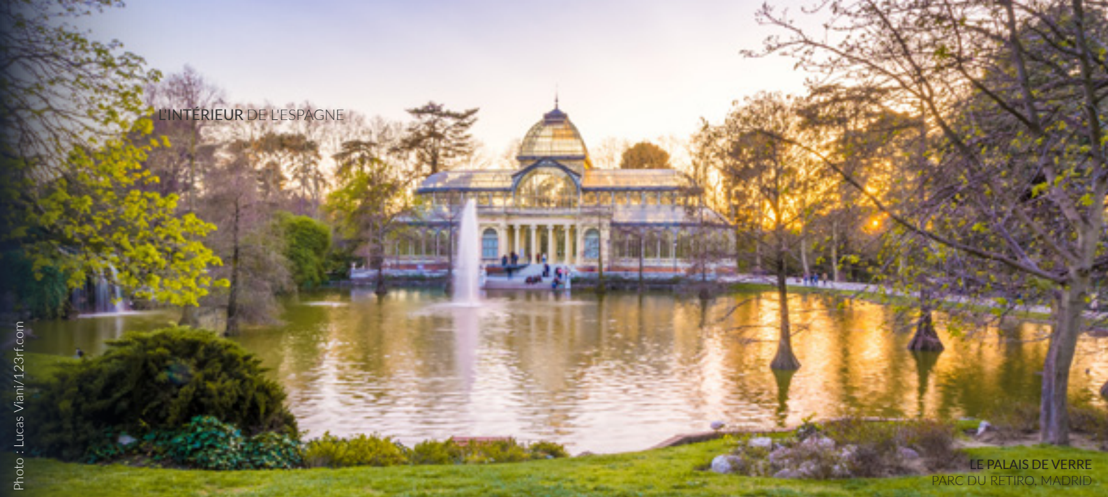
LE PALAIS DE VERRE PARC DU RETIRO, MADRID