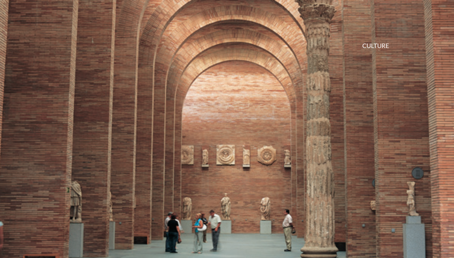
▲ MUSÉE NATIONAL D'ART ROMAIN MÉRIDA

À León, vivez une expérience artistique différente dans l'un des centres culturels les plus vivants et dynamiques d'Espagne, le musée d'art contemporain de Castille-León (MUSAC). Toujours en Castille-León, explorez tous les secrets de nos origines au musée de l'évolution humaine , à Burgos. Ce centre pédagogique spectaculaire et moderne présente les découvertes des célèbres sites archéologiques d' Atapuerca .