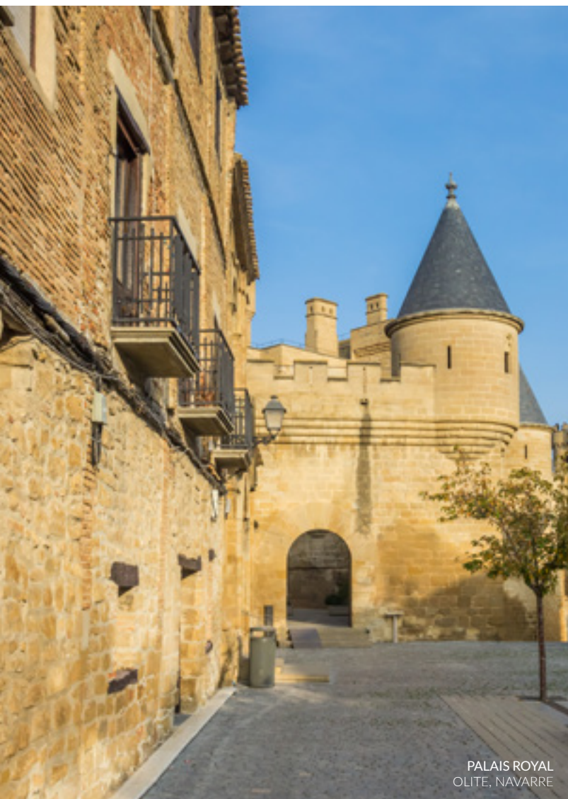
PALAIS ROYAL OLITE, NAVARRE