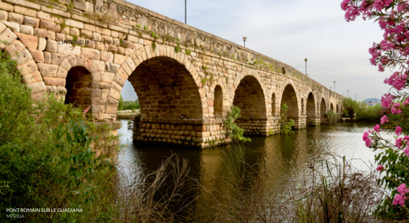
PONT ROMAIN SUR LE GUADIANA MÉRIDA

En Estrémadure, visitez la vieille ville de Cáceres , avec ses maisons-fortresses médiévales, ainsi que Mérida (province de Badajoz), pour son riche passé romain.