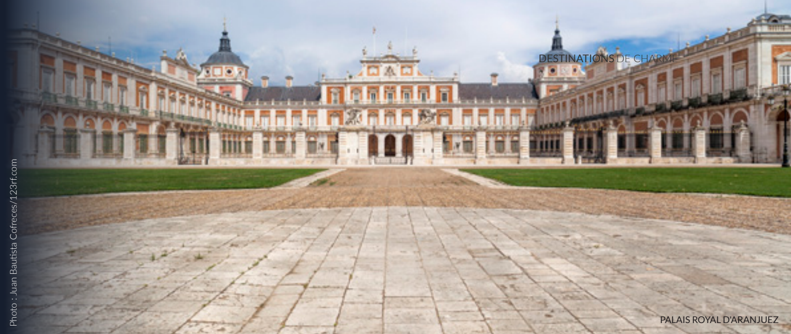
PALAIS ROYAL D'ARANJUEZ