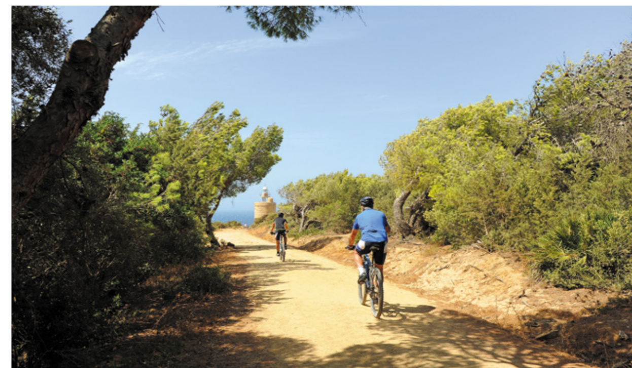
▲ ZAHARA DE LOS ATUNES KADYKS

Weź głęboki oddech i przygotuj się na odkrywanie Hiszpanii na rowerze: od Drogi św. Jakuba (Camino de Santiago) po Zielone Szlaki (Vías Verdes) - dawne drogi kolejowe zaadaptowane na trasy dla rowerów, poprzez szlaki na wyspach i trasy przecinające parki przyrody. Główne hiszpańskie miasta również oferują ścieżki rowerowe, które pozwolą poznać miejskie uroki w niecodzienny sposób i dodatkowo cieszyć się ich terenami zieleni.