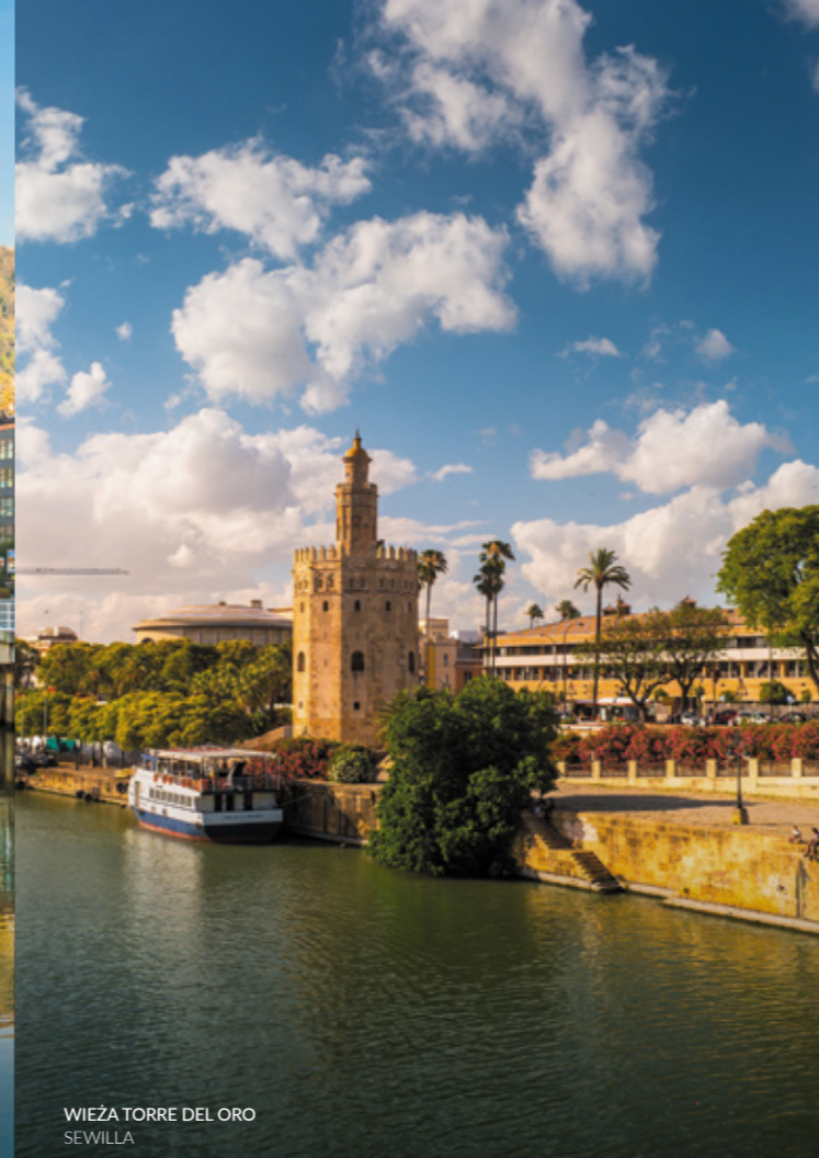
WIEŻA TORRE DEL ORO SEWILLA