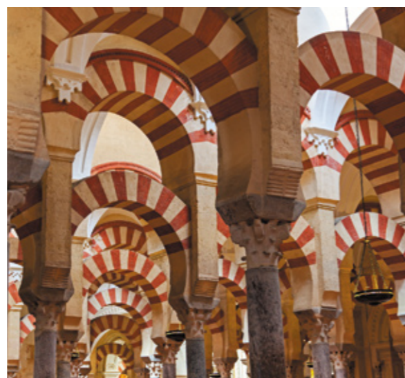
▲ WIELKI MECZET - KATEDRA W KORDOBIE

Pospaceruj wśród setek kolumn i łączących je łuków, podziwiał kopuły, koronkowe marmury, mozaiki, rysunki i inne elementy. A w samym środku zaskoczy cię chrześcijańska katedra. Meczet jest architektoniczną perłą na zabytkowej starówce Kordoby i symbolem muzułmańskiego dziedzictwa w Hiszpanii.