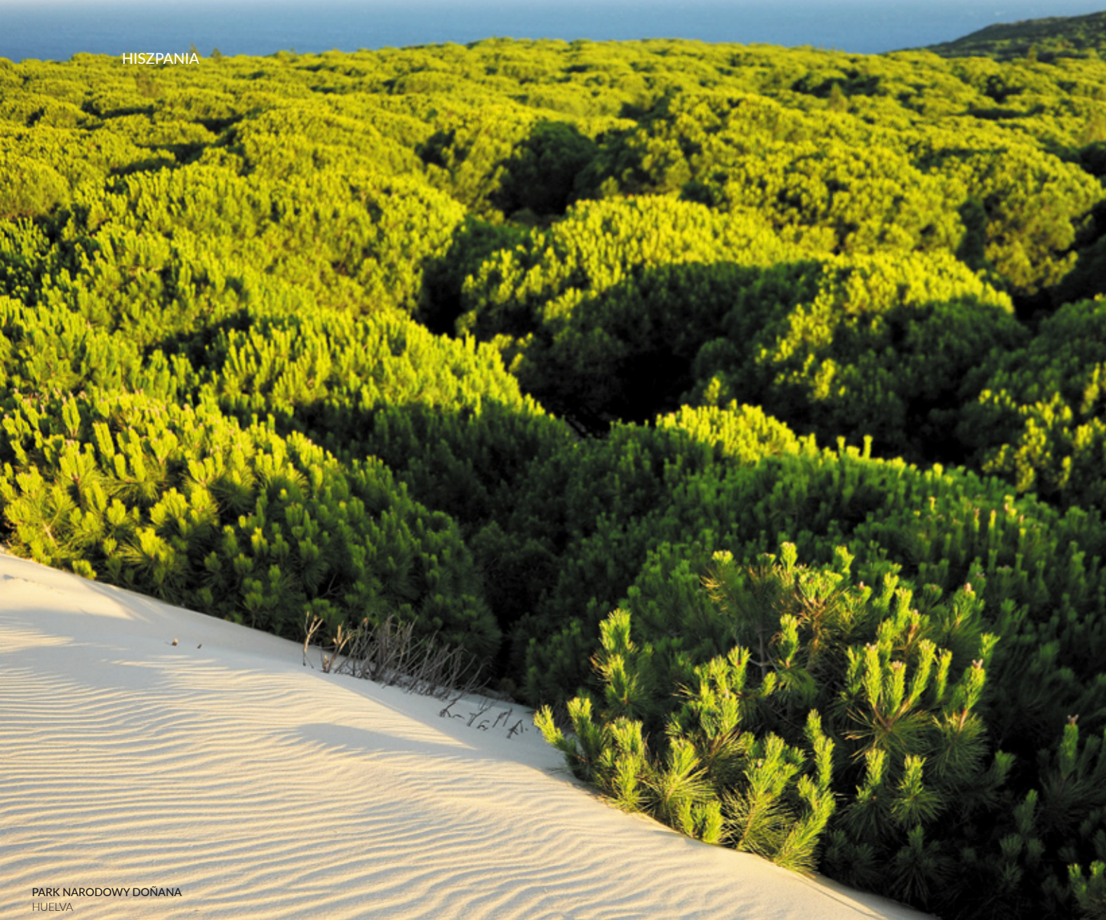
PARK NARODOWY DOÑANA HUELVA

Odkryj urok wysp pełnych kontrastów. Zwiedzając pola lawowe w Parku Narodowym Timanfaya na Lanzarote, będziesz podziwiać jeden z najbardziej zachwycających krajobrazów wulkanicznych na świecie. W lasach Garajonay , na La Gomerze, zanurzysz się w gęszcz fascynującej wiecznej zieleni często