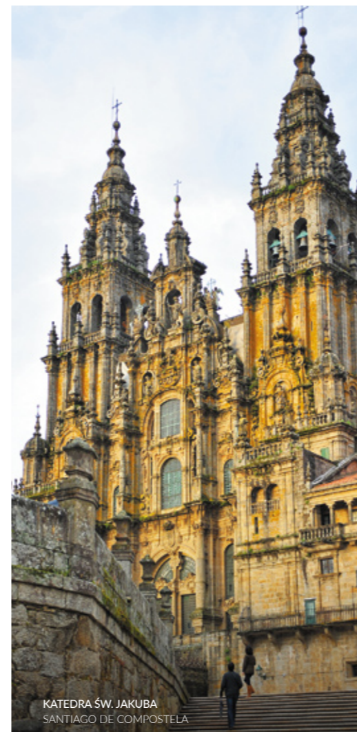
KATEDRA ŚW. JAKUBA SANTIAGO DE COMPOSTELA