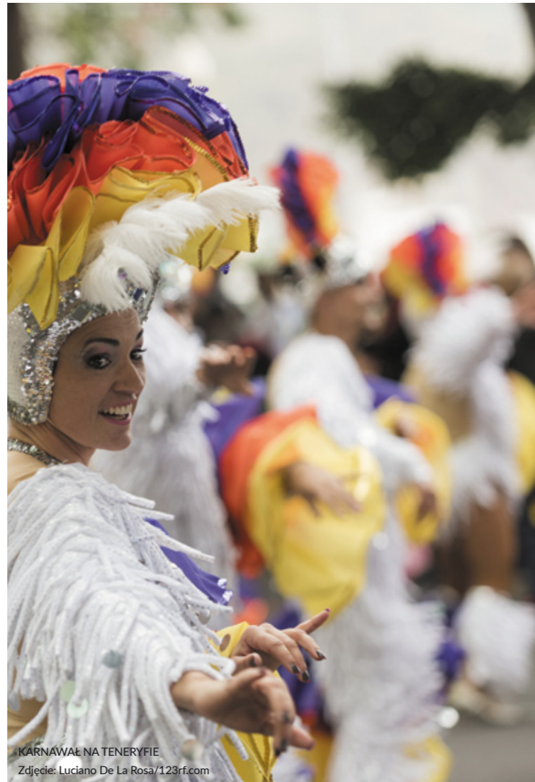
KARNAWAŁ NA TENERIFIE

Z kolei podczas karnawału, święta poprzedzającego Wielkanoc, panuje beztroska, radość i swoboda ekspresji. Weź udział w pełnych fantazji paradach w rytm muzyki. Wyjątkowe są te w Santa Cruz de Tenerife , a nie mniej widowiskowe obchody zobaczymy w Kadyksie i Águilas .