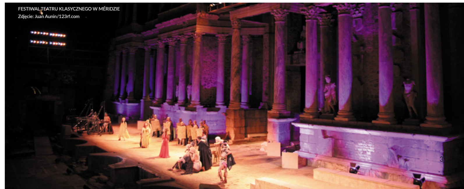
FESTIWAL TEATRU KLASYCZNEGO W MÉRIDZIE