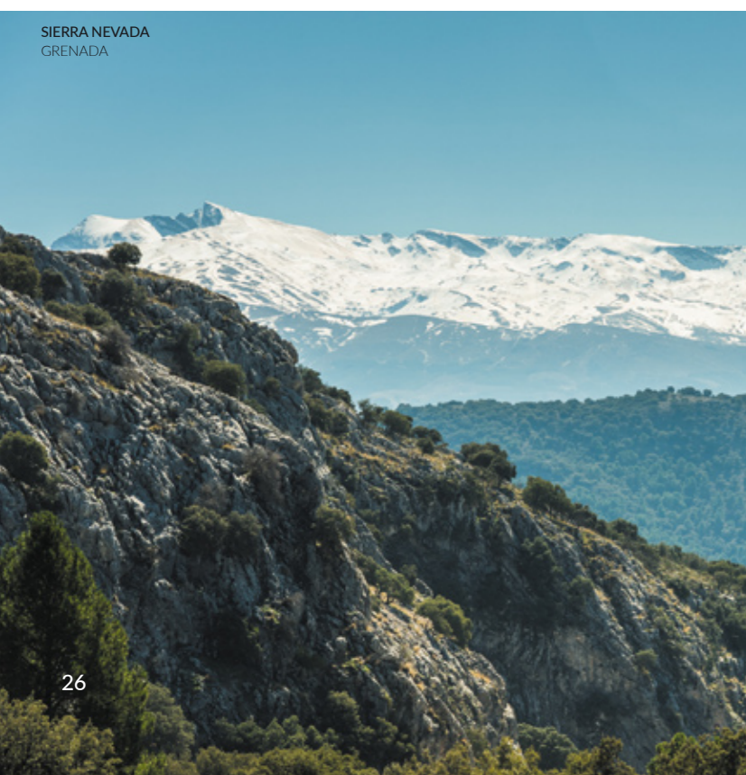
SIERRA NEVADA GRENADA

Obserwowanie ptaków to jedno z najprzyjemniejszych doświadczeń, jakie przyroda ma do zaoferowania. Na obszarach takich jak Pireneje czy pasma górskie Estremadury , Nawarry i Kastylii y León możesz cieszyć oczy ornitologiczną różnorodnością. We wspomnianych wcześniej parkach narodowych znajdziesz najlepsze miejsca sprzyjające obserwacji życia ptaków.