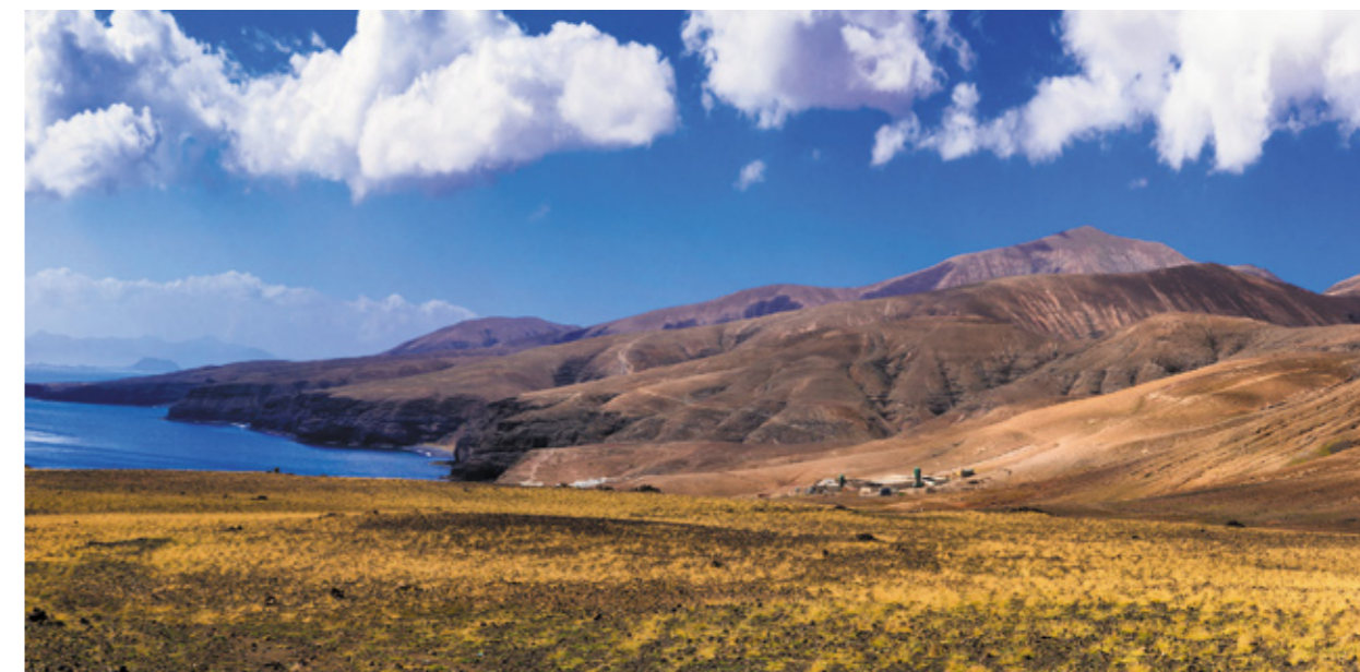
▲ TIMANFAYA LANZAROTE

spowitej gęstą mgłą. Archipelag Cabrera na Balearach i Wyspy Atlantyckie w Galicji to idealne miejsce dla miłośników nurkowania. Będziesz mógł poznać bardziej szczegółowo wszystkie parki istniejące w Hiszpanii, odwiedzając strony internetowe www.spain.info i www.parquesnacionales.ign.es .