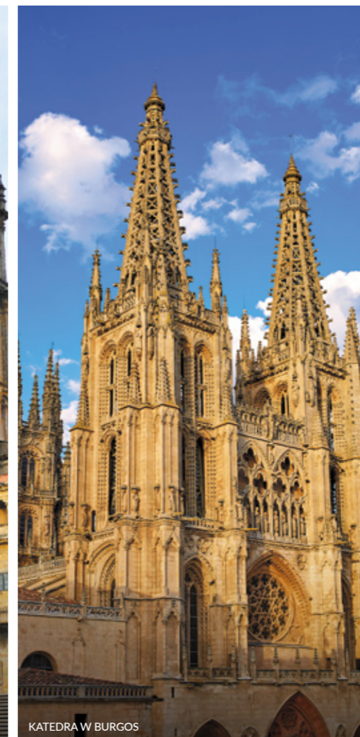
KATEDRA W BURGOS