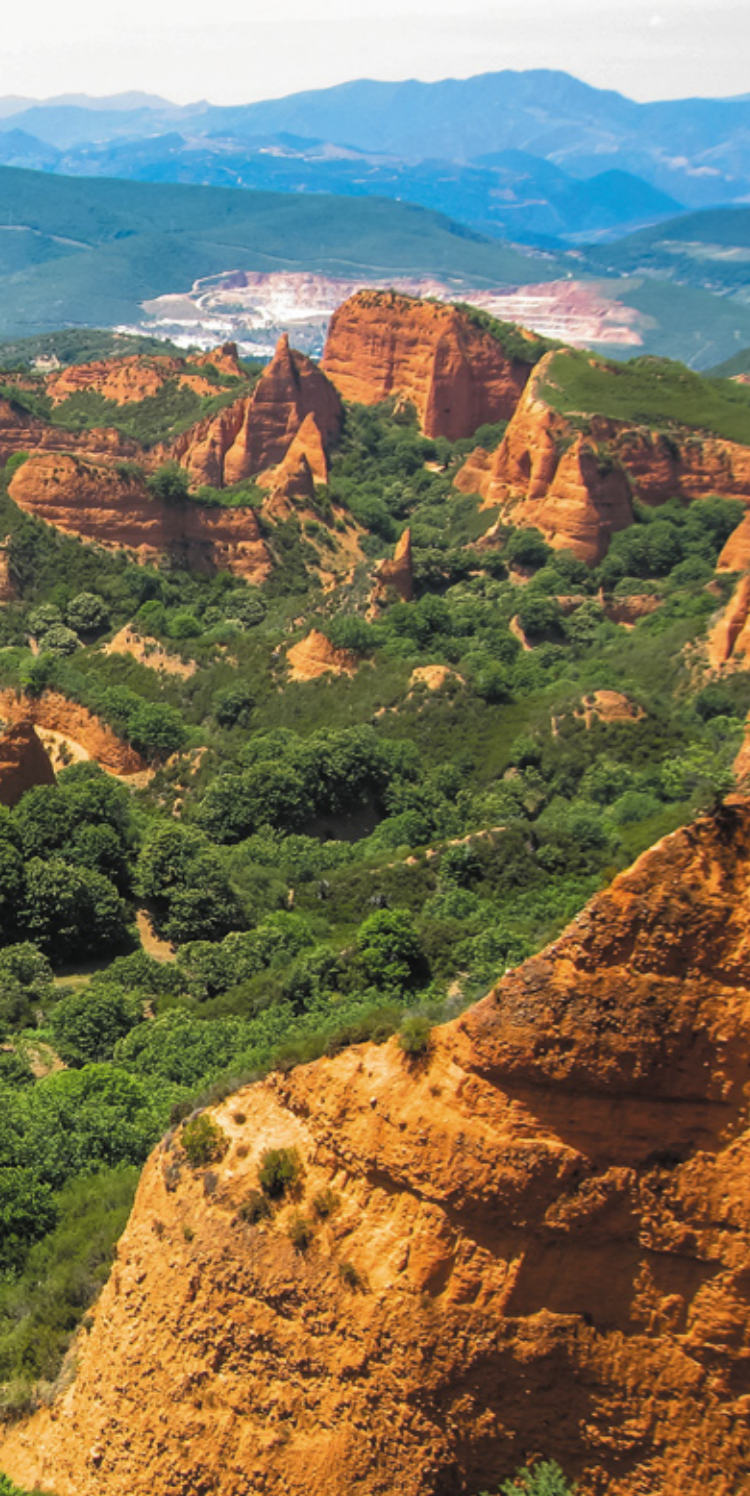
LAS MÉDULAS EL BIERZO, LEÓN

Ministerstwo Przemysłu, Handlu i Turystyki Wydane przez: © Turespaña Projekt: Lionbridge NIPO: 115-20-017-2