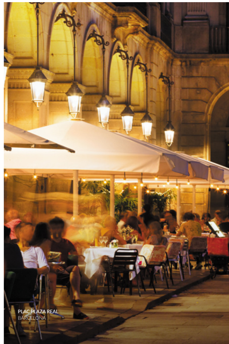
PLAC PLAZA REAL BARCELONA

Bilbao jest przykładem doskonałej integracji w przestrzeni publicznej najbardziej innowacyjnej architektury z dawną przemysłową przeszłością. Będziesz pod wrażeniem zaprojektowanego przez Kanadyjczyka Franka Gehry'ego Muzeum Guggenheima , niewątpliwie najwybitniejszego przykładu rewaloryzacji architektonicznej miasta i jego niepodważalnego symbolu. Poznasz tu arcydzieła sztuki nowoczesnej i współczesnej. Ponadto muzeum oferuje różne ciekawe zajęcia artystyczne, dzięki którym wizyta w nim może mieć twórczy charakter.