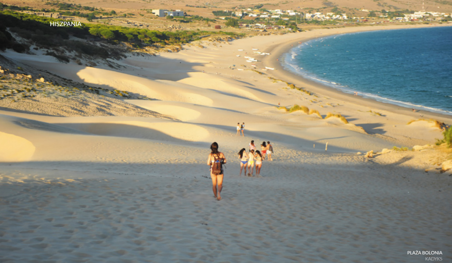
PLAŻA BOLONIA KADYKS