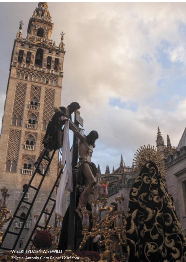
WIELKI TYDZIEŃ W SEWILLI

Na osobną wzmiankę zasługuje Wielki Tydzień w Sewilli . Kulminacyjnym momentem obchodów jest „Madrugá”, noc z czwartku na piątek, podczas której upamiętnia się Mękę Pańską, a tysiące wiernych towarzyszy niesionym w procesji religijnym scenom Drogi Krzyżowej. Spróbuj typowych dla tego święta słodyczy: tzw. torrijas (rodzaj słodkich tostów francuskich), przysmaku dla łasuchów.