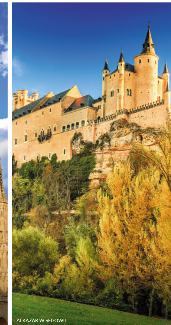
ALKAZAR W SEGOWII