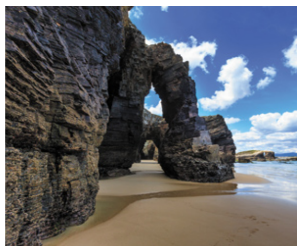
▼ PLAŻA KATEDR RIBADEO, LUGO

Odwiedź pełne uroku wioski rybackie, ciesz się przyrodą w jej najczystszej postaci, sąsiadującą z piaskiem wybrzeża i podziwiaj klify, których widok zapiera dech w piersiach. To synteza Galicji . Odkryjesz tu przepiękne riasy Ribadeo, Foz i Viveiro, gdzie rzeki spotykają się z Morzem Kantabryjskim. W Ribadeo koniecznie odwiedź spektakularną Plażę Katedr (Playa de las Catedrales) uważaną za jedną z najwspanialszych na świecie.