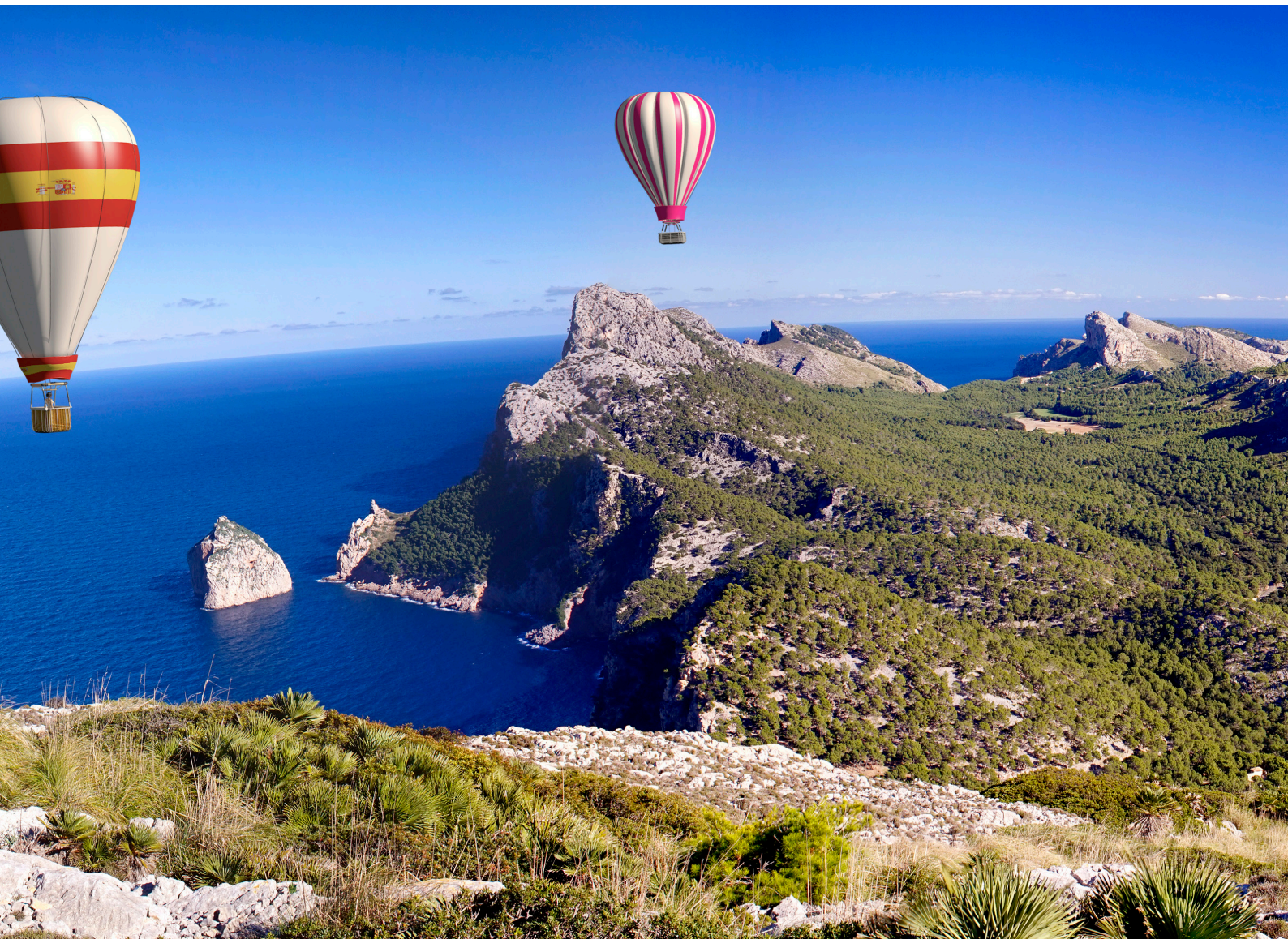
▲ IM HEISSLUFTBALLON ÜBER MALLORCA