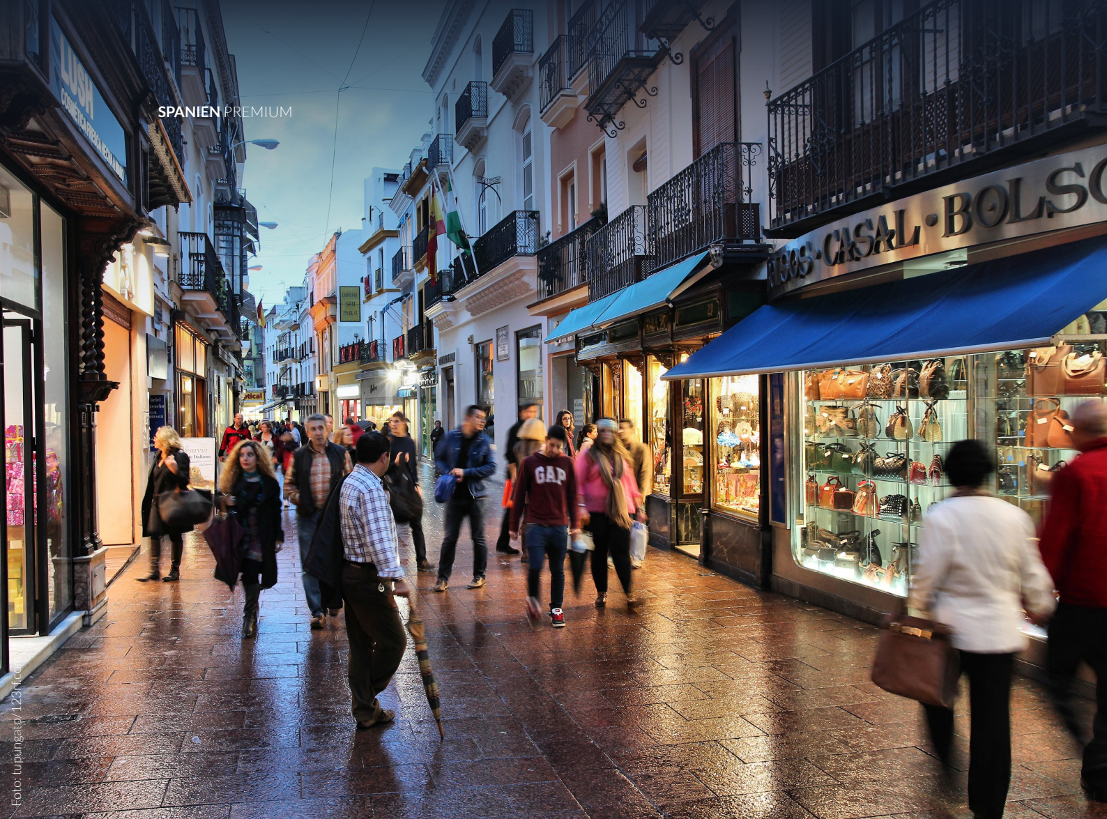
▲ CALLE SIERPES SEVILLA