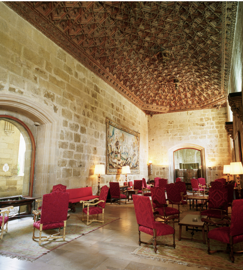
▲ PARADOR-HOTEL LEÓN

In den früheren Windmühlen aus dem Mittelalter in La Mancha können Sie die Schönheit ihrer Holzdächer und die Wände aus den ursprünglichen Steinen bewundern. Nach ihrer Renovierung wurden daraus fantastische Hotels, in denen Ihre Events ein ganz besonderes Flair erhalten. Früher wurde in diesen herrlichen Gebäuden Weizen oder Gerste gemahlen. Heute können Sie dort die Bereiche mit Spa oder einen Kamin in Ihrer Suite genießen.