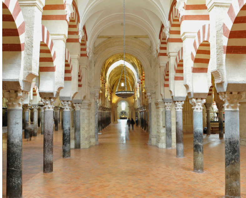
▲ INTÉRIEUR DE LA MOSQUÉE DE CORDOUE