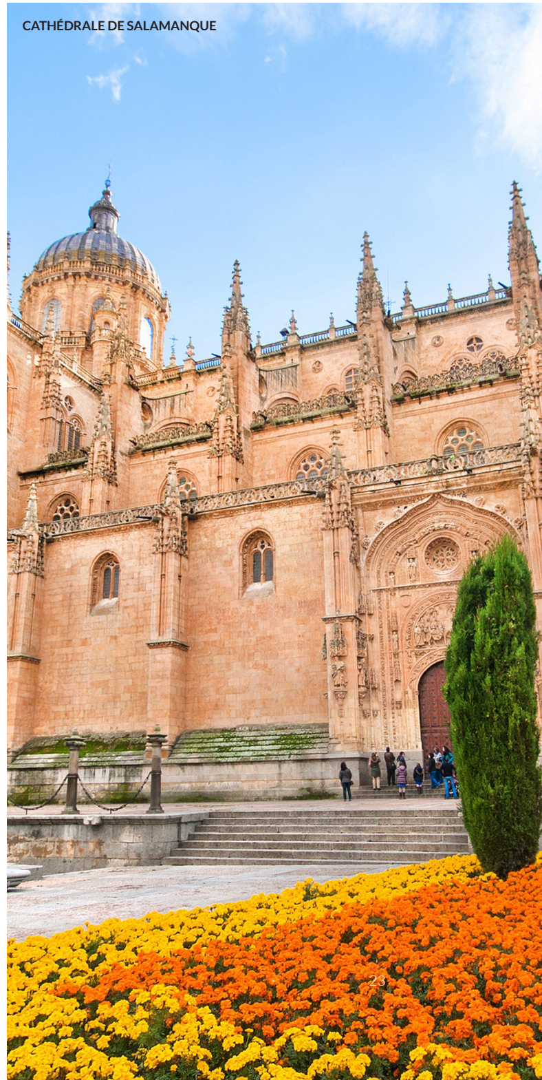
CATHÉDRALE DE SALAMANQUE

Remontez le temps à travers les rues de cette ville pittoresque des Canaries, sur l'île de Tenerife. Son tracé colonial caractéristique abrite une imposante cathédrale et de nombreuses demeures seigneuriales des XVII e et XVIII e siècles.