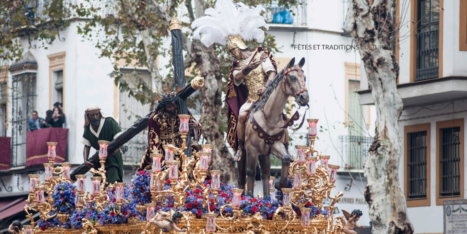
▲ SEMAINE SAINTE DE SÉVILLE