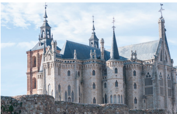
▲ PALAIS ÉPISCOPAL ASTORGA

Ce monument rappelle les châteaux des contes de fées, avec ses créneaux, ses tourelles et même sa douve qui l'entoure. Conçu par l'artiste de génie Gaudí, cet édifice moderniste de facture néogothique accueille aujourd'hui le musée des chemins.