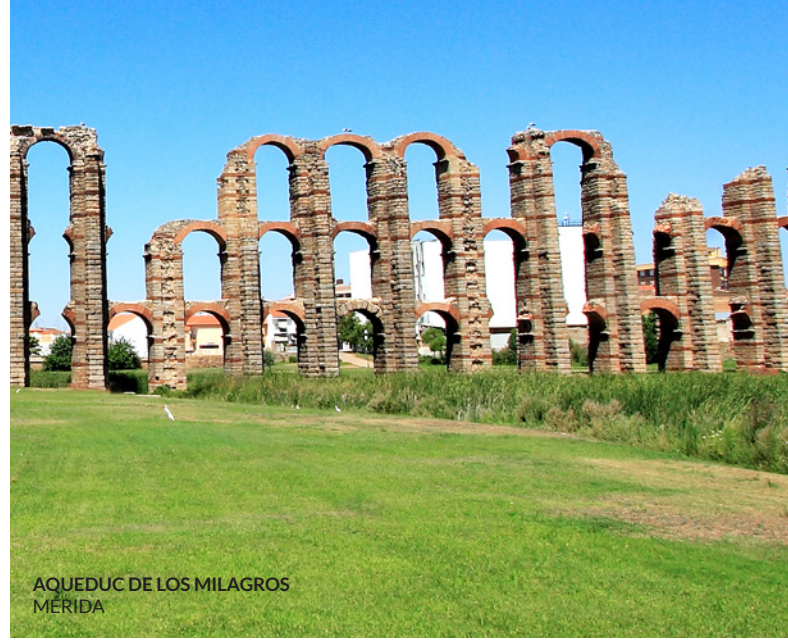
AQUEDUC DE LOS MILAGROS MÉRIDA