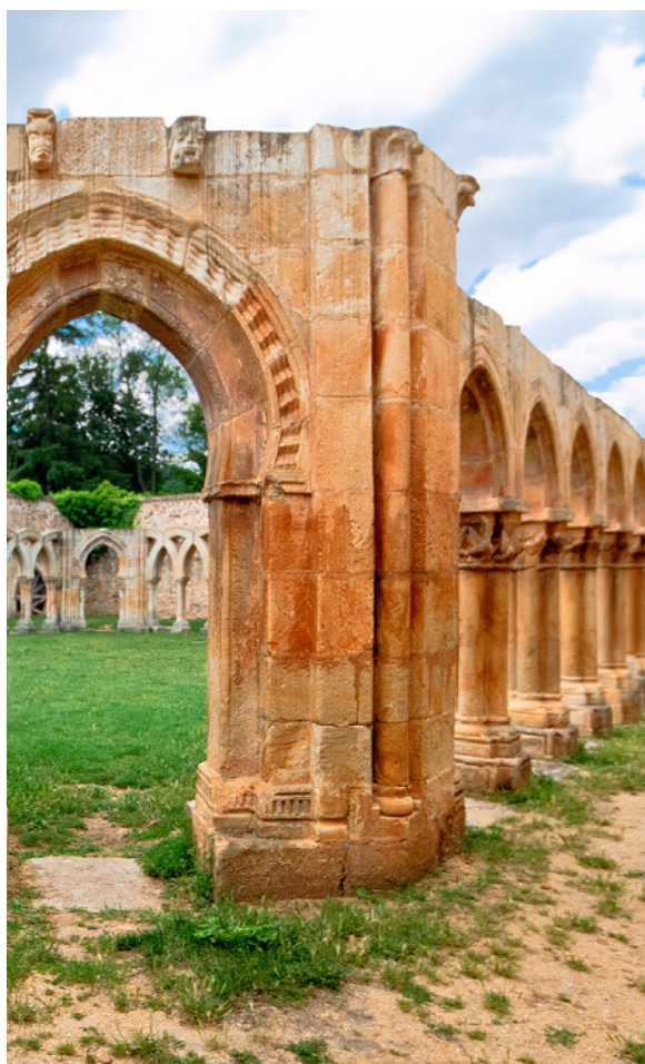
▲ CLOÎTRE SAN JUAN DE DUERO SORIA

Découvrez cet exemple d'architecture chrétienne médiévale. Ses arcatures témoignent des différentes tendances de l'époque : l'art roman, gothique et musulman.