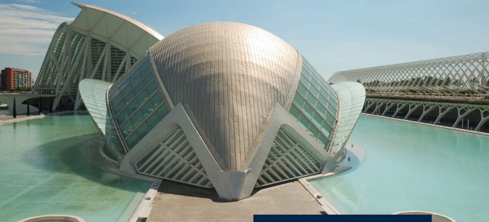
▲ CITÉ DES ARTS ET DES SCIENCES VALENCE