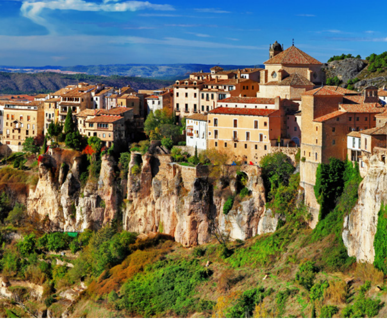
▲ MAISONS SUSPENDUES CUENCA