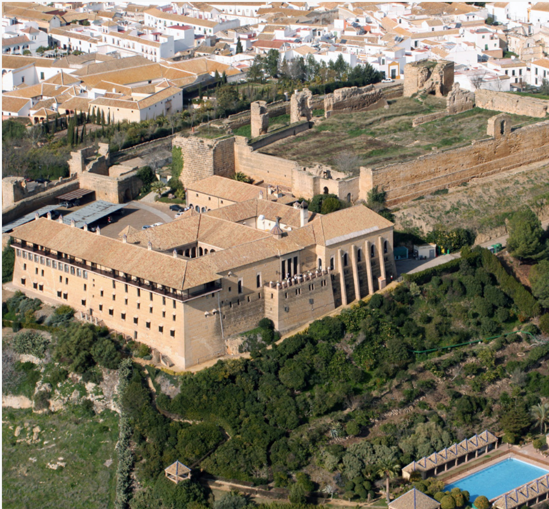
▲ PARADOR DE CARMONA SÉVILLE

À l'heure actuelle, il existe plus de 90 Paradores de Turismo en Espagne . Si vous aimez plonger dans l'histoire, alors n'hésitez pas. Choisissez le vôtre sur www.parador.es .