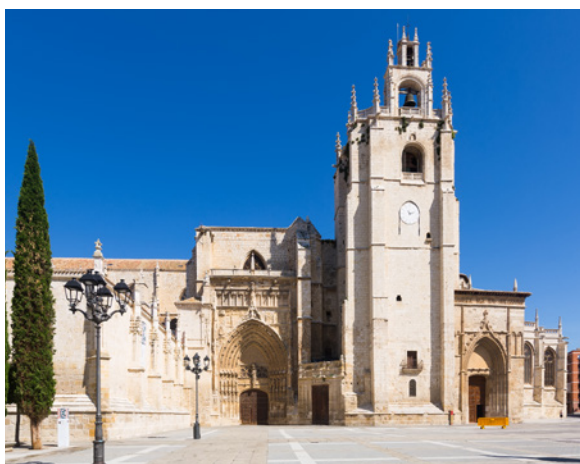
▲ CATHÉDRALE DE PALENCIA

L'Espagne recèle d'innombrables trésors et secrets. Voici 10 bijoux culturels qui n'attendent que vous.