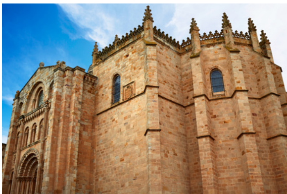
▲ CATHÉDRALE DE ZAMORA