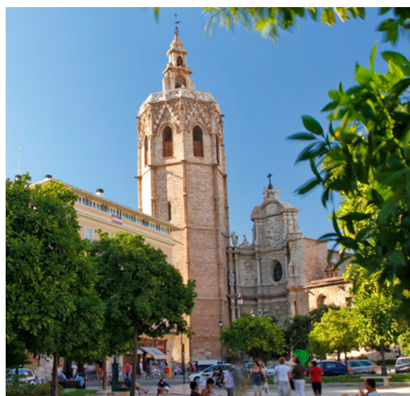
▲ LE MIGUELETE VALENCE

Cette ville pleine de contrastes respire l'essence de la Méditerranée.