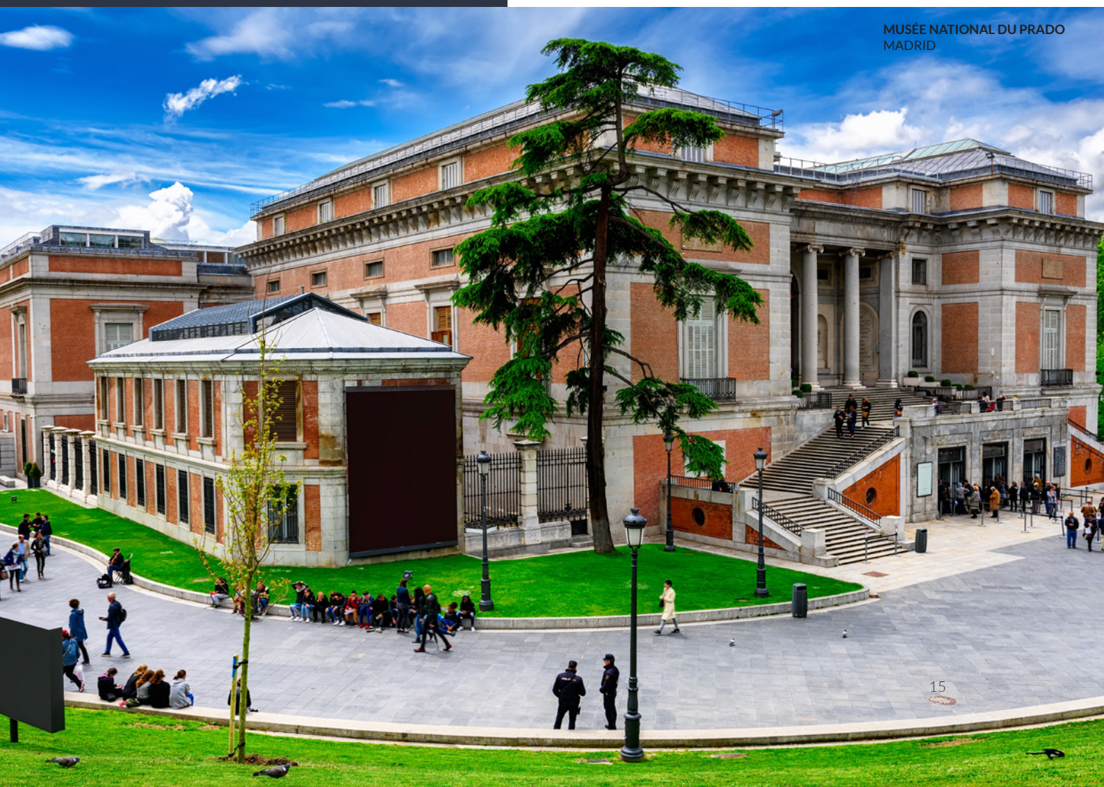
MUSÉE NATIONAL DU PRADO MADRID

Vous pourrez y admirer des trésors tels que les Ménines de Diego Velázquez , le Chevalier à la main sur la poitrine du Greco ou le Jardin des délices de Jérôme Bosch .