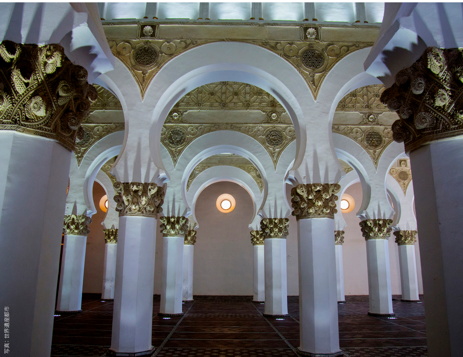
▲ サンタ・マリア・ラ・ブランカユダヤ教会

トレドでもっともすぐれたカトリックの遺産は、ゴシック様式がみごとなサンタ・マリア・デ・トレド大聖堂でしょう。正面ファサードに注目しましょう。それぞれ、地獄の扉、免罪の扉、裁きの扉と呼ばれるものです。大聖堂の内部には、サンティシモ・コルプス・クリスティ（キリストの聖体祭）の伝統的な宗教行列の主役を担う宝物であるアルファの聖体顕示台が保管されています。