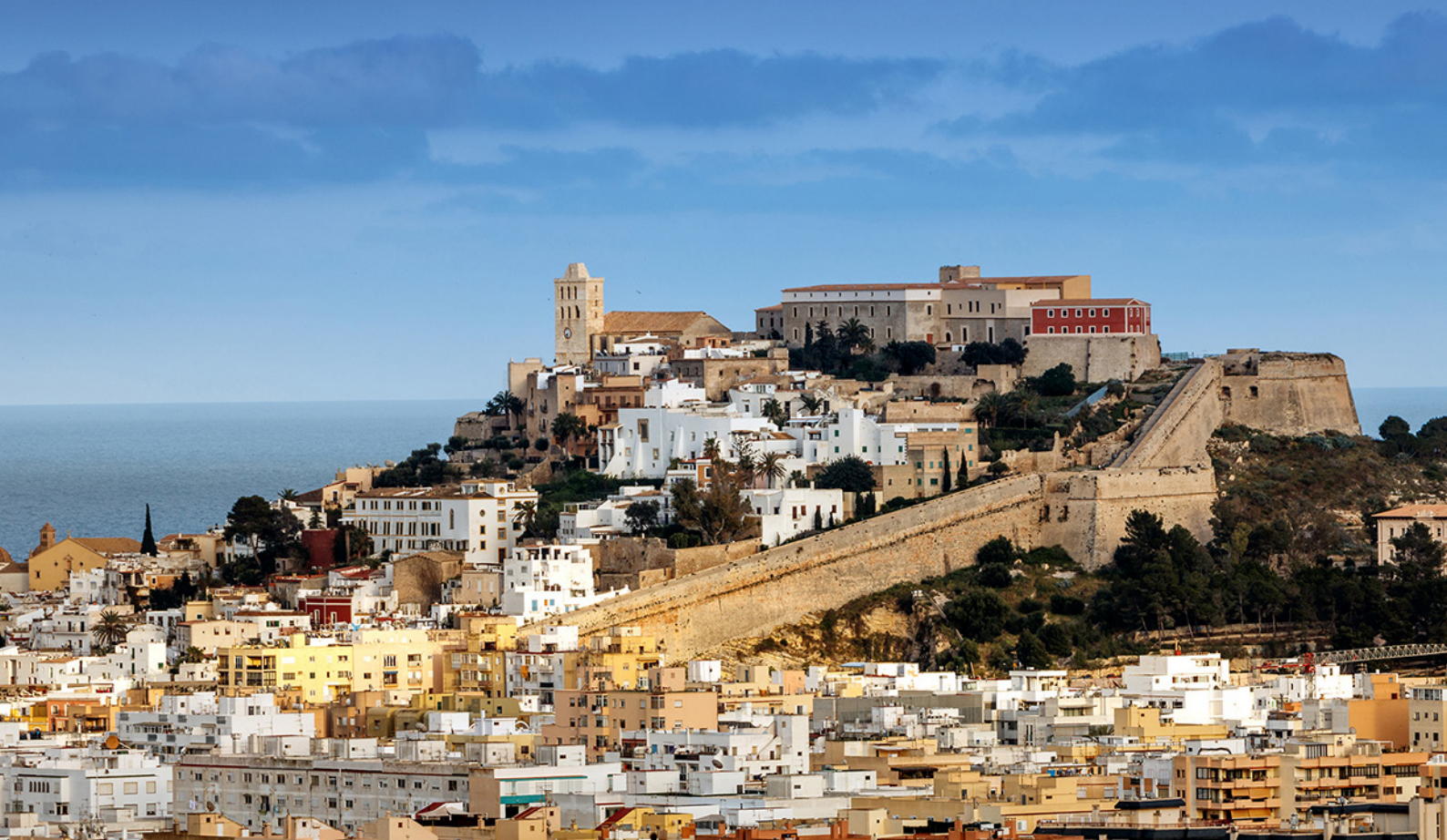
▲ エイビッサーイビサ島 バレアレス諸島

それぞれの世界遺産都市で、芸術や建築の至宝を鑑賞していただき、郷土料理を楽しみ、スペインの歴史や慣習を身近に感じていただけられることでしょう。さあ、世界遺産を訪ねる旅に出てみませんか？