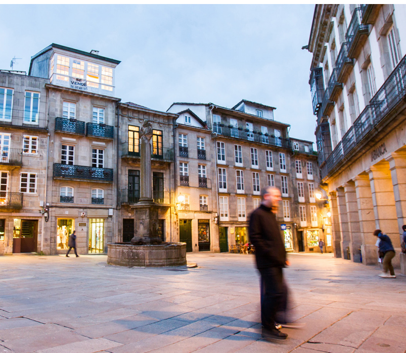
▲ セルバンテス広場

午後には、ポボ・ガレゴ博物館へ足を運びましょう。ガリシアの民族誌を、この地域の考古学的発見を切り口にした充実のセクションが見どころです。その近くにはガリシア現代美術センターがあります。その充実のコレクションはもちろん、ポルトガル人の建築家アルバロ・シザが設計した建物も一見の価値があります。