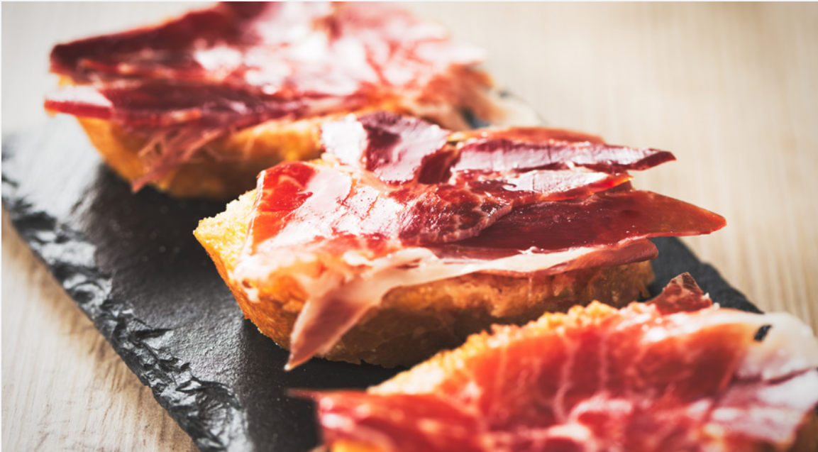
▲ イベリコ豚生ハム

地中海式ダイエットの重要な食材に豆類があります。インゲン豆ならアビラ産、レンズ豆ならサラマンカ県のアルムニャが有名です。またひよこ豆は、イベリア半島のほぼ全域で、伝統的な料理に使われています。アルカラ・デ・エナーレスへ行ったら、ぜひ有名なコシード・マドリレーニョ(マドリード風煮込み)をおためしてください。バエサの煮込み料理、インゲン豆とひよこ豆の煮込みもおすすめです。