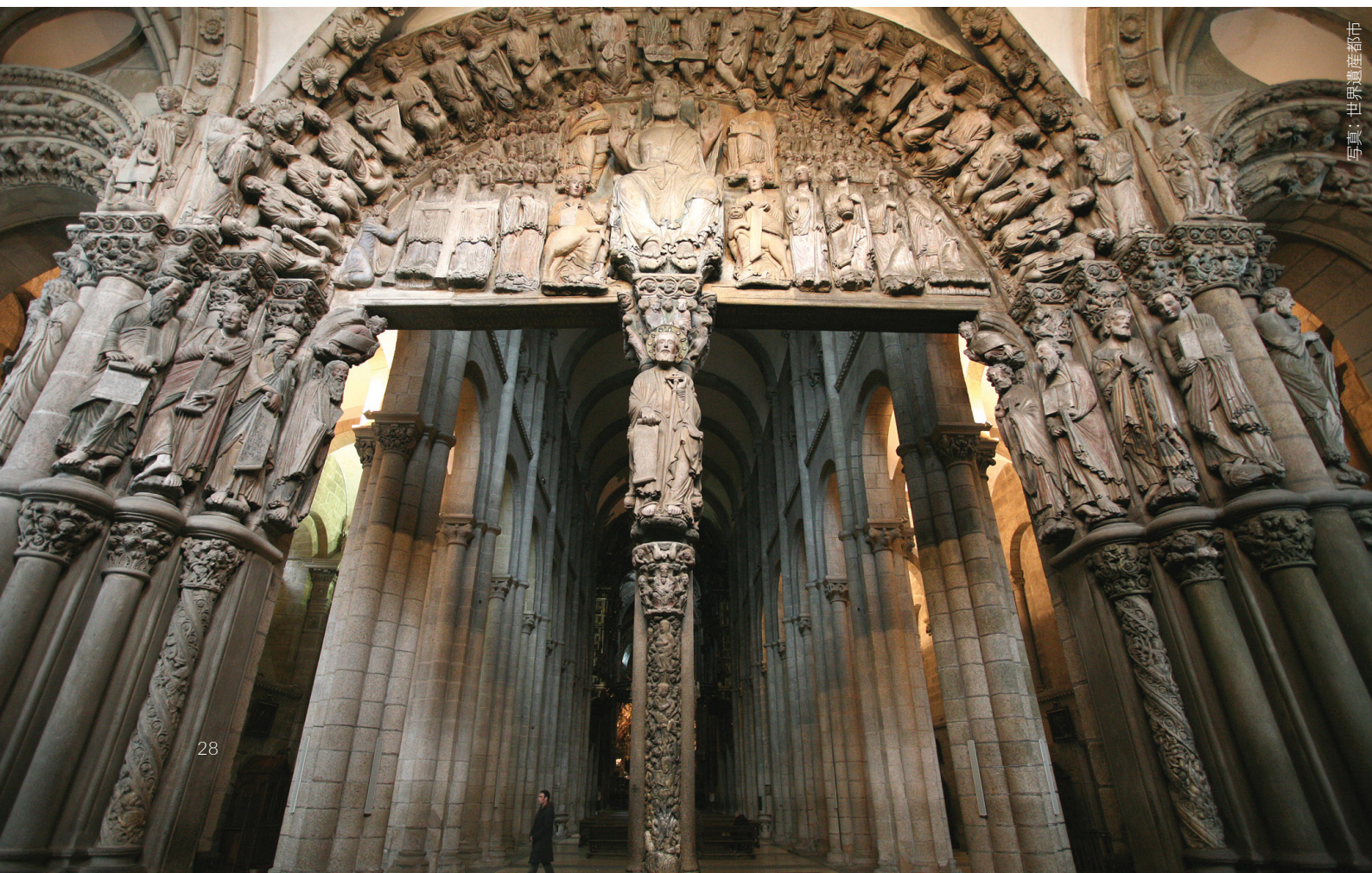
写真：世界遺産都市