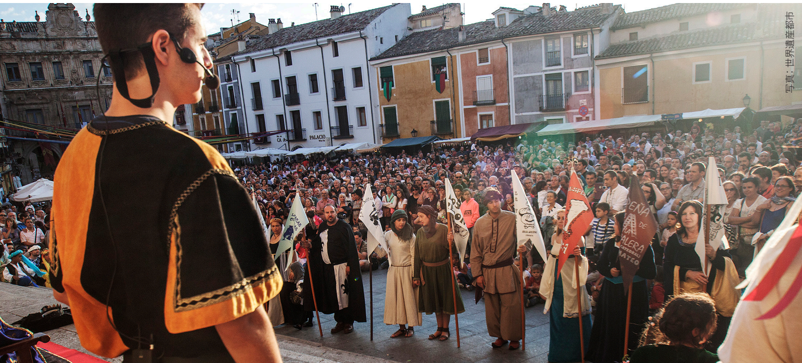
写真：世界遺産都市