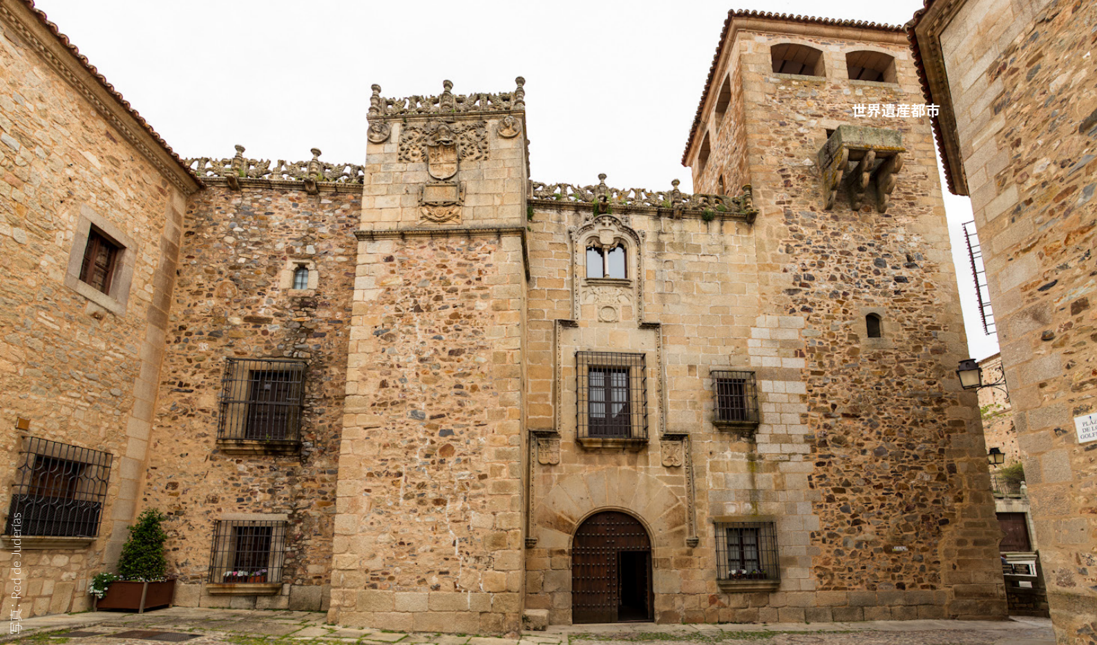
▲ ロス・ゴルフィネス・デ・アバホ宮殿

宮殿に囲まれたサンタ・マリア広場には、15世紀に建てられたゴシック様式のサンタ・マリア大聖堂があります。この聖堂にあるプラテレスコ様式の美しい祭壇画はぜひご覧ください。広場の周りには、市内で最も大きいマヨラルゴ宮殿やカルバハル宮殿などがあります。建物の角にバルコニーを設置する独特の様式にご注目ください。樹齢400年を超えるイチジクの木がある魅力的な中庭もお見逃しなく。