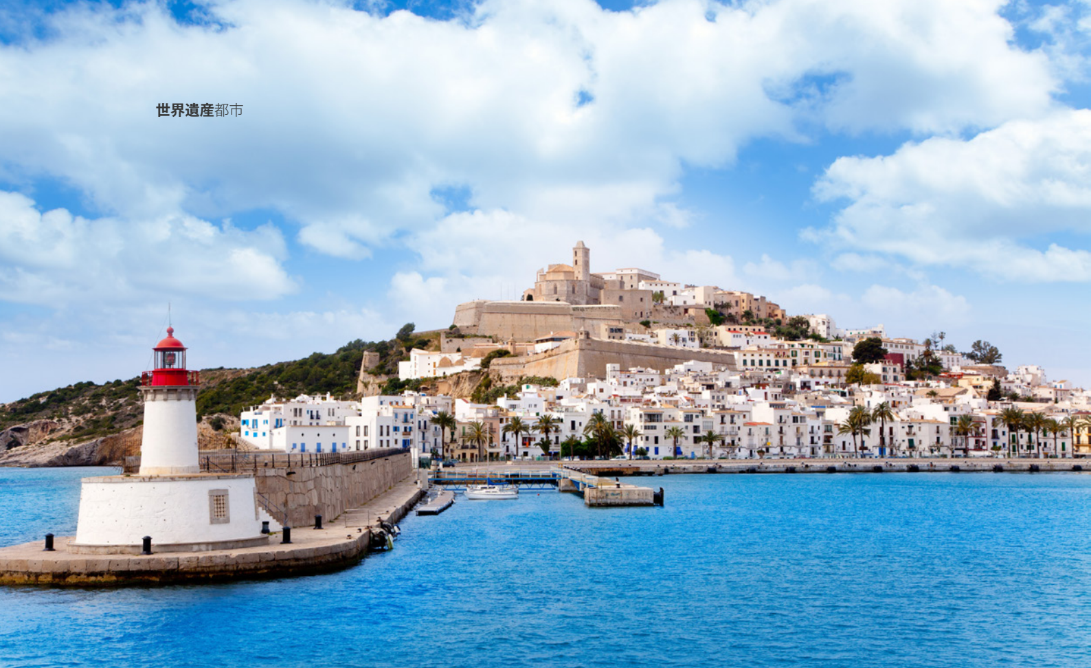
▲ エイビッサーイビサ島

見逃せないのは、モノグラフミュージアムとプッチ・デス・モリンスのポエニ人の巨大墓地です。3,500の墓が発見されたこの巨大なフェニキア人・ポエニ人墓地は、世界でも保存状態の良い墓地のひとつとされます。考古学上重要な遺跡として、セス・パイセス・デ・カラドートやサ・カレタがあります。