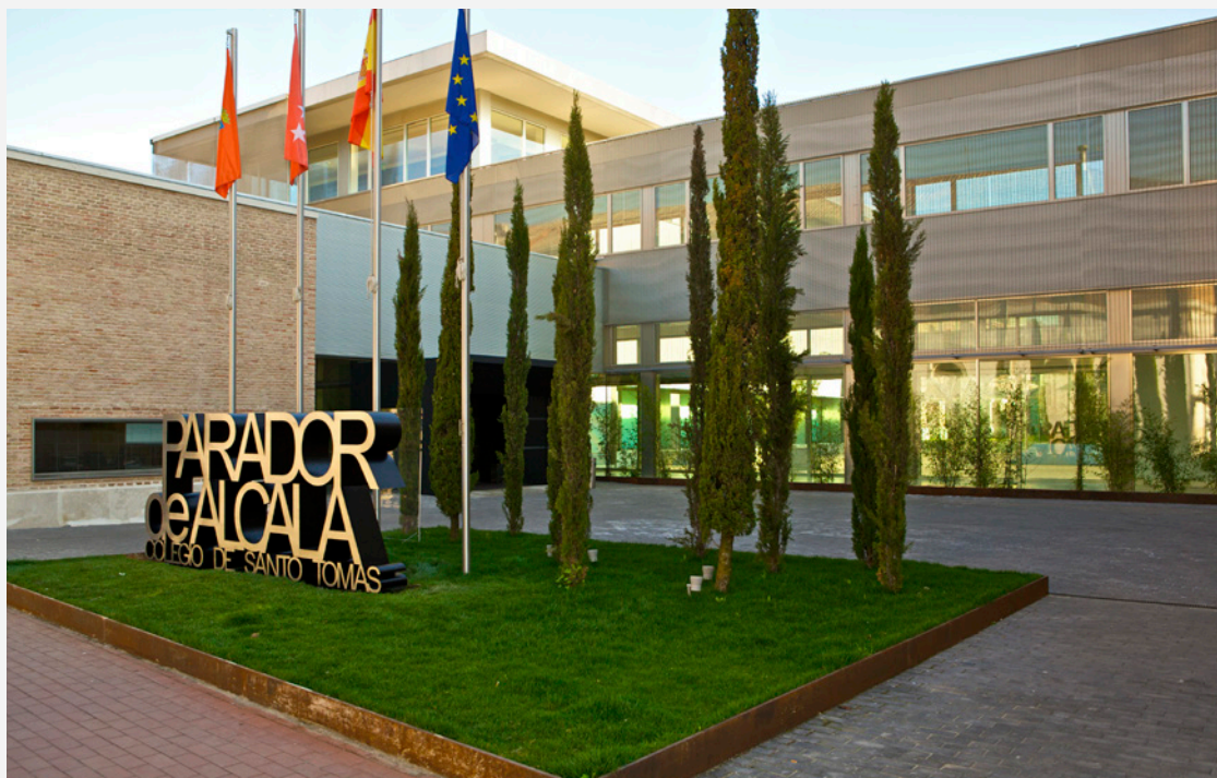
▼ アルカラ・デ・エナーレスのパラドール

アビラのパラドールは旧ピエドラス・アルバス宮殿です。中世の街アビラのシンボルでもある、ヨーロッパでも最も保存状態のよい城壁に隣接しています。広々とした客室でゆっくりおくつろぎいただけます。居心地のよい落ち着けるインテリアが特徴です。レストランでは、ガラス張りの中庭から庭園と城壁の景色をお楽しみいただけます。