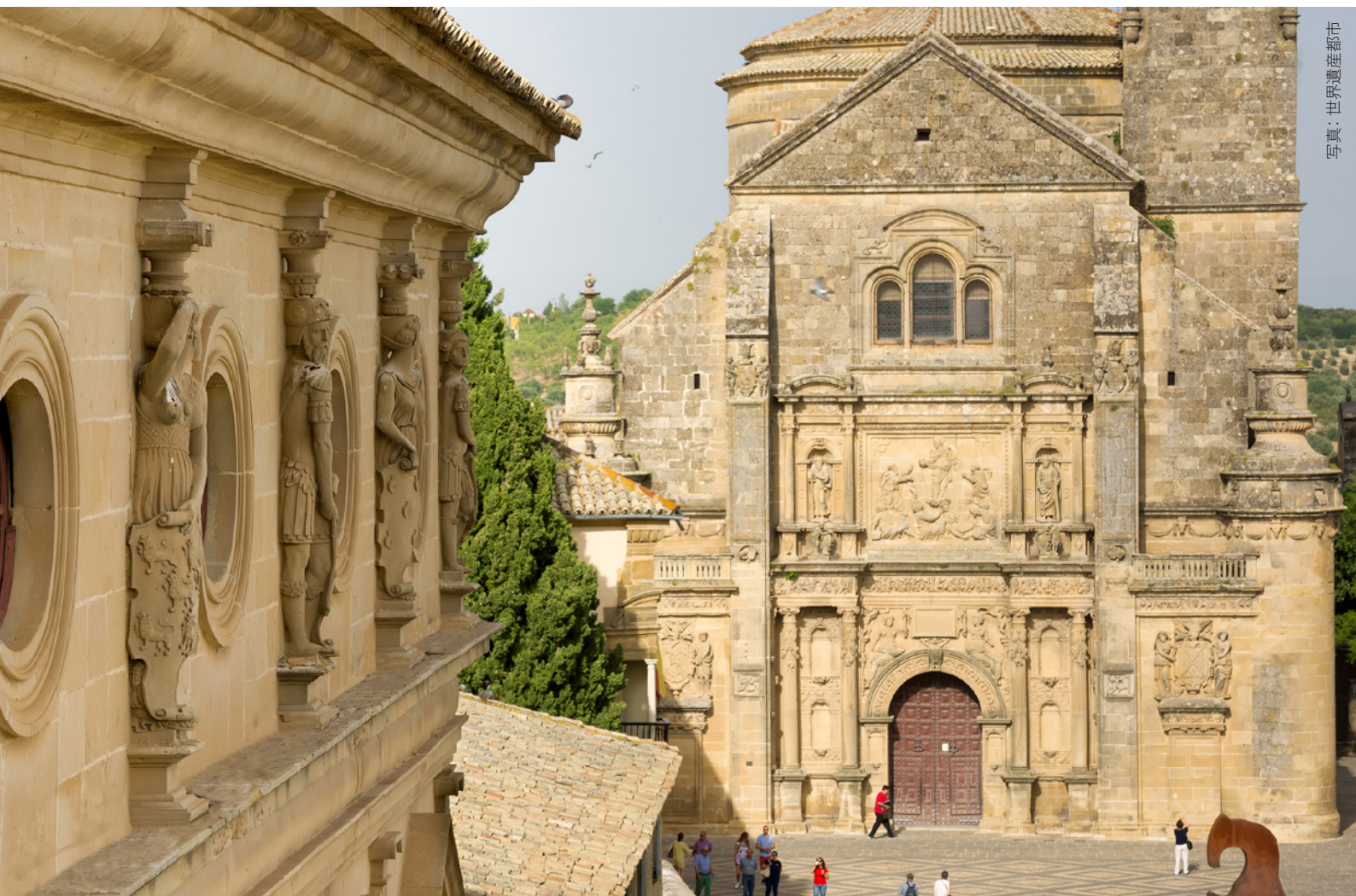
▲ バスケス・デ・モリーナ広場

街には、アラビア様式、ゴシック様式、バロック様式が完璧に調和した建築作品が数多く残されています。グラナダ門と旧市街を囲む城壁は、イスラム教徒の残した遺跡です。何世紀もの間閉ざされてきた神秘的な水のシナゴグには、きっと目を奪われることでしょう。街に残されたさまざまな文化の融合について知るには、14世紀のムデハル建築による考古学博物館がおすすめです。