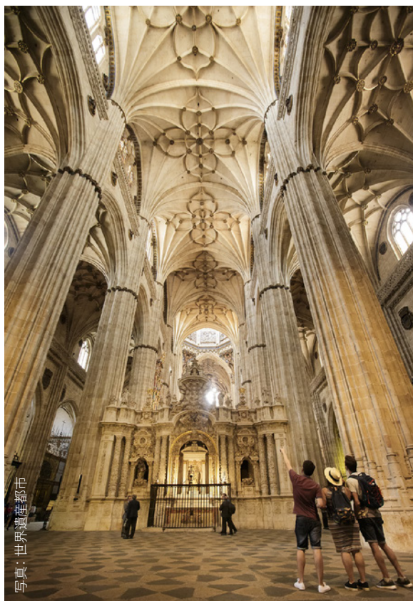
▼ サラマンカの大聖堂

サラマンカでも、どのような障がいを持つ方にも対応したツアーをご用意しています。マヨール広場の観光オフィスを出発し、コリージョ広場へ続くアーチから広場を抜けましょう。歩行者専用道路ルア・マヨールを進むと、カルデナル・プラ通りとデニエル通りに出ます。左には大聖堂の入り口があり、右にはサラマンカ大学のバリアフリー入り