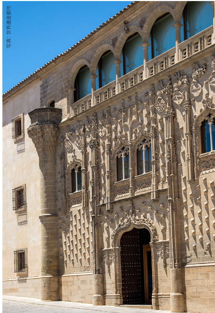
写真：世界遺産都市

少し歩けば美しい庭園のあるコンステイトゥション広場です。地元の人々が散歩したり、待ち合わせ場所として利用したりする憩いの場で、昔の職人たちのギルドがあったアーケードに隣接しています。代表的なモニュメントとしては、アルオンディガやバルコン・デル・コンセホ、星の噴水などが挙げられます。