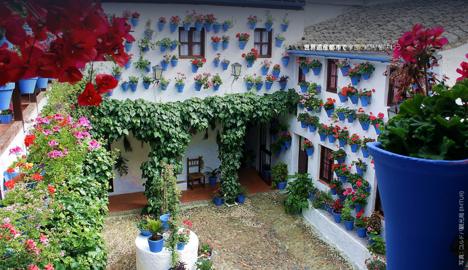
世界遺産都市で季節の祭りを味わう