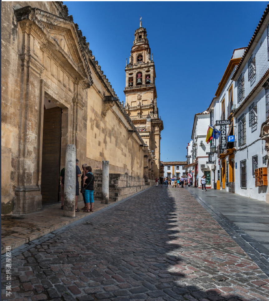
写真：世界遺産都市

メスキータ見学を終えたら、白い石灰が印象的な家が立ち並ぶユダヤ人街の、石畳が続く路地を散策するのはいかがでしょうか？コルドバラしさを味わうことができる風景です。アンダルシア地方に現存する唯一の中世のシナゴグを訪ねることもできます。この辺りでは、コルドバでも最古のパティオを目にすることができるでしょう。毎年5月初旬には、世界無形文化遺産であるパティオ祭りが開催されます。