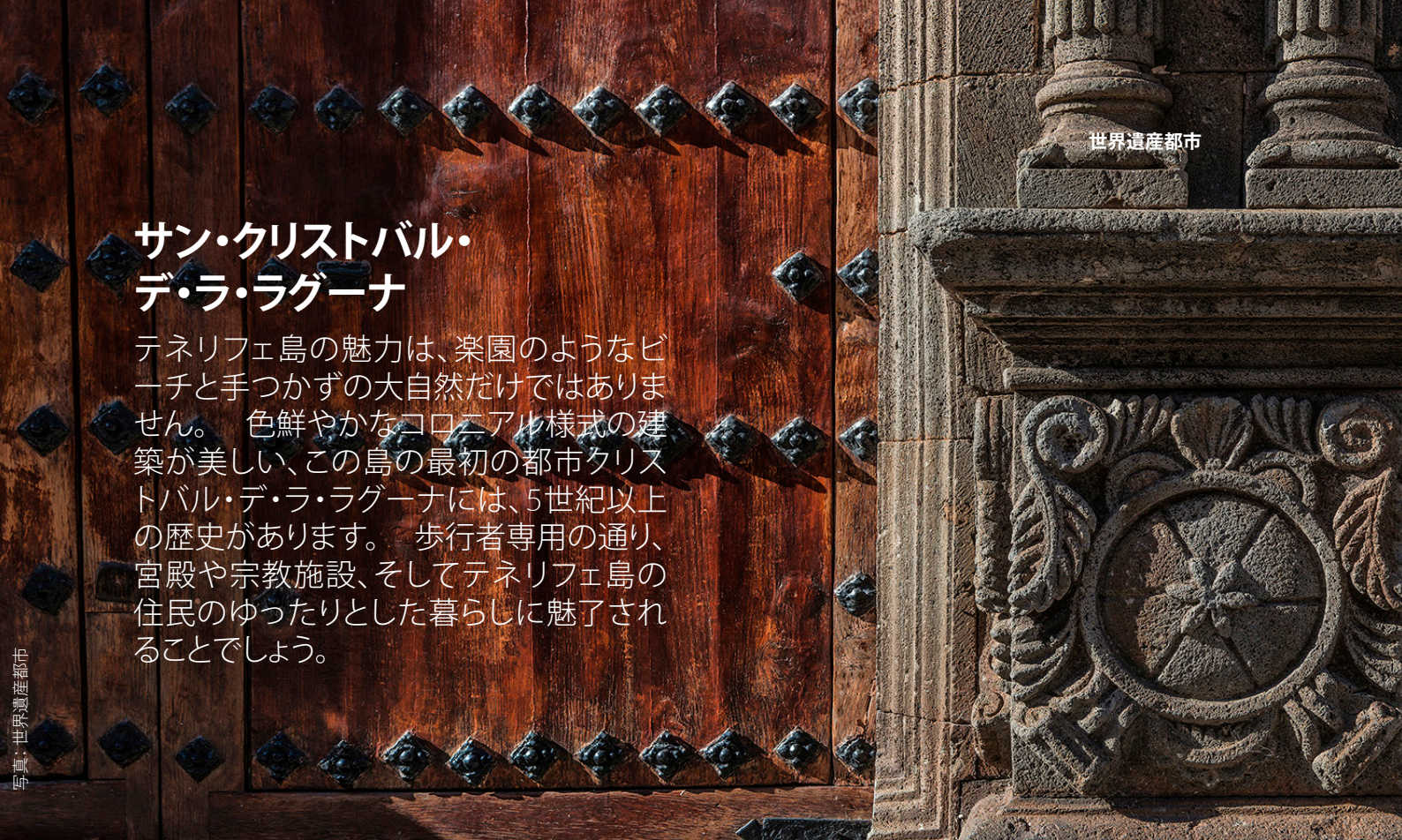
▲ サン・クリストバル・デ・ラ・ラグーナ

海洋航法機器を使って設計された、碁盤のような街並みをご覧ください。街の中心部にある優雅な通りを散策していると、カナリア諸島最古の大学として200年の歴史を誇るラ・ラグーナ大学の活気あふれる学生と行き交うことでしょう。