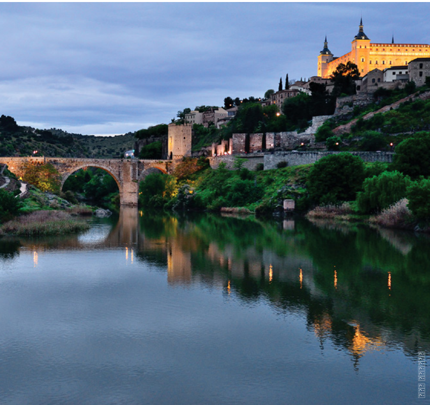
▲ アルカントラ橋とアルカサル