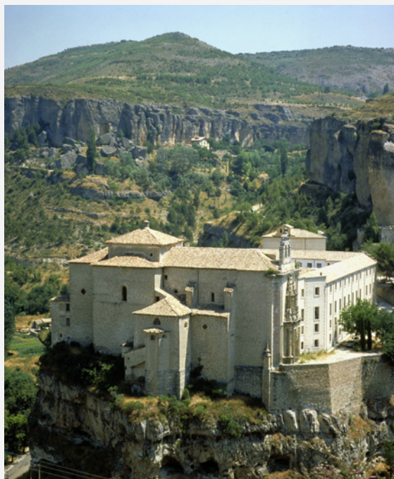
▲ クエンカのパラドール

かつて修道院だったこのパラドールは、ウエカル川が形成する峡谷を見渡すことができる場所にあり、有名な宙づりの家を見ることもできます。かつてのガラス張りの回廊と礼拝堂は、現在は居心地のよいカフェテリアとなっています。またプールもあり、スーペリアルームからはクエンカの街の素晴らしいパノラマを楽しめます。