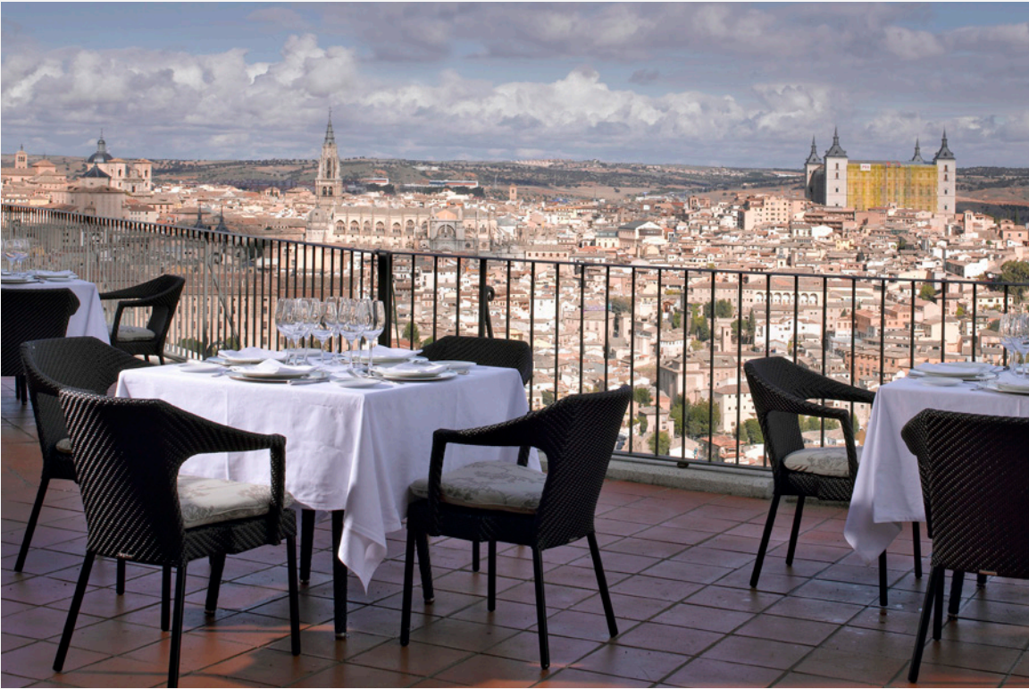
▲ トレドのパラドール