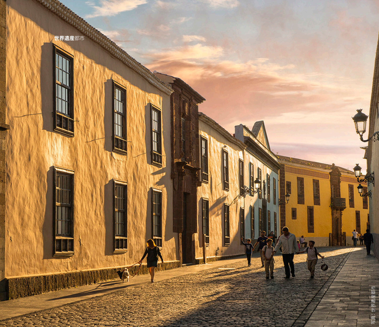
写真：世界遺産都市