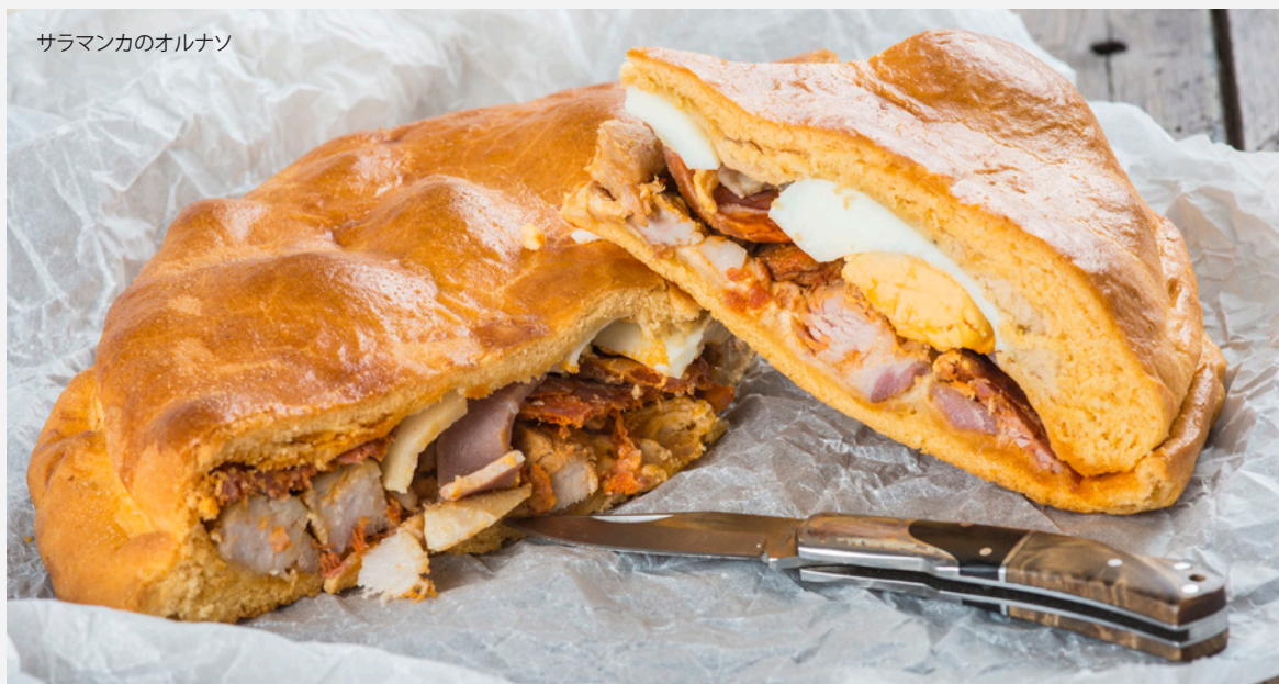
サラマンカのオルナソ

サン・クリストバル・デ・ラ・ラゲーナでは、カナリア諸島特産のバナナやさまざまなトロピカルフルーツをお見逃しなく。