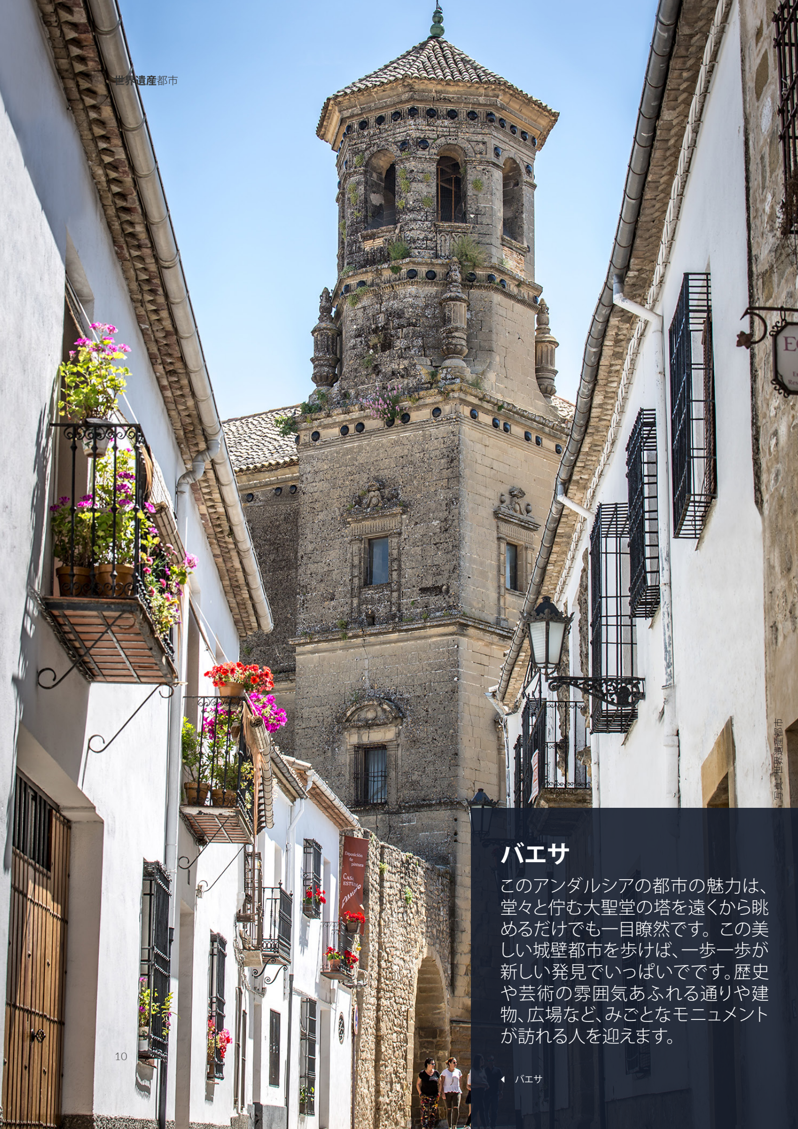
写真: 世界遺産都市