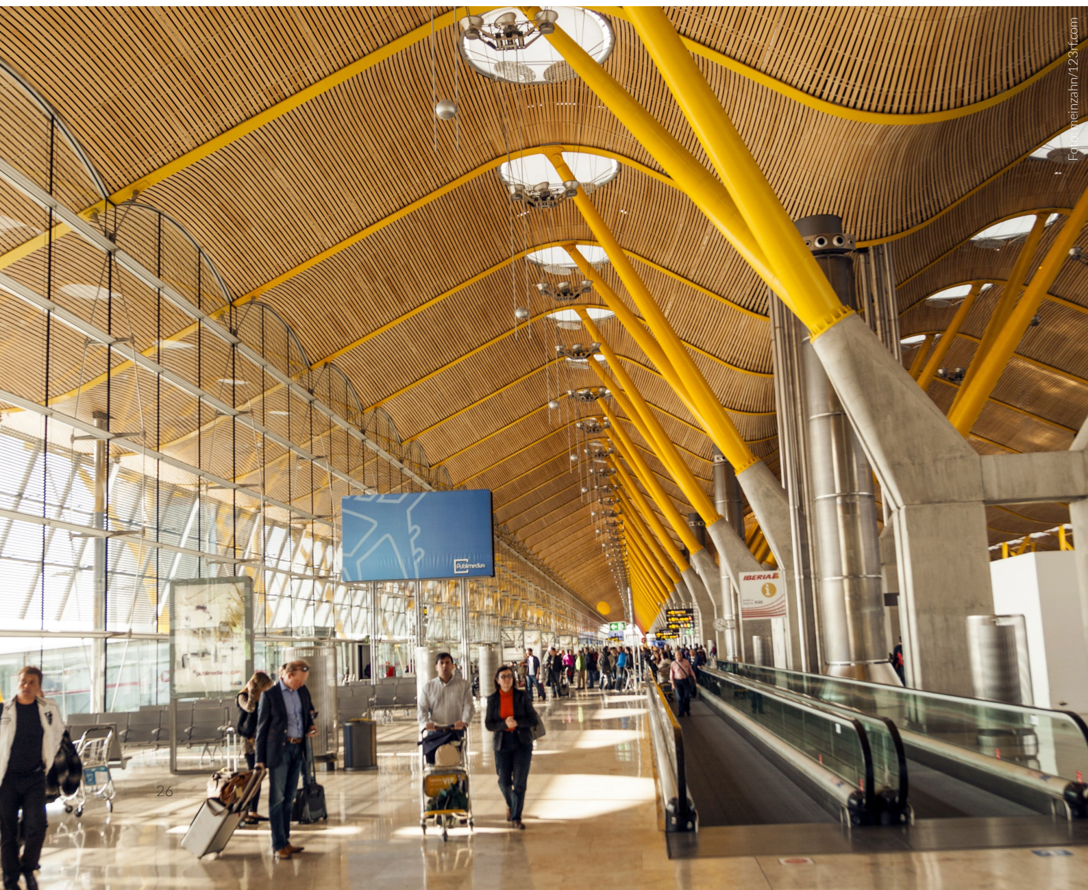
▼ TERMINAL 4 DEL AEROPUERTO DE MADRID-BARAJAS ADOLFO SUÁREZ MADRID

“Una celebración del viaje que captura la vida del ciudadano”, según Rogers, que puso en práctica su experiencia con la arquitectura bioclimática para su diseño vanguardista. Para potenciar la orientación del viajero, los pilares de la zona de embarque van cambiando de color, aportando una riqueza cromática que te sorprenderá.