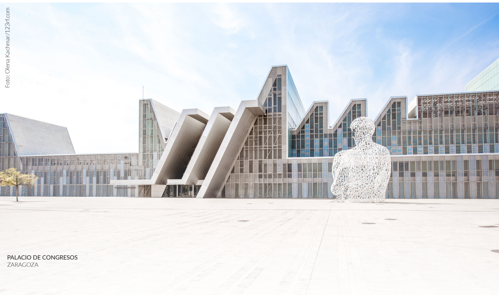
PALACIO DE CONGRESOS ZARAGOZA