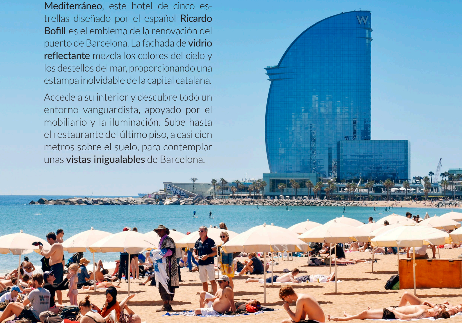
▲ W HOTEL BARCELONA

Accede a su interior y descubre todo un entorno vanguardista, apoyado por el mobiliario y la iluminación. Sube hasta el restaurante del último piso, a casi cien metros sobre el suelo, para contemplar unas vistas inigualables de Barcelona.