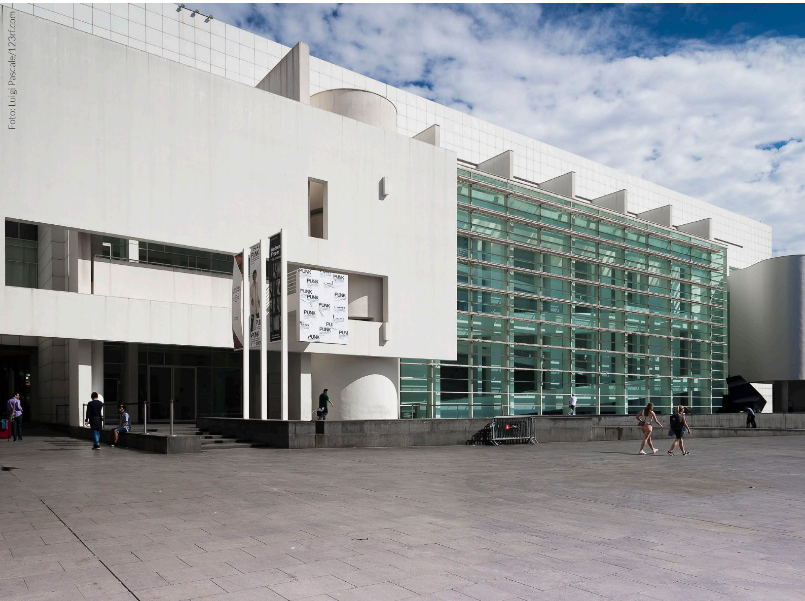
▲ MACBA BARCELONA