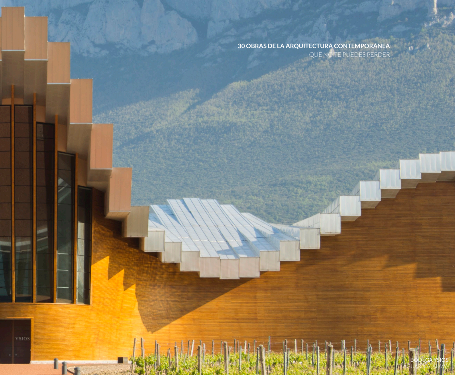
BODEGA YSIOS LAGUARDIA, ALAVA

La propuesta es una reinterpretación contemporánea de las construcciones tradicionales relacionadas con el vino. La base del edificio tiene bodegas excavadas en el terreno , conectadas con las que se encuentran desde tiempo inmemorial bajo la ladera del cerro sobre el que descansa el castillo de Peñafiel.