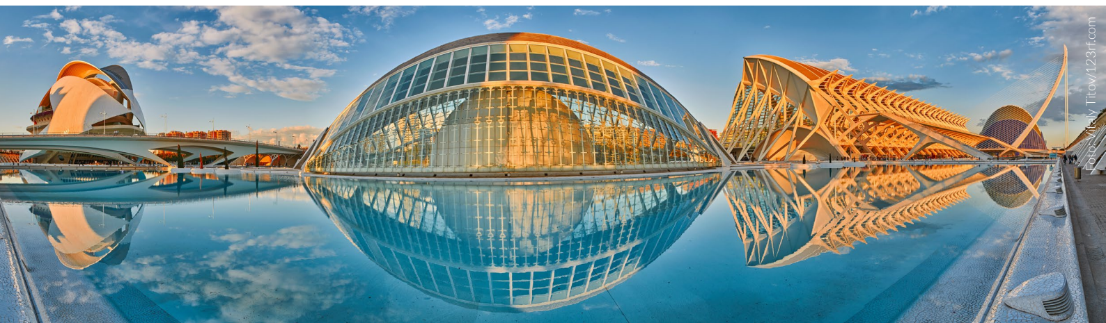
▲ CIUDAD DE LAS ARTES Y LAS CIENCIAS VALENCIA