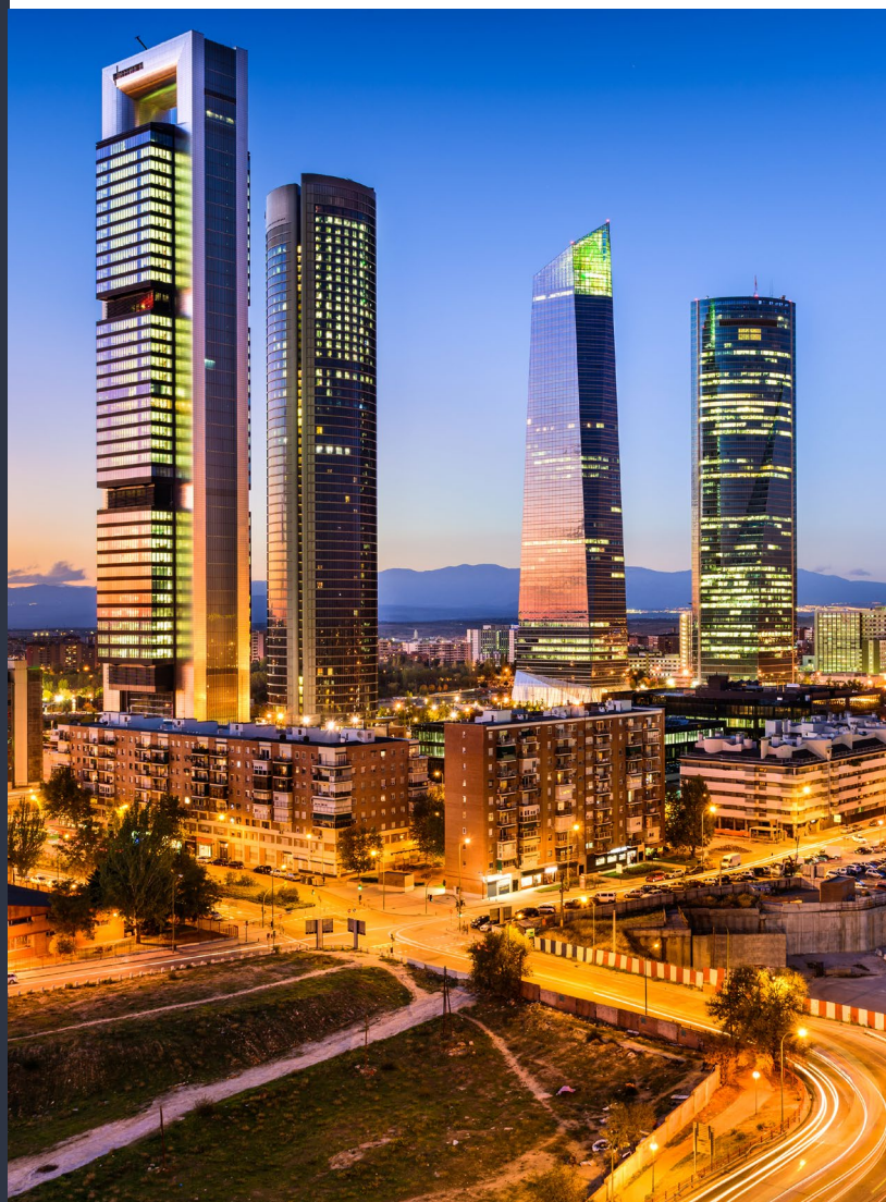
▲ COMPLEJO DE LAS CUATRO TORRES MADRID

Siente el vértigo de la Torre de Cristal , el edificio más alto de España, con 249 metros de altura . Fue construida por César Pelli , el mismo arquitecto que diseñó las célebres Torres Petronas de Kuala Lumpur, en colaboración con el estudio madrileño Ortiz León Arquitectos . Su fachada en forma de crystal tallado y el jardín vertical de su cúpula la hacen brillar como uno de los edificios más impactantes de la arquitectura madrileña.