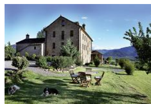
Casa de San Martín

E-mail: lisa@rusticae.es /Tel. +34 91 859 64 75