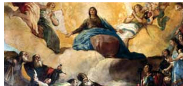
Aragona, Saragozza, affresco nella Basilica del Pilar