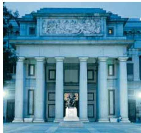
Madrid, Museo del Prado