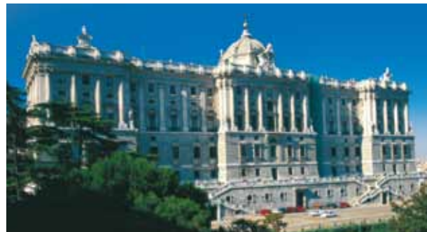
Madrid, Palazzo Reale