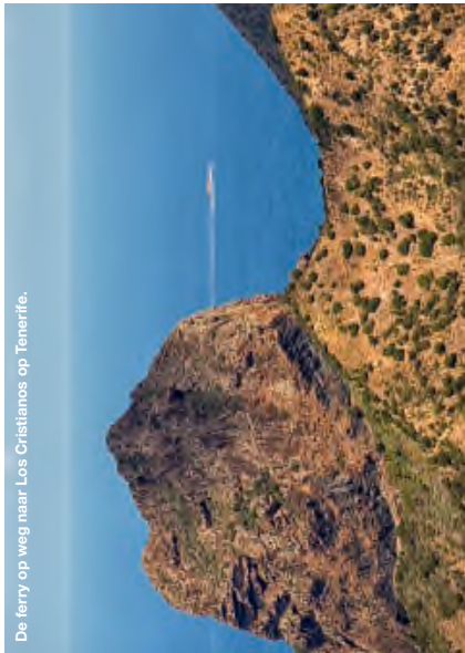
De ferry op weg naar Los Cristianos op Tenerife.

Transavia vliegt van Amsterdam, 3 x per week rechtstreeks op Tenerife v.a. € 150 retour. Ryanair vliegt van Eindhoven v.a. € 165 retour. Van vliegveld Tenerife Zuid gaat er een shuttlebus naar ferryhaven Los Cristianos (20 minuten). In circa 1 uur vaart de ferry ( www.navierairmas.com ) of www.fredolsen.es , v.a. € 68 pp (retour) naar La Gomera.