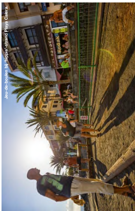
Jou-de-boulen bij hippie-strand Playa Cañera.

Onze wandeling is deel van een 8-daagse SNP Wandelreis. Overnachting in hotels/pensions incl. ontbijt, (bagage)vervoer, route en kaart. Excl. vluchten. Zie www.snp.nl/reis/ spantje/la_gomera en de lezerstaf hiernaast.