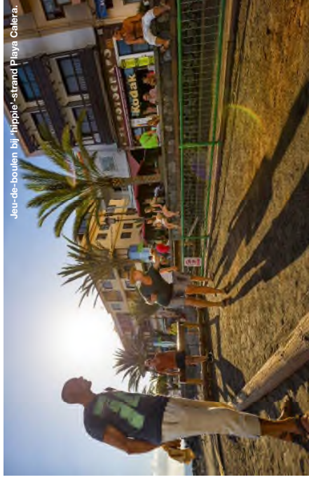
Jou-de-boulen bij hippie-strand Playa Cañera.