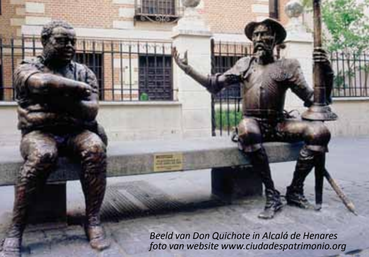
Beeld van Don Quichote in Alcalá de Henares

En als zij hier in de zomer zijn dan genieten zij o.a. van de “Veranos en Salamanca” (29 juni-2 september), met allerlei evenementen op het gebied van theater, muziek (kamerconcerten), jazz, flamenco en film.