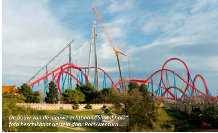
De bouw van de nieuwe achtbaan “Shambhala”

De toeristen komen natuurlijk in de eerste plaats voor de schitterende monumenten, zoals de oude en de nieuwe kathedraal; de universiteit, gebouwd in gotische stijl tussen 1415 en 1433 in opdracht van de tegenpaus Papa Luna en de Romeinse brug, die nog dateert uit de tijd van Trajanus.