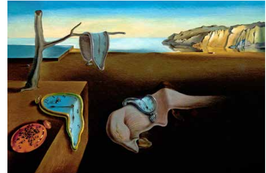
'De volharding der herinnering'; een werk van Salvador Dalí uit 1931.