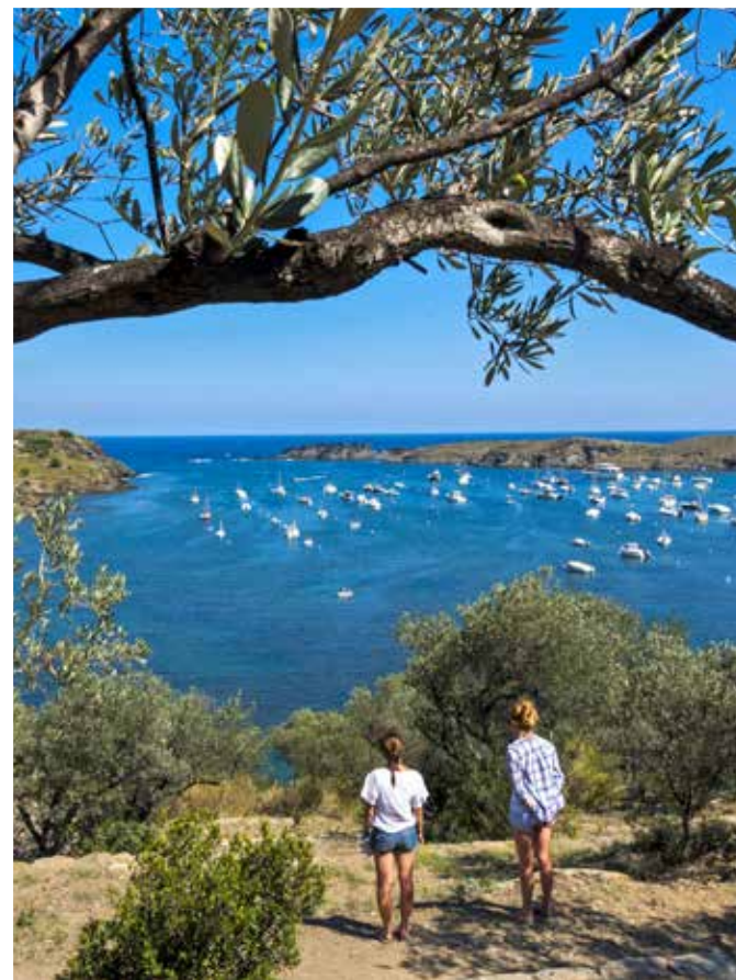
LUCAS VALERIO/ALAMY (BEBE); BEN FOSTROCK/ALAMY (BEBE); JALONER/MADEIRA/ALAMY (UTZICH); BENHARD/DRISCHER/GETTY IMAGES (KWAU)