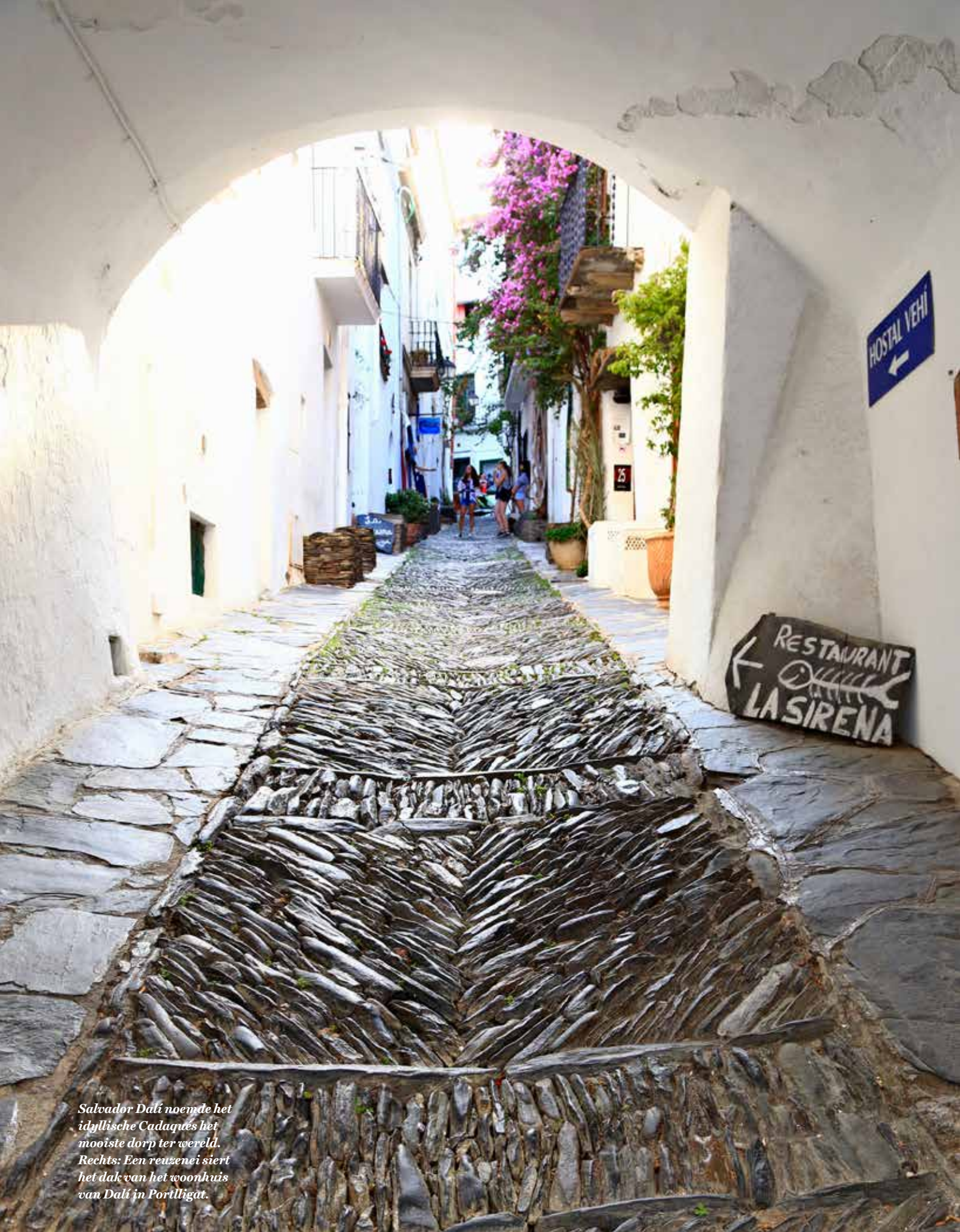
Salvador Dalí noemde het idyllische Cadaqués het mooiste dorp ter wereld. Rechts: Een reuzenei siert het dak van het woonhuis van Dalí in Portlligat.