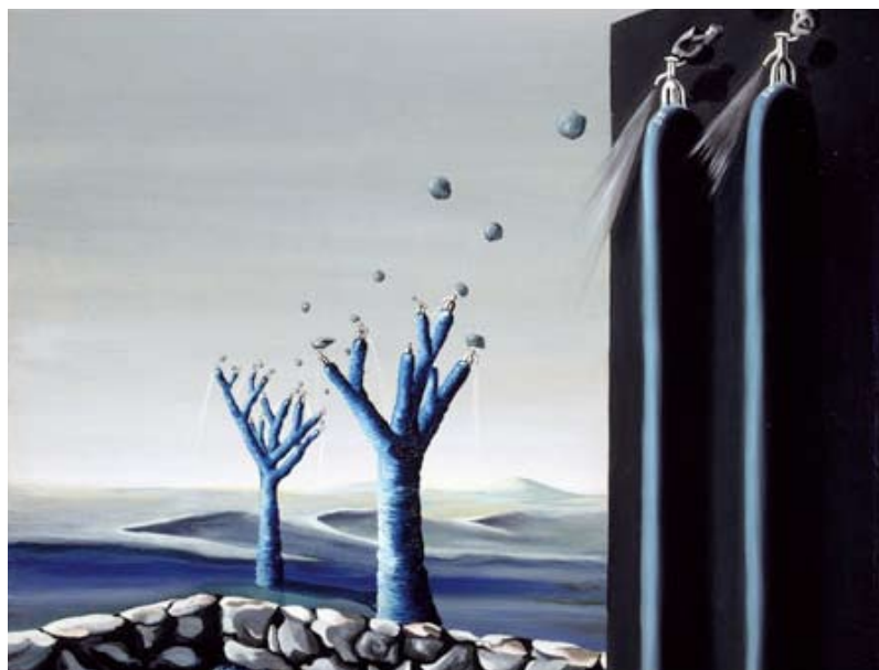
► Oscar Domínguez

de l'œuvre du plus grand artiste canarien. Du 31 oct. au 6 sept. 2009.