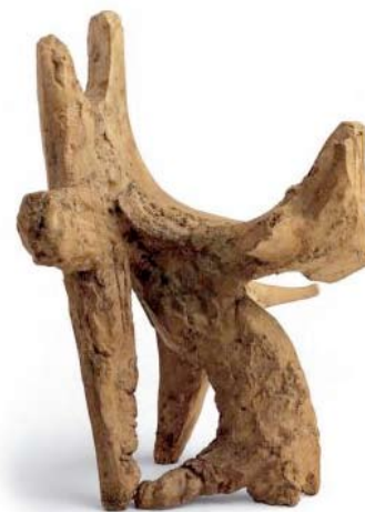
► Julio González versus Pablo Picasso

de contempler les nombreux points en commun entre ces artistes. Jusqu'au 26 avril.