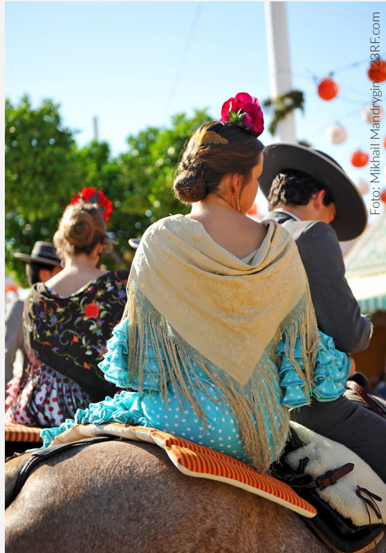
▲ FERIA DE ABRIL SEVILLA

Этот период в Испании — это великолепие, набожность и тайна. Прочувствуйте всей душой Страстную неделю . Полюбуйтесь богато украшенными религиозными изображениями, переносимыми по улицам вручную под торжественную музыку. Вы услышите песни в стиле фламенко под названием саэтак, которые люди поют а капелла в знак благоговения. Одно из самых ожидаемых мероприятий — это Ла-Мадруга, ночь между Великим четвергом и Страстной пятницей, когда проходят одни из самых известных процессий.