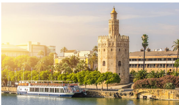
▲ ЗОЛОТАЯ БАШНЯ