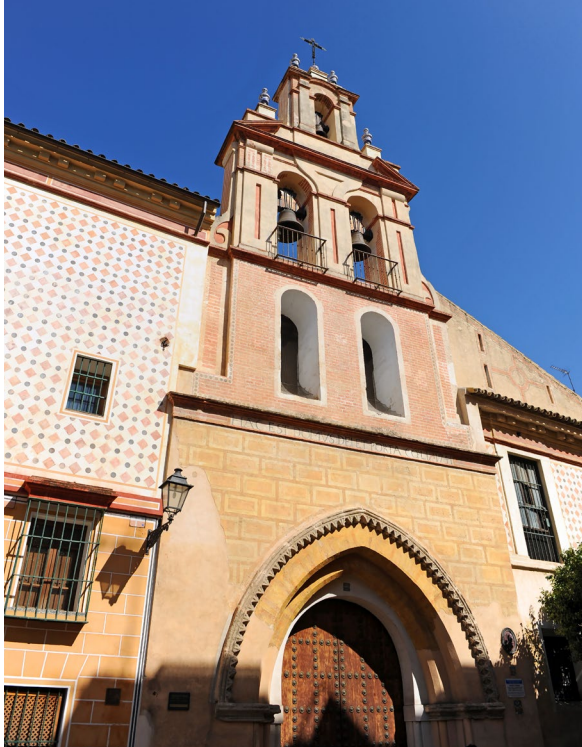
▲ ЦЕРКОВЬ САНТА-МАРИЯ ЛА БЛАНКА СЕВИЛЬЯ