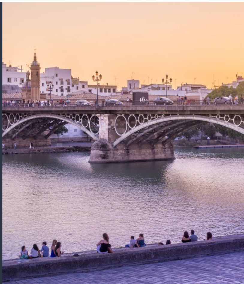
▲ МОСТ ИЗАБЕЛЛЫ II

В Триане вы также встретите такие шедевры архитектуры, как переулок Инквизиции , где все еще сохраняются остатки старинного замка святого Георгия. В базилике Патросинио (базилика Покровительства) вы сможете увидеть образ Эль Качорро («Детеныш») — это эмблематическая фигура Страстной недели в Севилье.