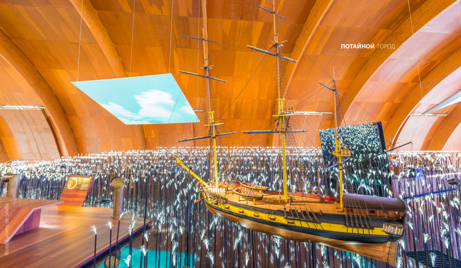
▲ ПАВИЛЬОН МОРЕПЛАВАНИЯ