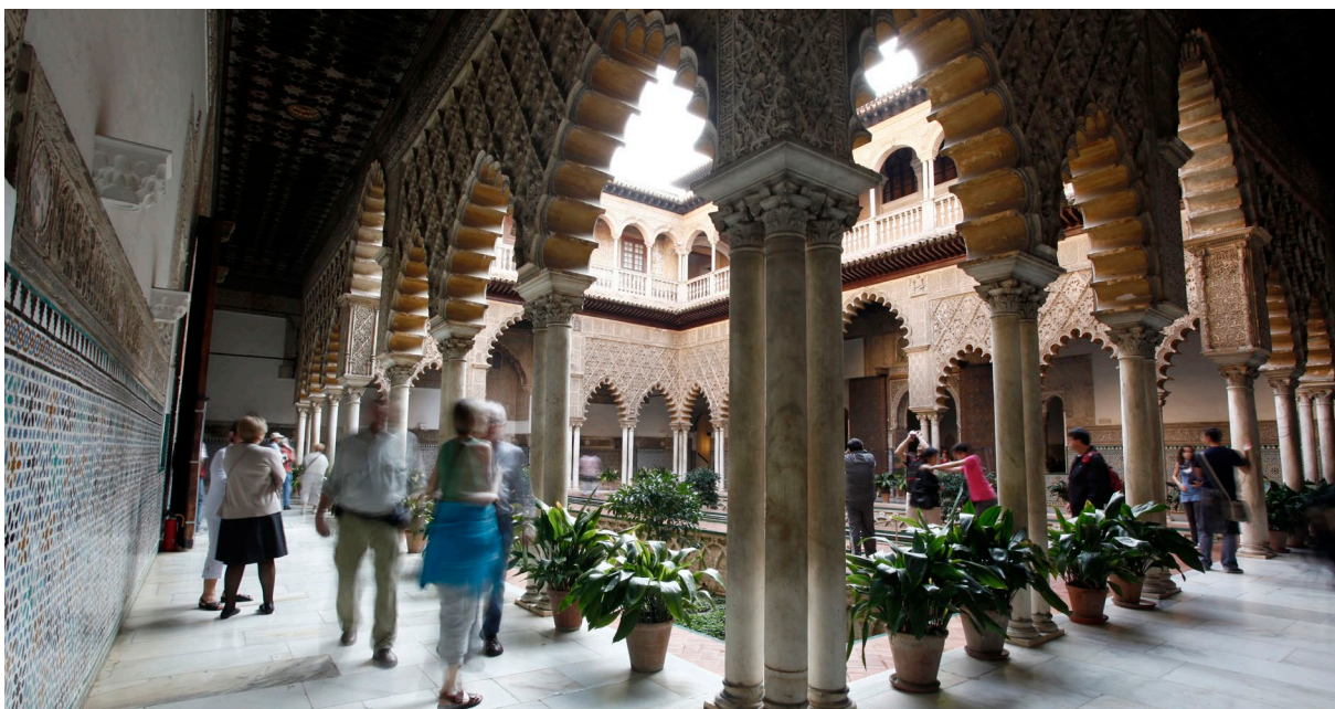
▲ КОРОЛЕВСКИЙ ДВОРЕЦ-КРЕПОСТЬ АЛЬКАСАР

Севиля примечательна своими невероятно интересными кварталами. Такими, как район Санта-Крус , в самом центре, со своими улочками, дворцами и утопающими в цветах двориками; Триана , на другом берегу реки Гуадалquivир с морским шармом и искусством фламенко; и Ла-Макарена , наполненный традициями и историей.