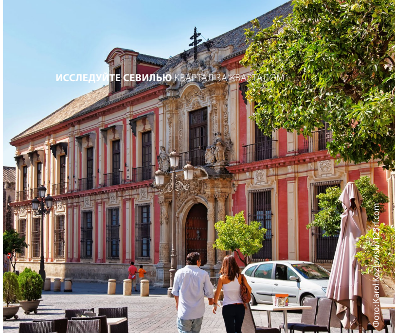
▲ АРХИЕПИСКОПСКИЙ ДВОРЕЦ

Во время вашей экскурсии по центру нельзя также обойти вниманием улицу Сьерпес . Это кипящая жизнью пешеходная улица, чрезвычайно популярная среди жителей Севильи, с множеством магазинов, баров и ресторанов. Следуя вдоль