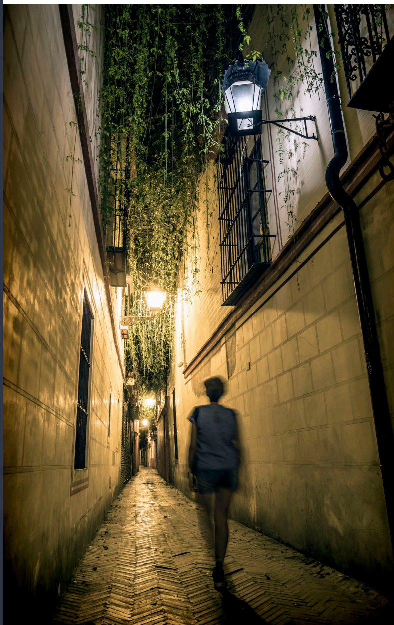
▲ КВАРТАЛ САНТА-КРУС

Дворец Мигель де Маньяра — это еще одно монументально строение, которое служило резиденцией аристократов с 1623 года. Церковь Санта-Мария да Бланка , выстроенная на месте старинной синагоги XIII века, сохраняет свою оригинальную структуру, хотя была реставрирована дважды: сначала в XIV веке, а затем в XVII веке, превратившись в один из лучших образцов севильской архитектуры барокко.