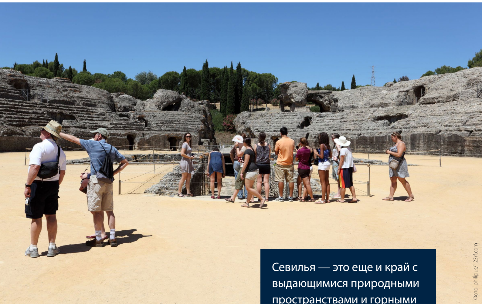
▲ АРХЕОЛОГИЧЕСКИЙ КОМПЛЕКС ИТАЛИКА САНТИПОНСЕ

Севиля — это еще и край с выдающимися природными пространствами и горными маршрутами для пеших прогулок.