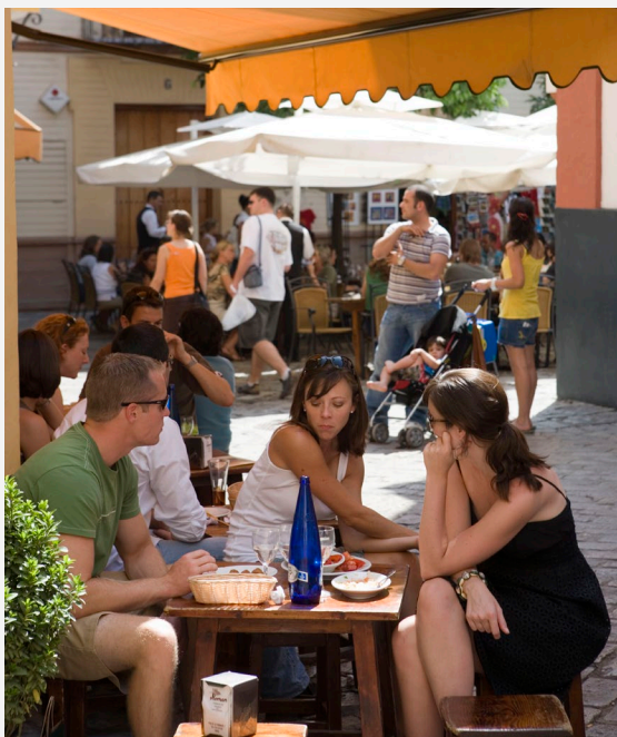
▲ КВАРТАЛ САНТА-КРУС

Не имеет значения, какую пору года вы выберете для того, чтобы посетить Севилью. Здесь вам всегда будет чем заняться: отправиться в поход по тапас-барам, побывать на представлении фламенко, поплавать по реке Гуадалькивир или испытать колдовское очарование Страстной недели.