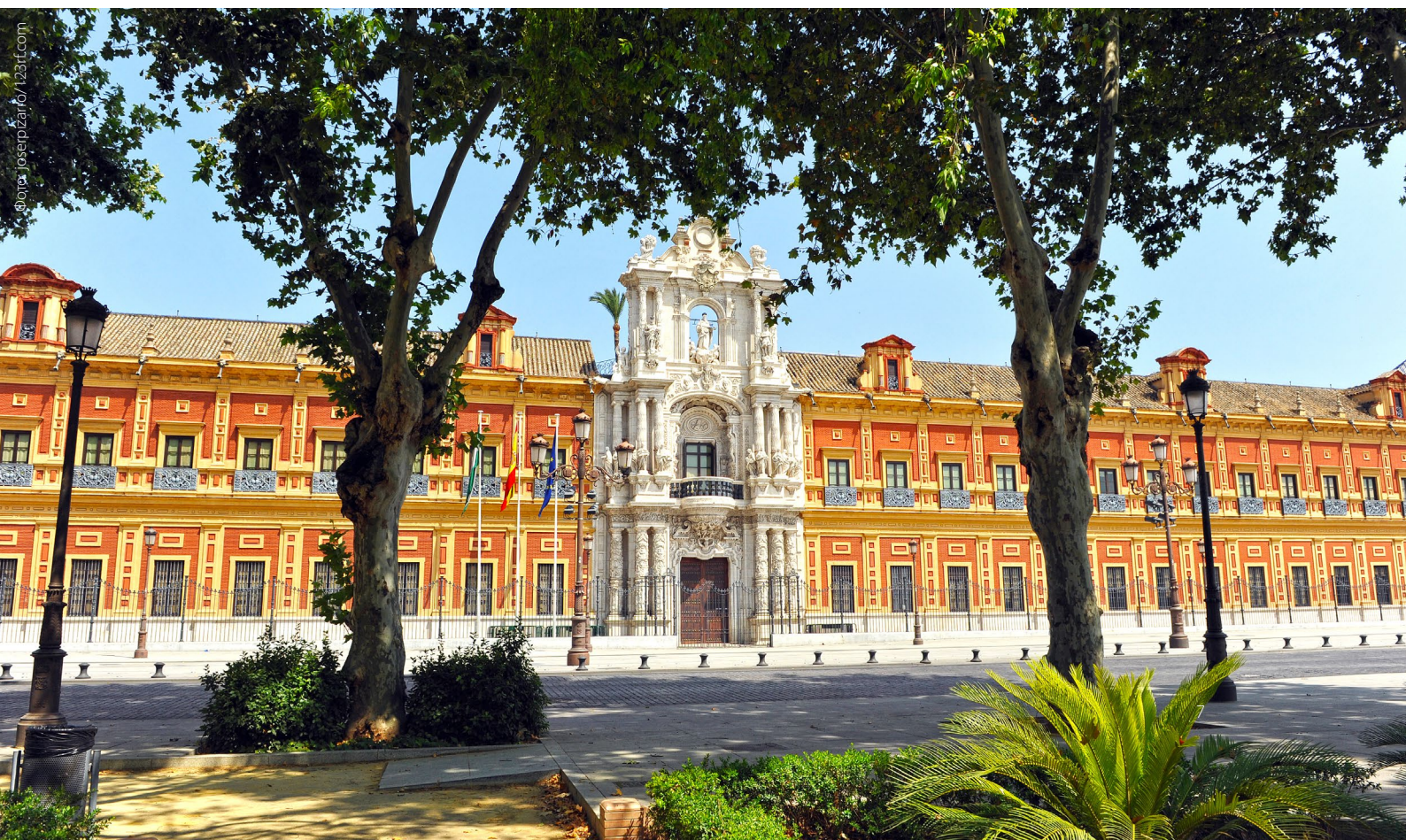
▼ ДВОРЕЦ САН-ТЕЛМО

Прогуляйтесь не спеша по району Аламеда-де-Эркулес — это примечательное место в Севилье, которое предлагает потрясающее сочетание исторических мест, культурных предложений и ночной жизни. Здесь имеется множество баров с живой музыкой и заведений, посвященных электронной музыке.