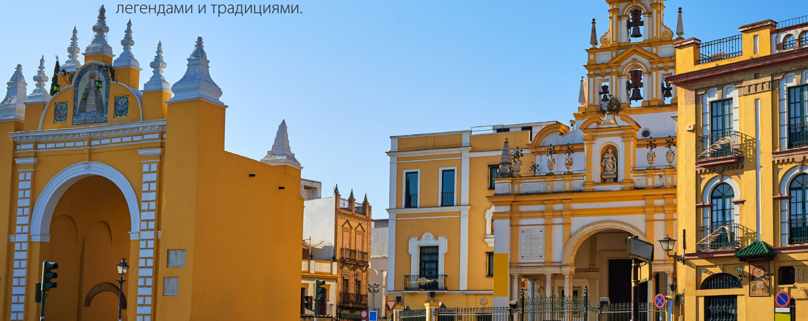
▲ АРКА И БАЗИЛИКА ЛА-МАКАРЕНА

Расположенный на севере исторического района, Ла-Макарена — это один из самых колоритных кварталов Севильи. Этот район больше похож на деревушку внутри города со своими памятниками, легендами и традициями.