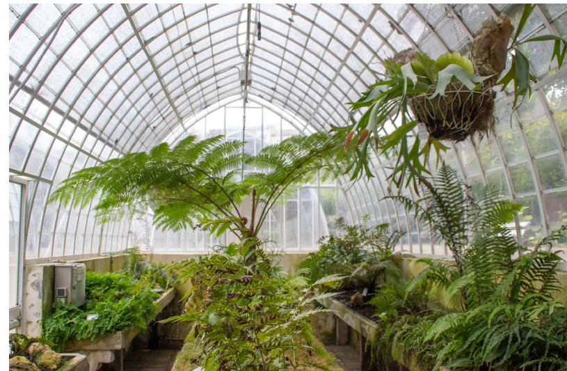
▲ JARDIM BOTÁNICO