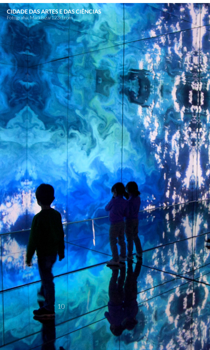
CIDADE DAS ARTES E DAS CIÊNCIAS