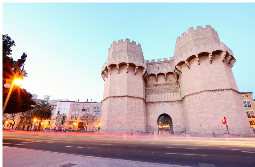
▲ TORRES DE SERRANO