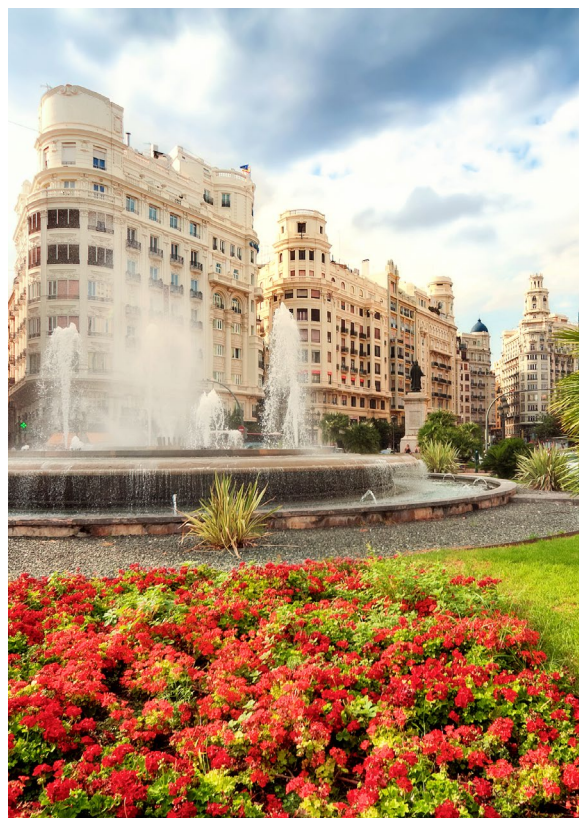
▲ PRAÇA DA CÂMARA MUNICIPAL

Se gosta de artesanato, vá ao mercado da Praça Redonda , no bairro de El Mercat , e compre umas lembranças.