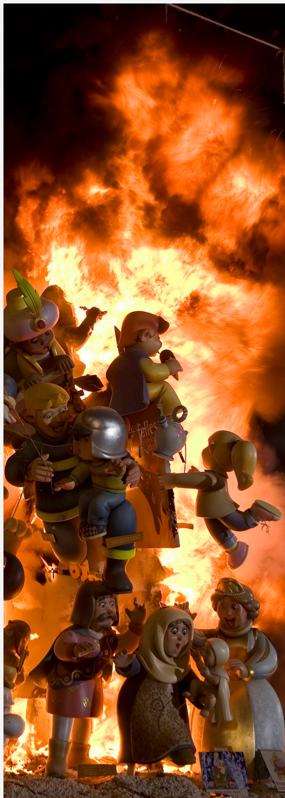
▲ AS FALLAS

Quer descobrir o folclore Valenciano? Assista à tradicional dansà que se celebra na véspera do segundo domingo de maio na festividade da Virgem dos Desamparados , a padroeira de Valência.