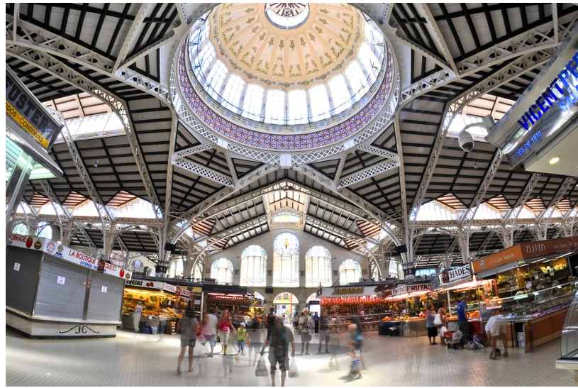
▲ MERCADO CENTRAL

Desfrute de uma das joias de Valência: o bairro de El Cabanyal . Vai adorar passear pelas suas casas de fachadas coloridas e cobertas de azulejos e visitar o seu mercado de produtos frescos.