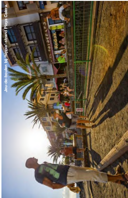
Jou-de-boulen bij hippie-strand Playa Cañera.