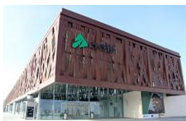
クエンカ Fernando Zóbel 駅

去年12月に竣工したクエンカのAVE停車駅、フェルナンド・ソベル駅が鉄道関係の優れたデザインに贈られるブルネル賞で、駅建築部門の最優秀賞に選ばれました。駅構内の温度調節には地熱エネルギーが活用され、完全バリアフリーの採用など、環境や社会に配慮した設計が評価されました。また、マドリッド近郊線ラゲーナ駅は、人間工学を駆使し、背もたれとしても利用可能な手すりなどのデザインが認められ、工業デザイン部門で最優秀賞を受賞しました。