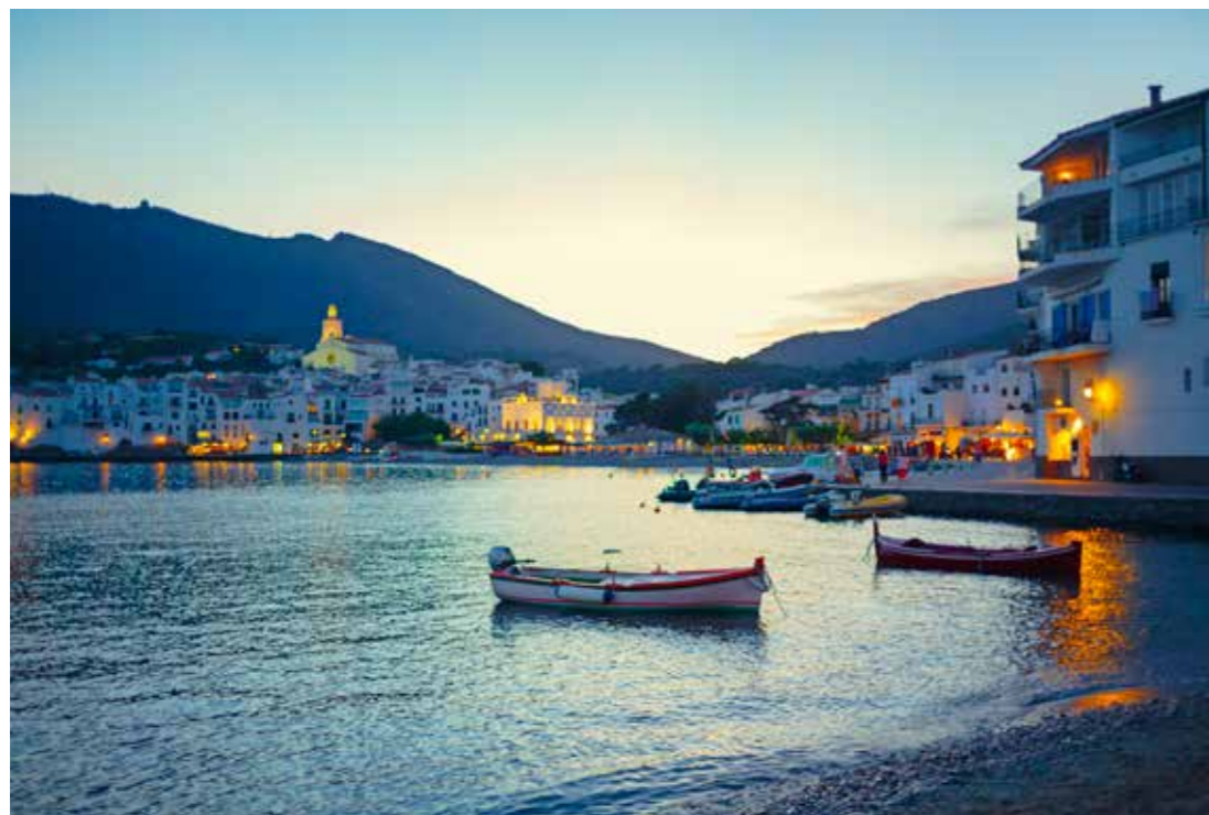
Het populaire maar authentiek gebleven Cadaqués was tot de jaren '50 alleen per boot bereikbaar.

OP HET PLATTELAND VAN CATALONIË lijkt de tijd niet eens te bestaan. In middeleeuwse bergdorpjes als Besalu met zijn 100 meter lange, kronkelende vestingbrug of het ommuurde handelsstadje Pals verstopt in de heuvels achter de Costa Brava vind je geen hippe cafés, neonverlichte etalages of zelfs maar een supermarkt. Je kunt er hooguit een cortado (sterke koffie met een scheut melk) drinken op een stoffig terras of slenteren door steegjes met basaltstenen. Wie nog dieper de geschiedenis in wil duiken, kan de cisterciënzenroute volgen langs de mooiste abdijen van Spanje. Daarvan is het middeleeuwse klooster van Poblet het grootste nog bewoonde van Europa. Het klooster ademt de Spartaanse rijkdom van de 14 de eeuw, toen de abdijs eigenaar was van alle omliggende landbouwgrond. De Romaanse architectuur met sierlijke bogen en robuuste pilaren is groots en eenvoudig tegelijk, geheel volgens de cisterciënzer principes van nederigheid. Deze kloosters liggen bovendien in kneuterige dorpjes waar in siëstatijd het getijlp van krekels en gezoem van vliegen de enige levenstekens zijn. Behalve tijdens een van de vele festivals. De geboortedag van een heilige, de mythologische verjaging van een draak of gewoon een lokale diersoort als de eekhoorn kan in Catalonië al genoeg zijn voor een dag en nacht vol zang, dans en vooral heel veel eten en drinken.