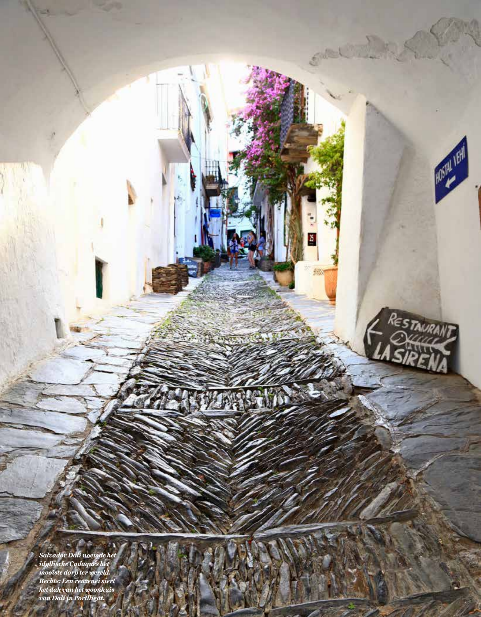
Salvador Dalí noemde het idyllische Cadaqués het mooiste dorp ter wereld. Rechts: Een reuzenei siert het dak van het woonhuis van Dalí in Portlligat.