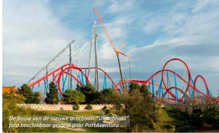
De bouw van de nieuwe achtbaan “Shambhala”

De toeristen komen natuurlijk in de eerste plaats voor de schitterende monumenten, zoals de oude en de nieuwe kathedraal; de universiteit, gebouwd in gotische stijl tussen 1415 en 1433 in opdracht van de tegenpaus Papa Luna en de Romeinse brug, die nog dateert uit de tijd van Trajanus.