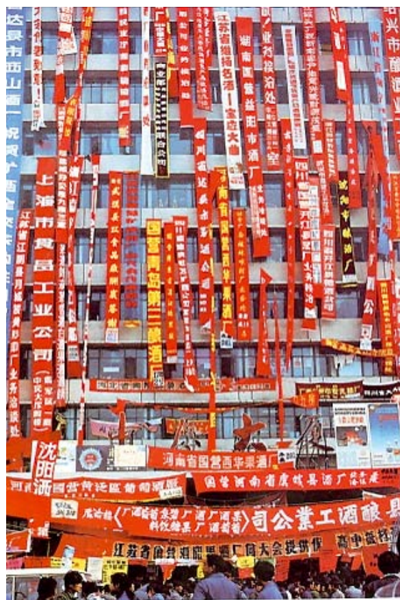
▶ Zhang Xinmin