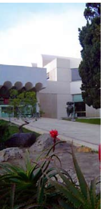
▶ Fondation Miró

Elle est coproduite par la Cité de l'architecture & du patrimoine, l'Institut français d'architecture (Ifa) et le Centre de Culture Contemporaine de Barcelone (CCCB). Jusqu'au 22 février.