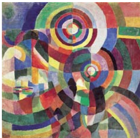
► Sonia Delaunay

L'exposition présente les œuvres d'une quarantaine de maîtres dont l'importance permet de comprendre la multiplicité des chemins suivis pour aboutir à un art libéré de la représentation de la réalité. Parmi eux : Robert et Sonia Delaunay, Hans Richter, Francis Picabia, Hans Arp, Joaquín Torres García, Julio González, Antoni Tàpies, etc. Jusqu'au 7 décembre 2009.