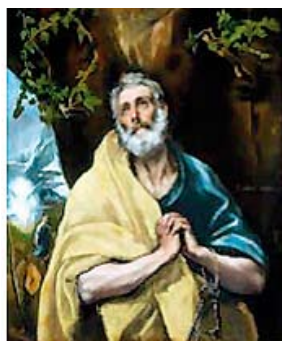
► El Greco

artistes comme Picasso ou Pollock. El Greco avait élu domicile à Tolède à la fin du XVI e siècle et y mourut. L'exposition recrée l'atmosphère historique de Tolède au début du XX e siècle, moment-clé dans la récupération de la figure de El Greco. Jusqu'au 23 novembre.