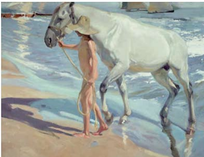
► Joaquín Sorolla