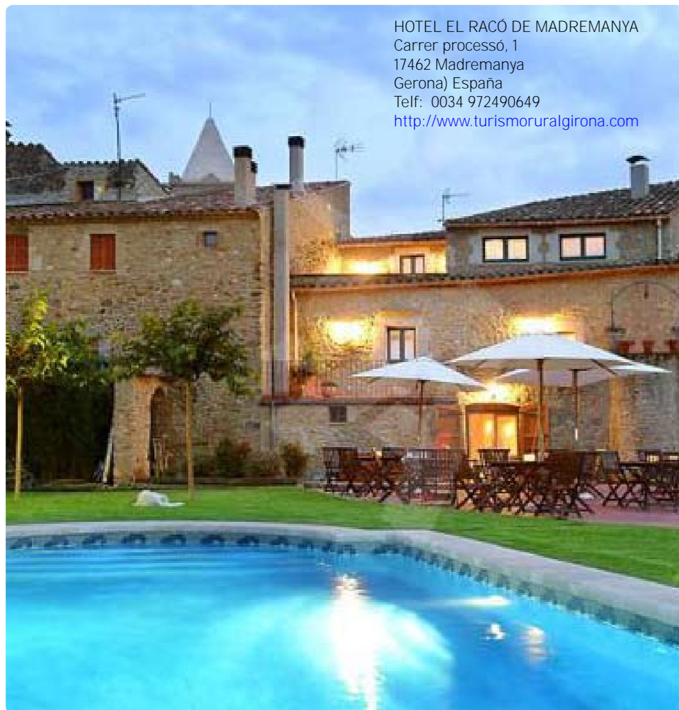
HOTEL EL RACÓ DE MADREMANYA Carrer processó, 1 17462 Madremanya Gerona) España Telf: 0034 972490649 http://www.turismoruralgirona.com

fantastisk gressteppe som rommer to flotte svømmebasseng (et av dem med saltvann) for de ekstra varme dagene. Hotellet har ti rom, alle med middelalderlandsbyens sjarme og moderne komfort. De tre suiteene og syv rommene er alle dekorert på ulike måte, men har den varme atmosfæren til felles.