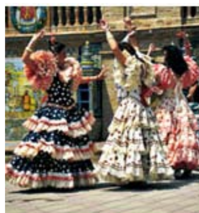
Alle bilder Feria de Abril i Sevilla