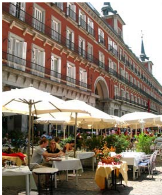
Cibeles og Plaza Mayor i Madrid sentrum