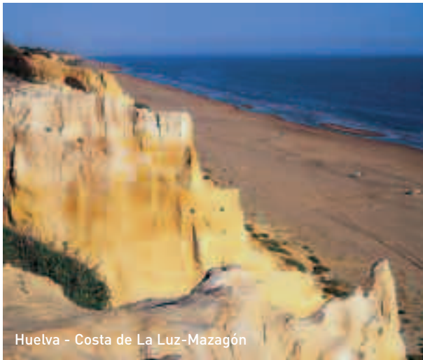
Huelva - Costa de La Luz-Mazagón