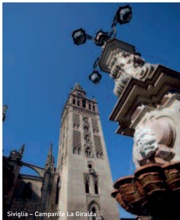
Siviglia – Campanile La Giralda

Gite in barca Cruceros Turísticos Torre del Oro. Partenza: Paseo Alcalde Marqués del Contadero, s/n - Tel +34 954 534 720 / +34 954 561 692 - www.cruceorstorredeloro.com