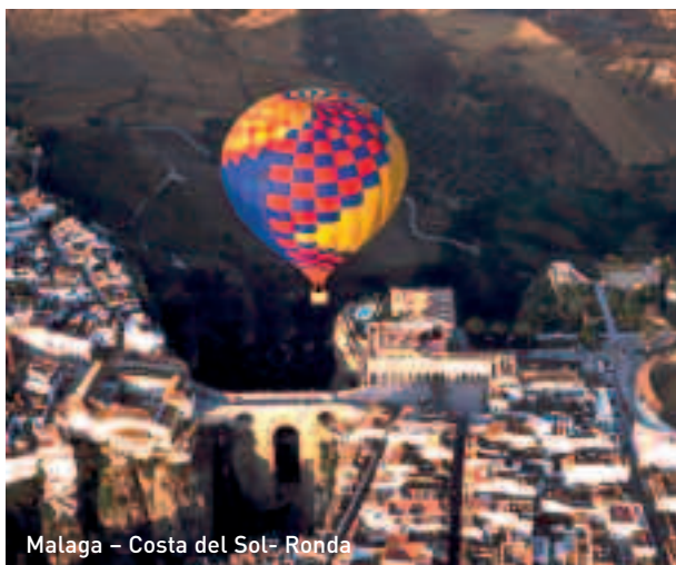
Malaga – Costa del Sol- Ronda

Museo Picasso C/ San Agustín, 8 – Orario: Mar-gio: 10-20 / Ven-sab: 10-21 / Dom e fest: 10-20 / 24 e 31 Dic: 10-15 Chiusura: lun, 25 Dic e 1 Gen - Tel +34 902 443 377 info@museopicassomalaga.org - www.museopicassomalaga.org CAC Centro d' Arte Contemporanea di Malaga C/ Alemania, s/n Tel +34 952 120 055 - Fax +34 952 210 177 cacmalaga@cacmalaga.org - www.cacmalaga.org Museo Thyssen Plaza Carmen Thyssen (C/Compañía 10) Tel +34 902 303 131 - www.carmenthyssenmalaga.org/info.html Museo dell'automobile Edificio Tabacalera - Avda. Sor Teresa Prat 15 -www.museoautomovilmalaga.com