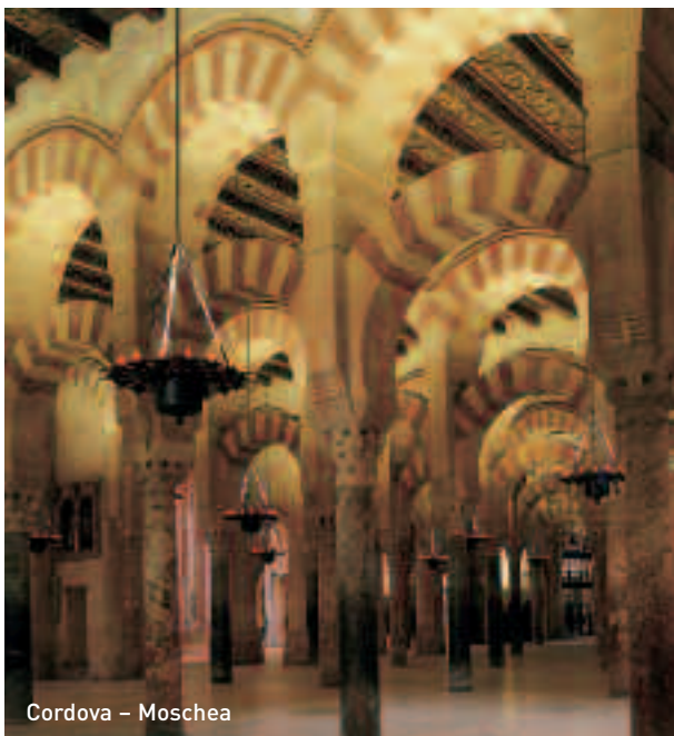
Cordova – Moschea

Ruta del Tempranillo -Tel: +34 957 51 90 51 / 957 51 90 71 E-mail: info@destinobandolero.com