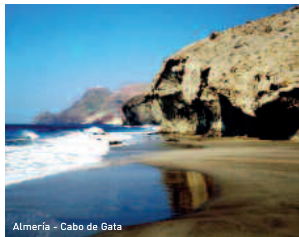
Almería - Cabo de Gata

Tel +34 950 380 299 - www.cabodegata-nijar.com