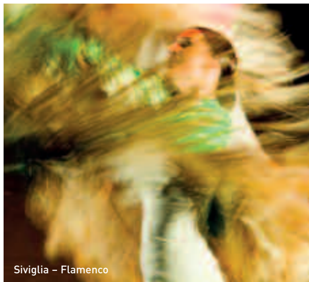
Siviglia - Flamenco