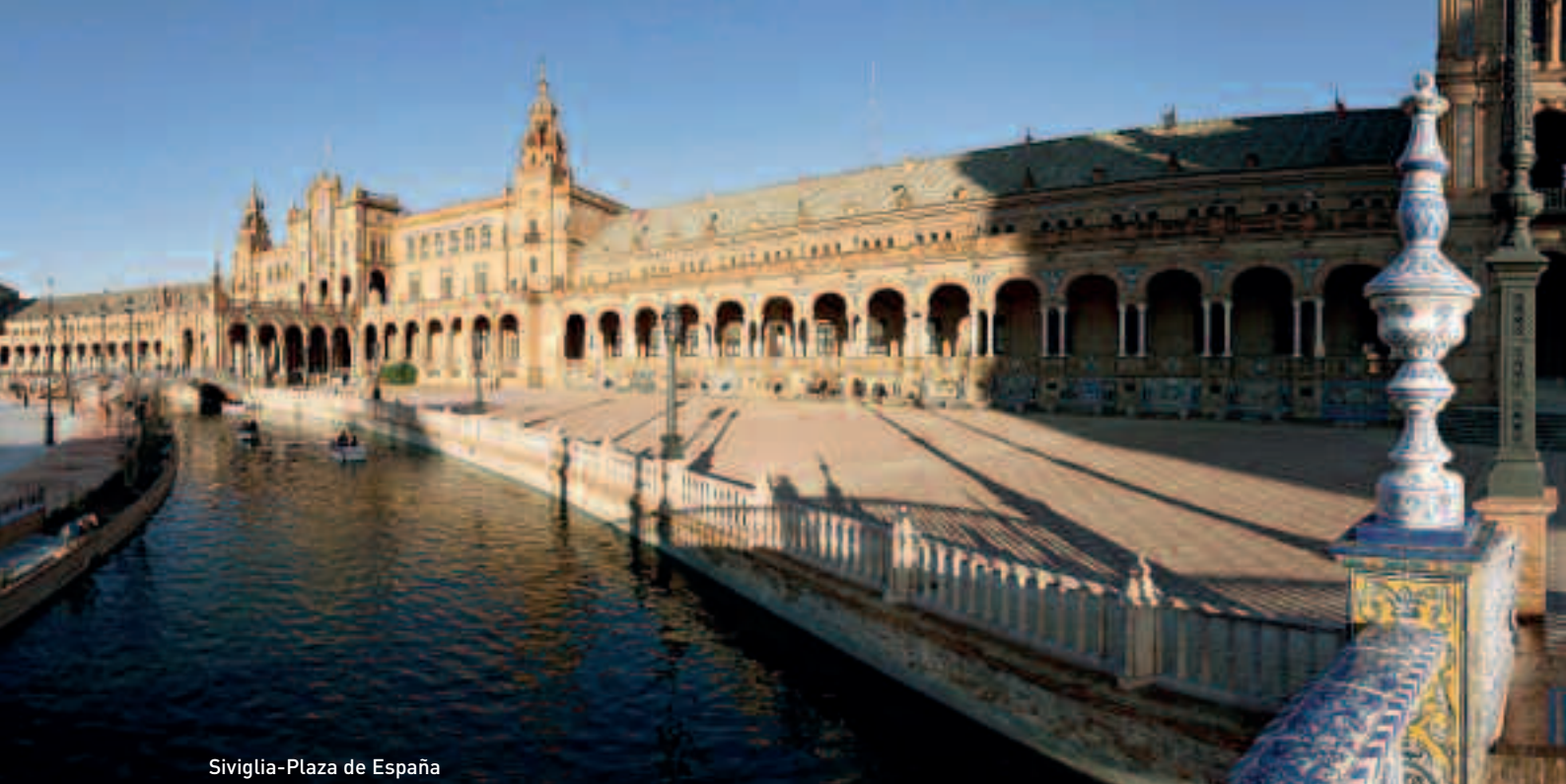
Siviglia-Plaza de España