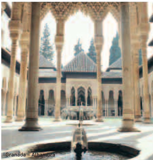
Granada - Alhambra