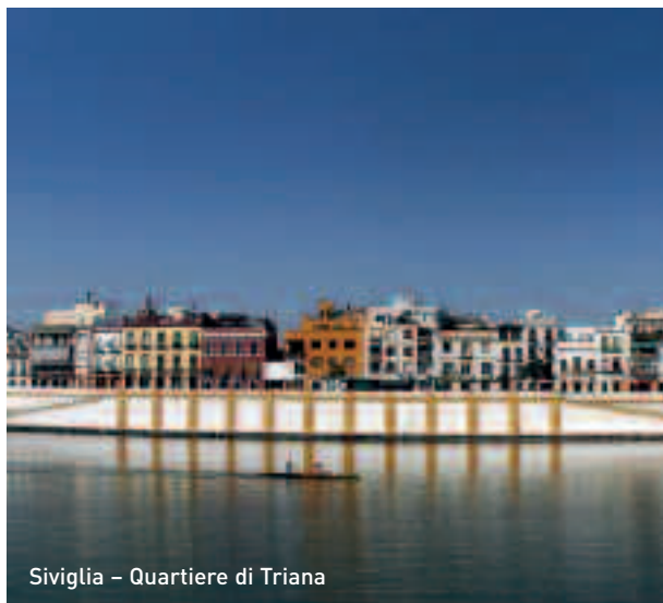
Siviglia - Quartiere di Triana

Fiera d'aprile (24-29 Aprile): due settimane dopo Pasqua gruppi diversi si incontrano tra le "casetas" (capannoni) per socializzare e ballare al ritmo delle "sevillanas". Ogni giorno sfilano cavalieri e donne nei costumi tradizionali.