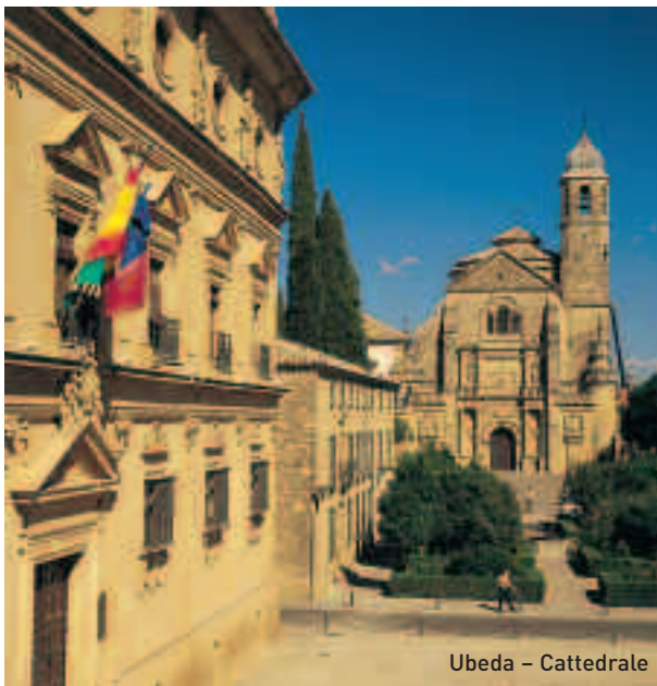
Úbeda - Cattedrale