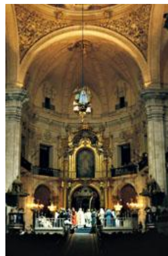
聖母マリア被昇天の様子

毎年8月14日、15日の二日間、アリカンテ県、バレンシア州第3の都市エルチェ(Elche)の旧市街にあるサンタ・マリア教会では、聖母マリアの死から被昇天、戴冠までを物語る宗教歌劇が行われます。14日と15日の2部制で、アマチュア歌手と聖母マリアの声を担当する少年少女聖歌隊によって構成されています。また教会を舞台にした演出も素晴らしく、特に、教会の交差廊上部のドームに張られた天空が開き、そこから聖母マリアを迎えに天使が降りてくる場面は圧巻です。2001年にユネスコの無形文化遺産に登録された、このスケール感満点の宗教劇は遇数年に限り再演されます。今年スケジュールは10月29日、30日、11月1日です。