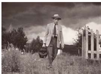
► W.Eugene Smith

pour la vérité, l'idéalisme et l'optimisme. Le cœur de l'exposition est constitué par quelques-uns de ses projets indépendants comme Pittsburgh (1955-1957) pour lequel l'auteur prit plus de 10000 clichés ou Minamata (1971-1975), une investigation sur la pollution chimique dans l'île japonaise du même nom. Jusqu'au 1 er février.