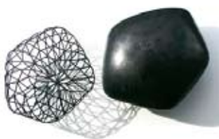
► Yi Fung

Historien et critique d'art, Carl Einstein fut l'une des personnalités les plus remarquables pour l'étude des avant-gardes. L'exposition présente un total de 120 œuvres d'artistes comme Braque, Dalí, Grosz, Léger, Miró, Picasso, Rousseau, Paul Klee, Otto Dix... Jusqu'au 16 février.