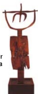
► Nestor Basterretxea

siècle. Au total, 18 sculptures – 17 en bois de chêne et une en bronze – réalisées entre 1972 et 1975. Les pièces représentent des personnages mythologiques, des forces de la nature et des objets traditionnels de la culture basque.