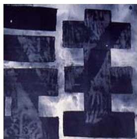
► L'École Yi

• MUSÉE NATIONAL CENTRE D'ART REINA SOFÍA www.museoreinasofia.es ► “L'invention du XX e siècle. Carl Einstein et les Avant-Gardes”