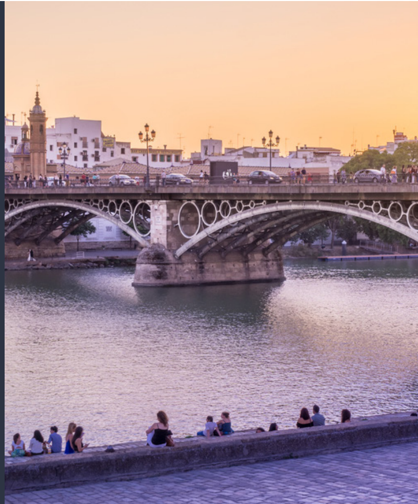
▲ PONTE DE ISABEL II

Em Triana também vais encontrar maravilhas arquitetónicas como o beco de la Inquisición , onde se conservam restos do antigo castelo de San Jorge. Na basílica de Patrocinio poderás admirar a imagem de El Cachorro, figura emblemática da Semana Santa sevilhana.