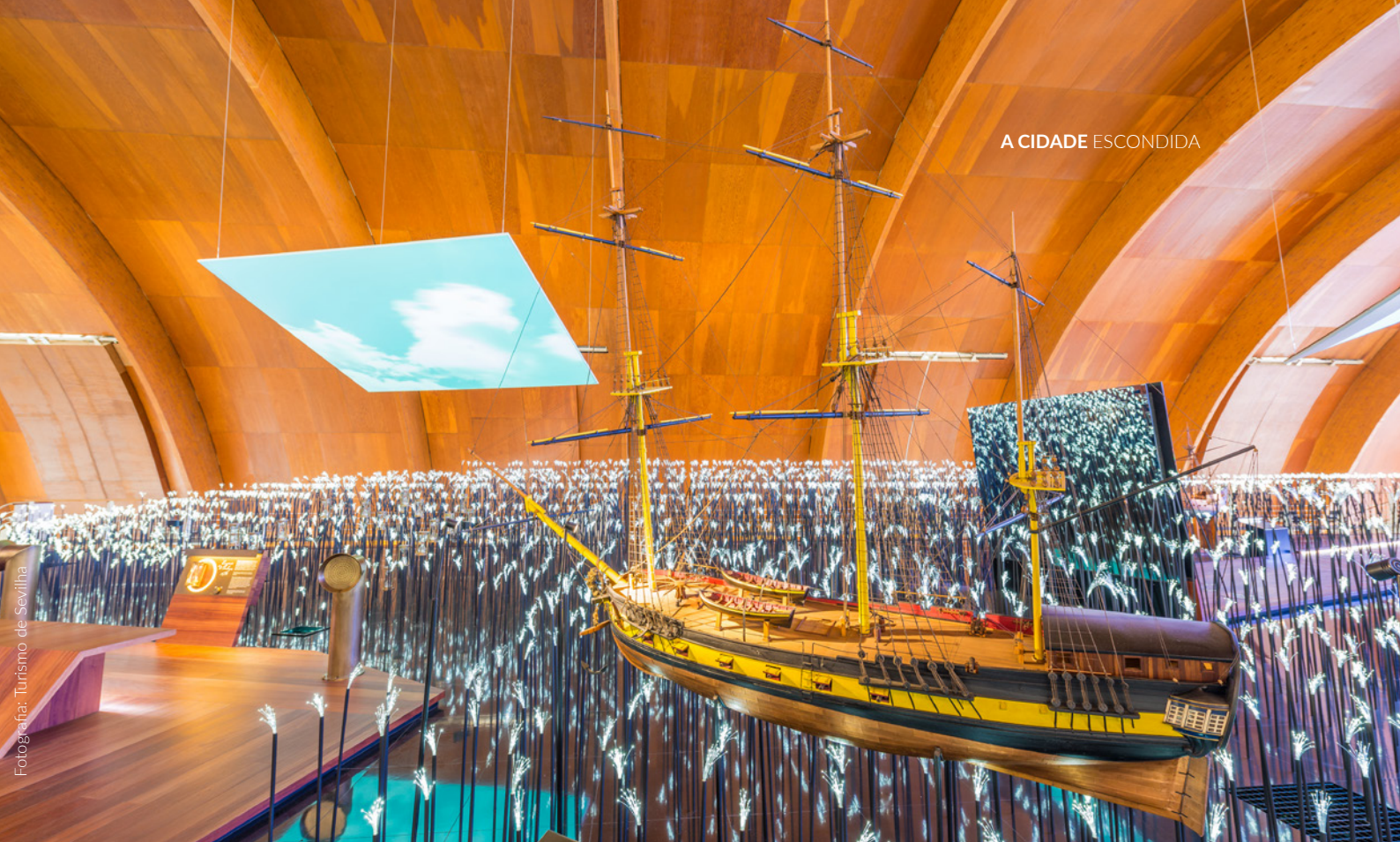
▲ PAVILHÃO DA NAVEGAÇÃO