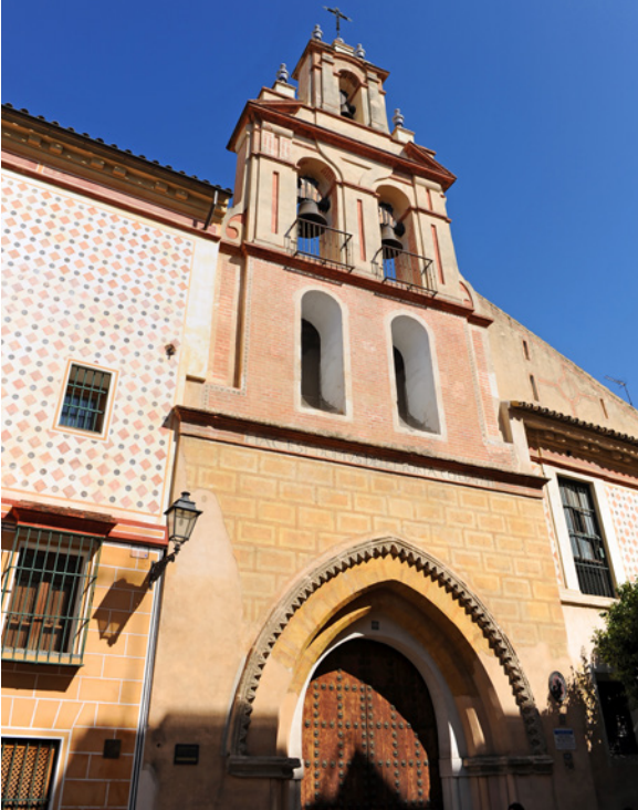
▲ IGREJA DE SANTA MARÍA LA BLANCA SEVILHA

Também podes mergulhar na tradição árabe de Sevilha, que foi, durante mais de cinco séculos, uma cidade muçulmana chamada Isbiliya . Na rota da herança islâmica visita mesquitas, palácios, banhos árabes. Desenha o teu próprio percurso e lembra aquela época.