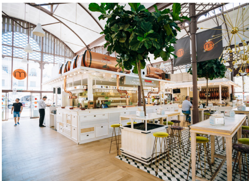
▲ MERCADO-LONJA DEL BARRANCO

Atravessa a ponte de Triana e perde-te entre as bancas do mercado do Arenal . Aí poderás encontrar desde espaços com comida tradicional à base de produtos andaluzes e ecológicos até opções veganas criativas. Também poderás participar em cursos de provas de vinhos.