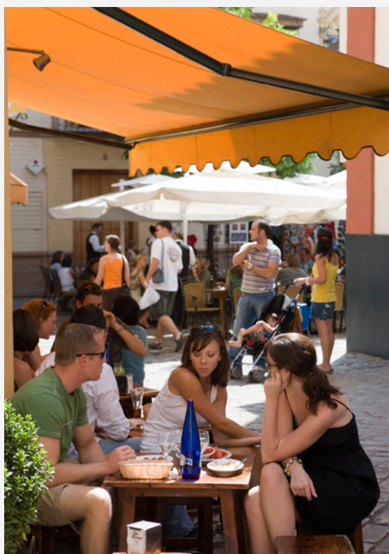
▲ BAIRO DE SANTA CRUZ

É indiferente a época em que decidas ir a Sevilha. Aqui vais encontrar sempre alguma coisa para fazer: provar tapas, ver flamenco ao vivo, navegar pelo Guadalquivir ou viver o feitiço da Semana Santa.