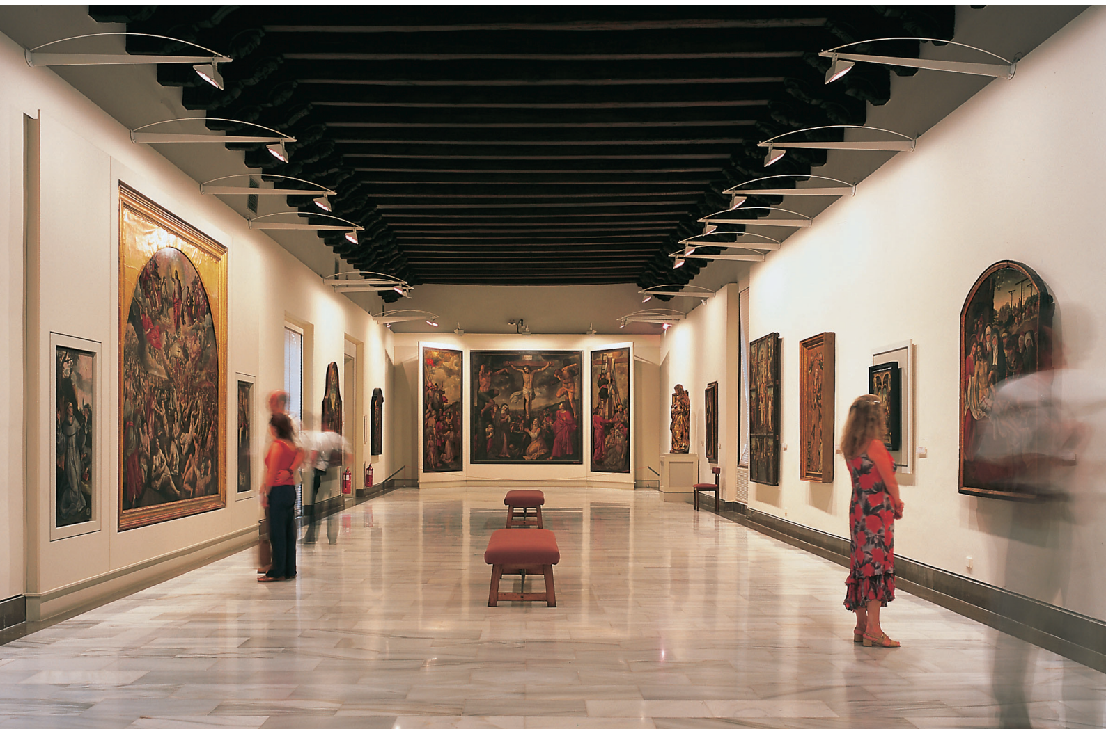
▲ MUSEU DE BELAS-ARTES

A cidade de Sevilha assistiu à passagem das mais diversas civilizações e estilos artísticos. Conhece a sua história nos seus museus, teatros e centros culturais.