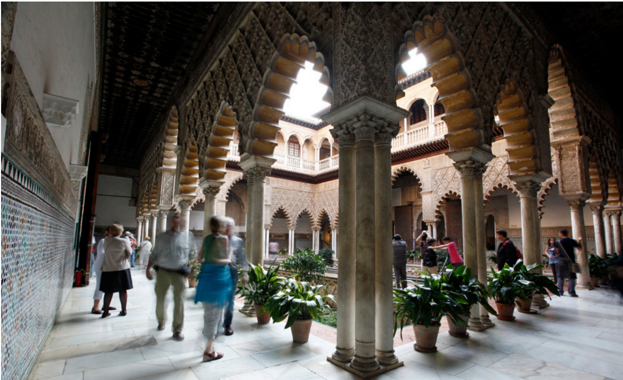
▲ REAL ALCÁZAR DE SEVILHA

Sevilha distingue-se pelos seus bairros fascinantes. Como o de Santa Cruz , em pleno centro, com as suas ruelas, palácios e pátios floridos, o de Triana , do outro lado do Guadalquivir, de ambiente marinho e arte flamenco, ou o de La Macarena , popular e cheio de história.