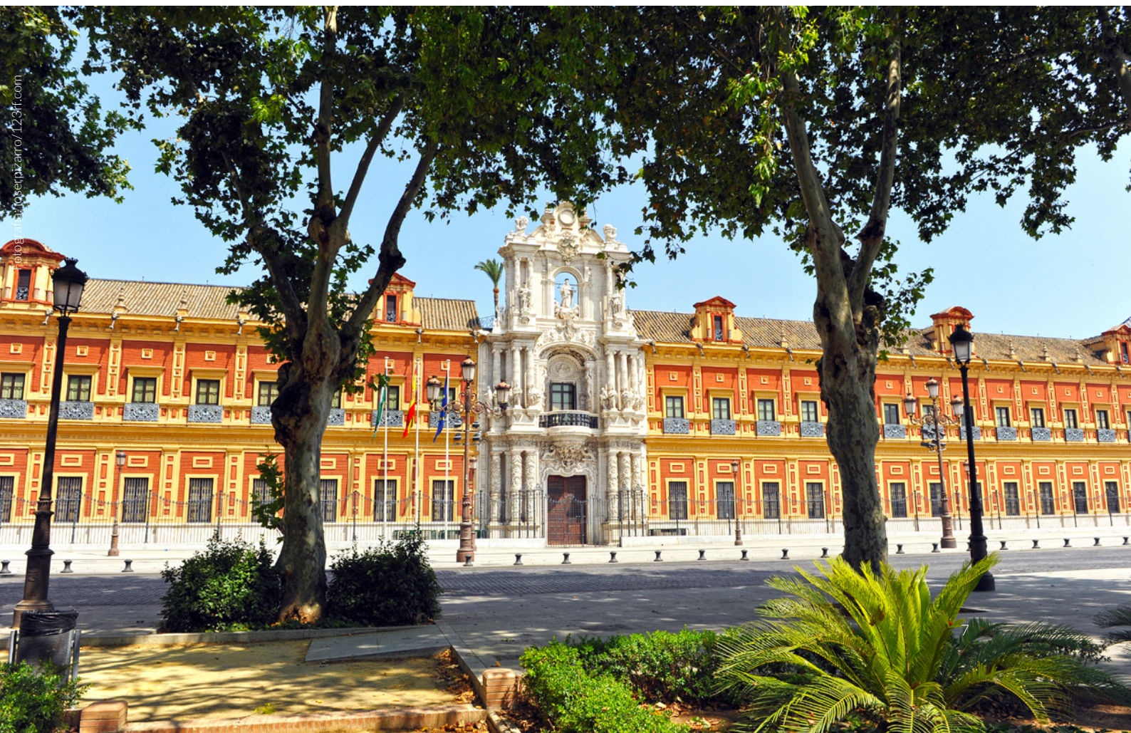
▼ PALÁCIO DE SAN TELMO

Dedica algum tempo a passear pela Alameda de Hércules , a zona alternativa de Sevilha por excelência, com a sua incrível mistura de lugares históricos, propostas culturais e vida noturna. Tens muitos bares com música ao vivo e espaços de música eletrónica.