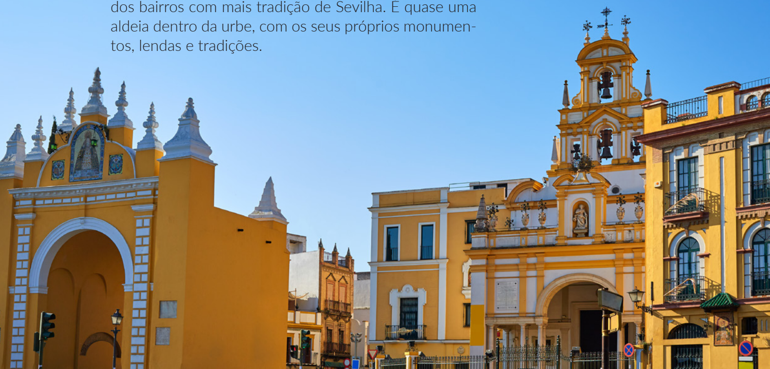
▲ ARCO E BASÍLICA DE LA MACARENA

Situado a norte do centro histórico, La Macarena é um dos bairros com mais tradição de Sevilha. É quase uma aldeia dentro da urbe, com os seus próprios monumentos, lendas e tradições.