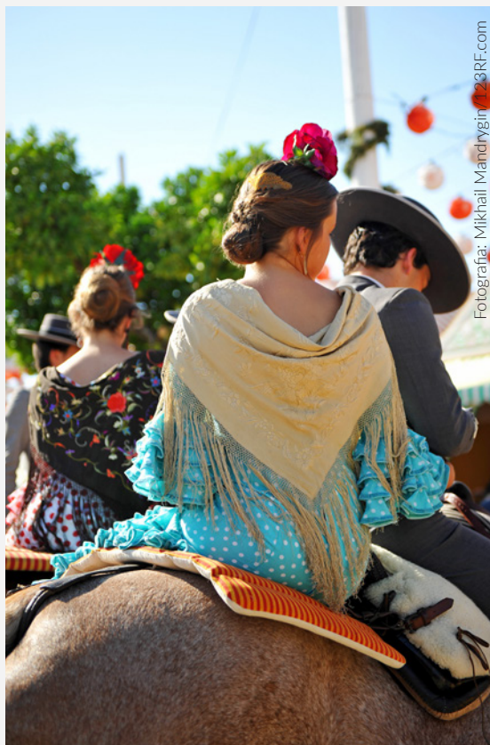
▲ FEIRA DE ABRIL SEVILHA

O outro grande evento é a Feira de Abril . É a feira de todas as feiras, que começa na noite do «alumbrao», quando se acendem as 250 000 lâmpadas do recinto de