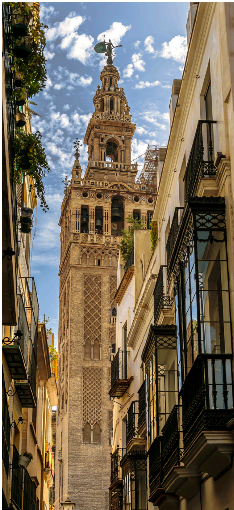
▲ A GIRALDA

Saboreia a cidade através dos seus bares do centro histórico e prova uma grande variedade de tapas deliciosas . O ritmo sevilhano está na rua. Impregna-te da sua atmosfera vitalista numa esplanada com vistas para os grandes símbolos monumentais, como a catedral e a Giralda .