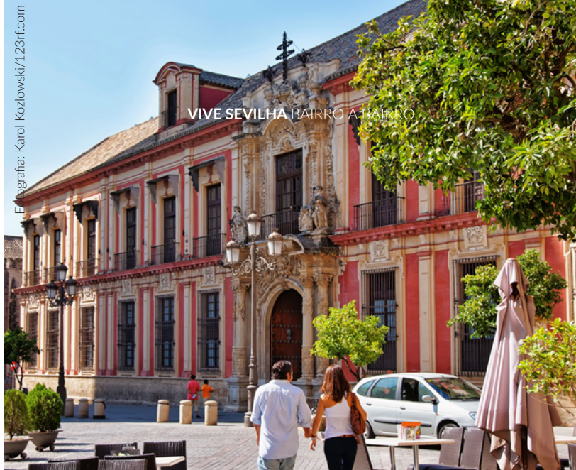
▲ PALÁCIO ARCEBISPAL

O palácio de Las Dueñas , uma imponente casa senhorial que foi residência de aristocratas e local de nascimento do poeta Antonio Machado. O seu belíssimo pátio, a sua coleção de peças artísticas e a recordação dos seus ilustres inquilinos vão-te deixar sem palavras. Tens outra paragem imprescindível no palácio de San Telmo , onde poderás admirar uma das portadas mais bonitas do barroco sevilhano.