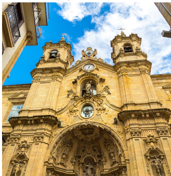
▲ BASÍLICA DE SANTA MARÍA DEL CORO

Poderás admirar a Catedral do Bom Pastor , o Teatro Victoria Eugenia ou a Câmara Municipal , cujo belo edifício foi sede do Gran Casino da cidade até à proibição do jogo em 1924.