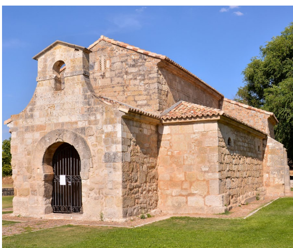
▲ ЦЕРКОВЬ СВ. ИОАННА В БОИ ВЕНТА-ДЕ-БАНЬОС (БУРГОС)