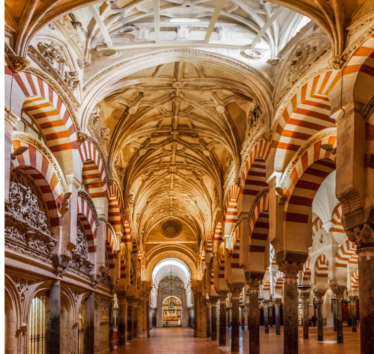
▲ КОРДОВСКАЯ МЕЧЕТЬ-КАФЕДРАЛЬНЫЙ СОБОР КОРДОВА

Восемь веков мусульманского присутствия оставили глубокий след на всем полуострове, но именно Андалусии эта культура подарила лучшую свою часть. Вам предстоит увидеть сооружения и здания, включенные в список объектов Всемирного наследия ЮНЕСКО.