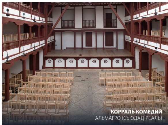
КОРРАЛЬ КОМЕДИЙ АЛЬМАГРО (СЬЮДАД-РЕАЛЬ)

В провинции Сьюдад-Реаль вас ждут знаменитые ветряные мельницы в Кампо-де-Криптана , с которыми сражался Дон Кихот. Посетите Альмагро , где сохранился корраль комедий XVII века. Не упустите возможность попробовать восхитительный сыр Манчего.