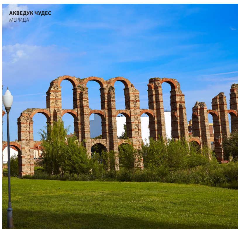
АКВЕДУК ЧУДЕС МЕРИДА

В старом еврейском квартале Касереса , внутри крепостных стен, находится часовня Святого Антония , на месте которой ранее располагалась синагога. Необычен вид белых домиков на крутых улицах, для которых крепостная стена служит одновременно задним фасадом. Город является местом проведения Европейских дней еврейской культуры в сентябре и Средневековой ярмарки трех культур в ноябре.