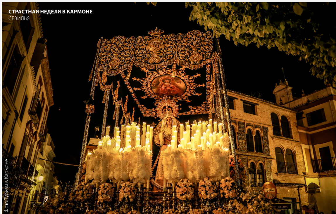
СТРАСТНАЯ НЕДЕЛЯ В КАРМОНЕ СЕВИЛЬЯ