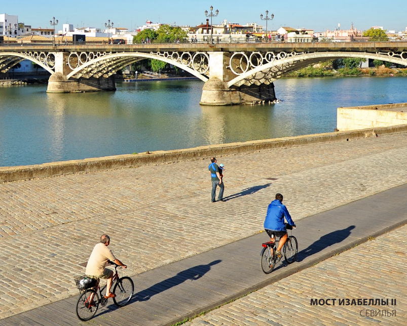
МОСТ ИЗАБЕЛЛЫ II СЕВИЛЬЯ