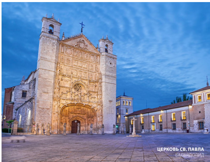
ЦЕРКОВЬ СВ. ПАВЛА ВАЛЬЯДОЛИД