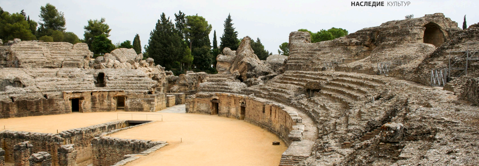
▲ РИМСКИЙ АМФИТЕАТР ИТАЛИКИ САНТИПОНСЕ (СЕВИЛЬЯ)

С помощью маршрута «По следам альморавидов и альмохадов» вы познакомитесь с архитектурным наследием, оставленным нам этой цивилизацией, в основном замками и оборонительными сооружениями. Маршрут начинается в городе Альхесирас (Кадис) и через 400 километров двумя путями приходит в Гранаду , Херес-де-ла-Фронтера (Кадис) и Ронда (Малага) — это некоторые из мест, в которых вам доведется побывать по пути.