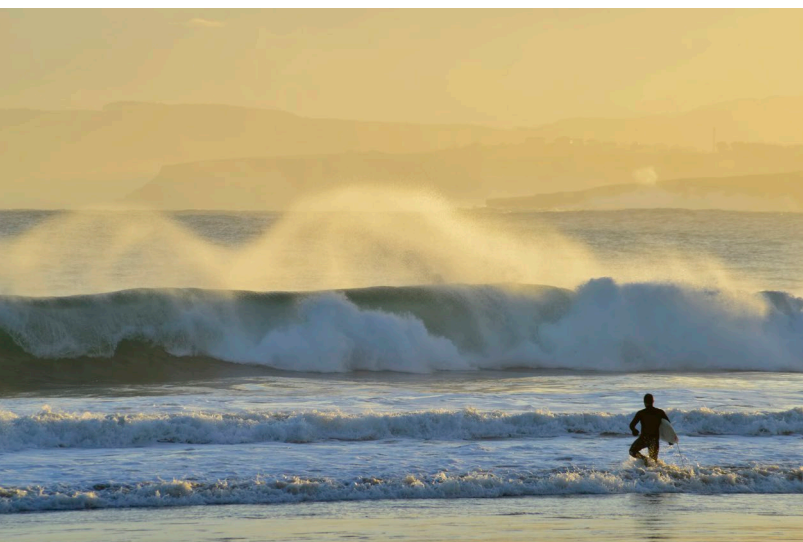
▲ ЛАРЕДО КАНТАБРИЯ

Проследуйте за Карлом V после отречения от престола в Брюсселе. Монарх прибыл на север Испании с флотилией из более 50 кораблей и отправился в путь через Кантабрию , Кастилью-и-Леон и Эстремадуру до места своего уединения, монастыря в Юсте .