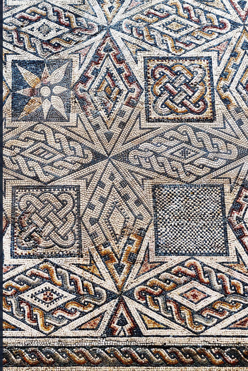
▲ РИМСКАЯ МОЗАИКА НАЦИОНАЛЬНЫЙ МУЗЕЙ РИМСКОГО ИСКУССТВА (МЕРИДА)

В Эстремадуре вы увидите долины с возделанными землями, виноградники и пастбища. Вас впечатлят старый центр Касереса и археологический комплекс Мериды , включенные в список объектов Всемирного наследия ЮНЕСКО. В провинции Касерес вас ждет живописная деревушка Эрвас , знаменитая своим еврейским кварталом, и Пласенсия , где стоит отметить архитектурный ансамбль, в который входят два кафедральных собора, дворцы и особняки аристократии. Порадуйте себя иберийским хамоном из Эстремадуры, являющимся одним из лучших в стране, и расслабьтесь в древнеримской водолечебнице Баньос-де-Монтемайор .