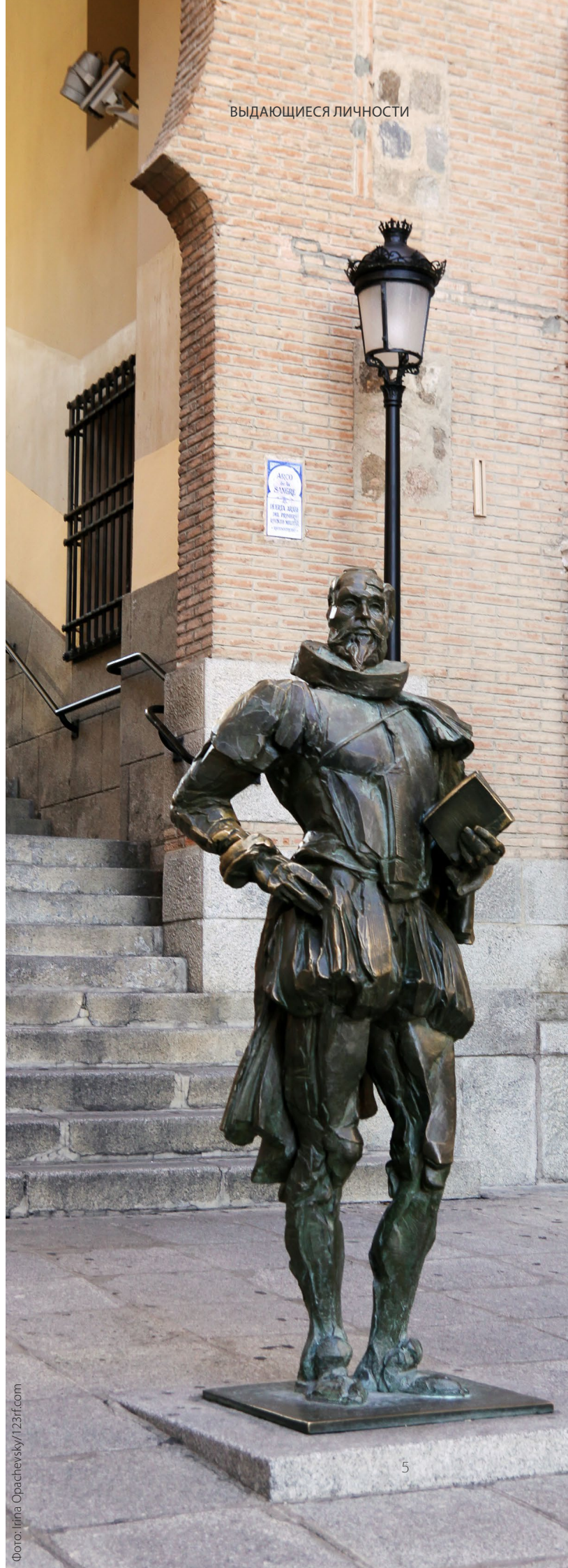
► СКУЛЬПТУРА СЕРВАНТЕСА ТОЛЕДО