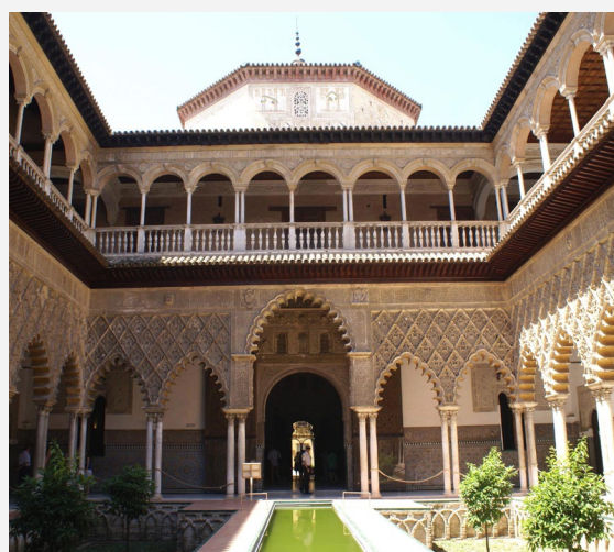
▲ ДЕВИЧИЙ ДВОР КОРОЛЕВСКОГО АЛЬКАСАРА В СЕВИЛЬЕ СЕВИЛЬЯ

звезды с цилиндрической башней на конце каждого луча. Если вам придется путешествовать в мае и июне, вы сможете побывать на исторических днях в замке, во время которых воссоздается средневековая военная жизнь во всех ее аспектах.