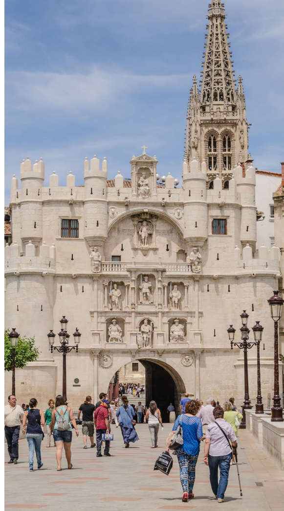
▲ АРКА СВЯТОЙ МАРИИ БУРГОС

Кастилья-и-Леон ждет вас. Рекомендуем побывать в средневековом городке Медина-де-Помар (Бургос), где Карл V провел одну ночь, и величественном замке XIV века Алькасар-де-лос-Веласко . В монументальном городе Бургос пройдите под Аркой Святой Марии , служившей в свое время одними из входных ворот в город.