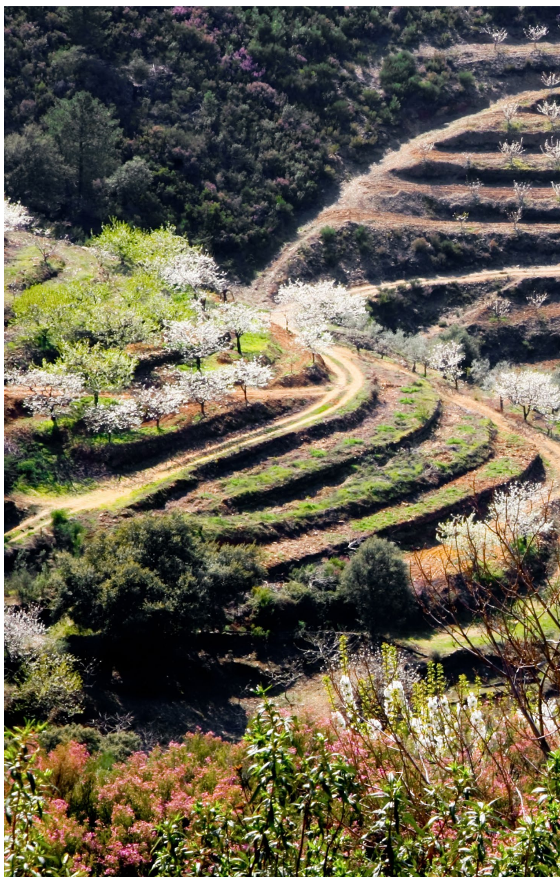
▼ ДОЛИНА ХЕРТЕ КАСЕРЕС