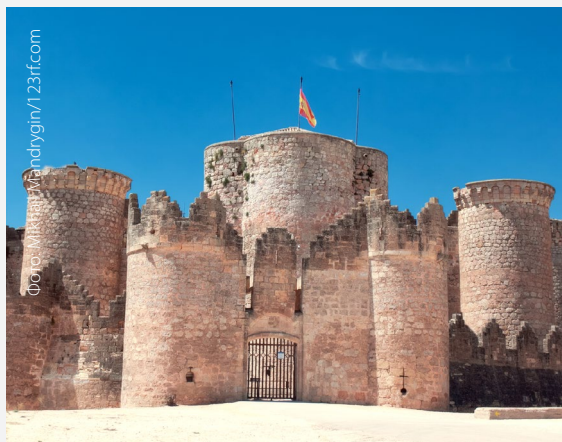
▲ ЗАМОК БЕЛЬМОНТЕ КУЭНКА

Великолепными замками изобилует вся территория Испании. Это и замок Кастильо-де-ла-Мота в Вальядолиде, и замок Лоарры в Уэске, и Альмодовар-дель-Рио в Кордове и многие другие. Получите информацию в туристических офисах; в каждом из автономных сообществ имеется свой собственный маршрут.