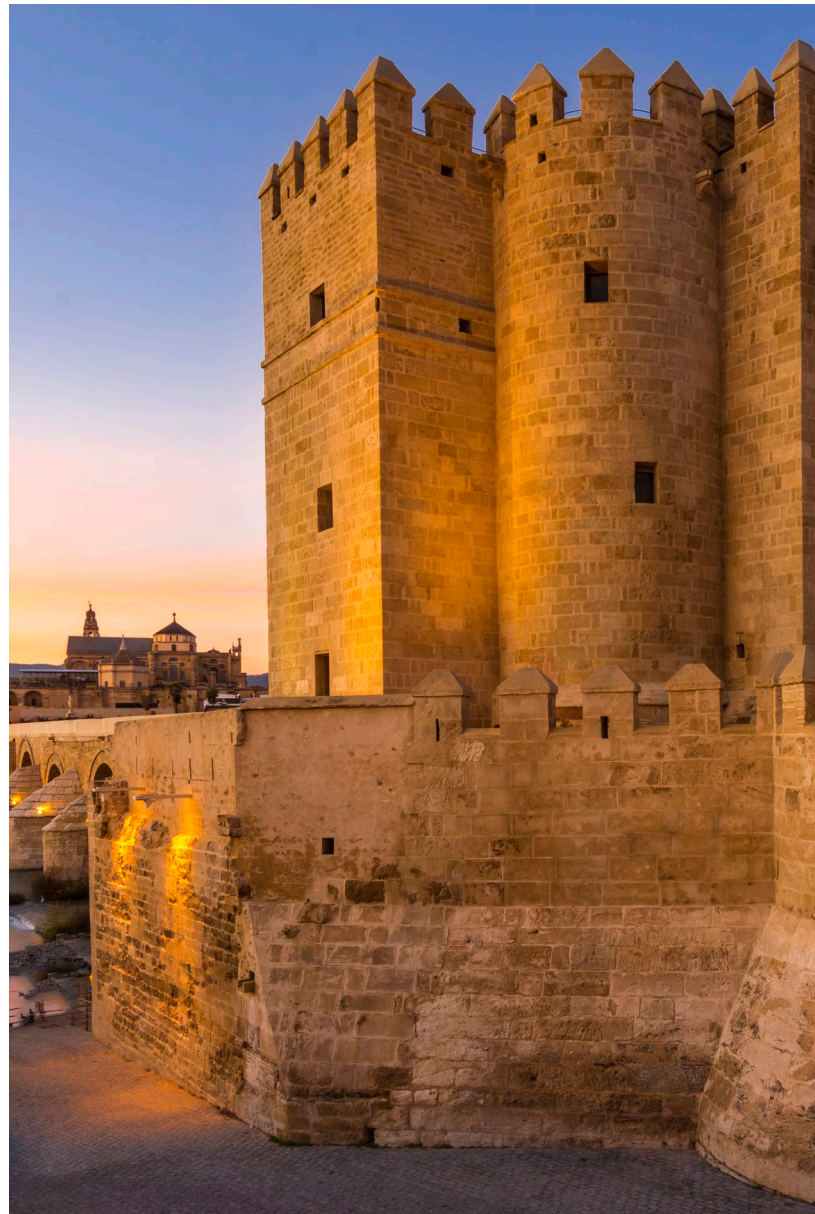
▼ TORRE DE LA CALAHORRA

Si buscas una panorámica más completa, a unos 15 kilómetros de la ciudad se encuentran Las Ermitas , lugar de recogimiento religioso desde el medievo. Dentro del recinto se ubica un magnífico mirador presidido por el monumento al Sagrado Corazón de Jesús. Desde este lugar obtendrás una maravillosa vista de la ciudad y parte de la Vega del Guadalquivir.