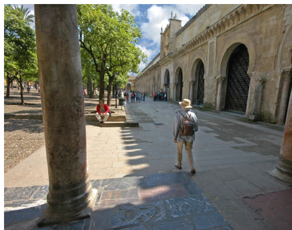
▲ PATIO DE LOS NARANJOS MEZQUITA-CATEDRAL DE CÓRDOBA

del Perdón . El bello Patio de los Naranjos es la antesala del impresionante bosque de columnas con arcos de herradura bicolores que hay en su interior.