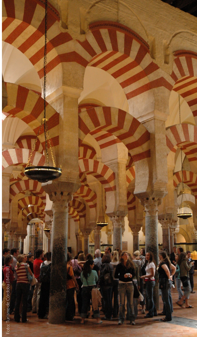
▲ MEZQUITA-CATEDRAL DE CÓRDOBA

Andalucía es sol, alegría y espíritu festivo. Compruébalo en mayo, cuando sus calles se perfuman con el aroma del jazmín, una de las flores que no pue-