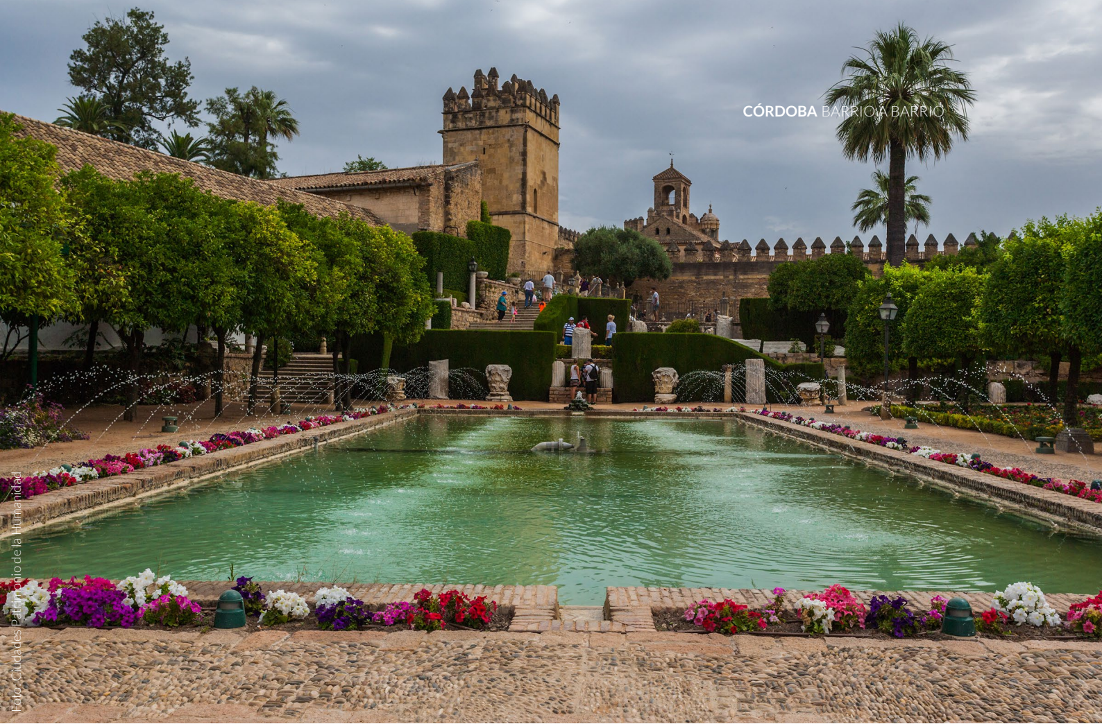
▲ ALCÁZAR DE LOS REYES CRISTIANOS