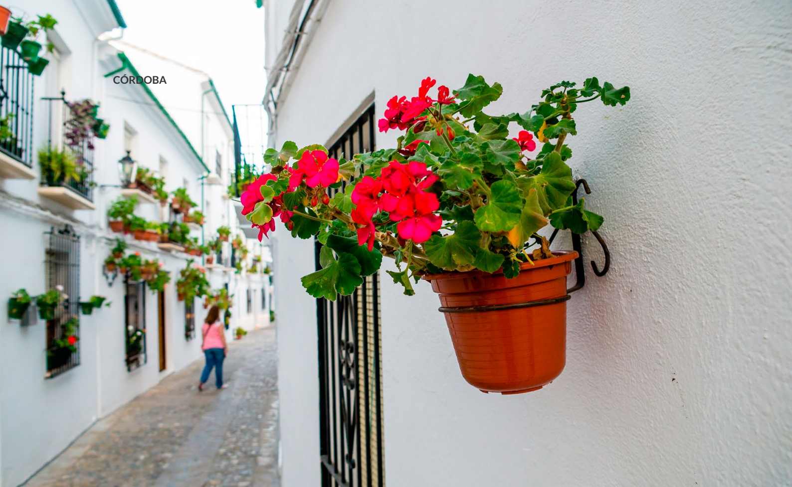
▲ PRIEGO DE CÓRDOBA

Si quieres conocer una de las poblaciones más antiguas de la comarca, pon rumbo a la encantadora Cabra . Custodiada por sierras, manantiales y parques naturales de gran belleza, conserva su pasado andalusí en su doble recinto amurallado y en el hermoso castillo de los Condes de Cabra. Además, posee uno de los conjuntos barrocos más interesantes de toda Andalucía, con joyas como la parroquia de Nuestra Señora de la Asunción y Ángeles.