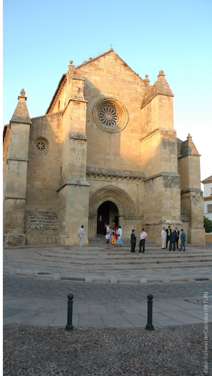
▲ IGLESIA DE SANTA MARINA

Por su parte, la iglesia de San Agustín destaca por su maravilloso interior, una de las joyas cordobesas del barroco. Gracias a su reciente restauración, quedaron a la vista hermosos murales y frescos de gran riqueza cromática. Guarda muchas similitudes con las capillas de la iglesia de San Cayetano , ubicada en lo que se conoce como Cuesta