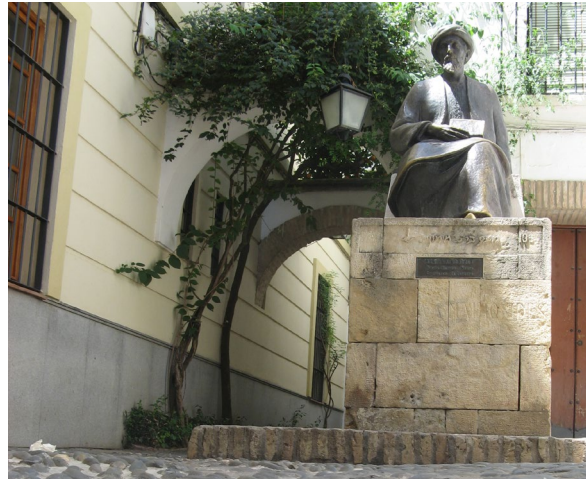
▲ ESCULTURA Y PLAZA DE MAIMÓNIDES

En la misma Judería, documentando el pasado hebreo de la ciudad, se encuentra la Casa de Sefarad - Casa de la Memoria . Cuenta con una exposición