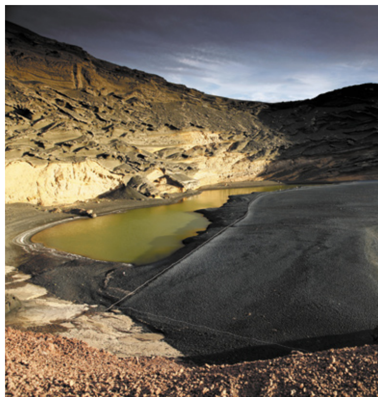
JEZIORO CHARCO DE LOS CLICOS LANZAROTE ▶

Poznasz również lagunę Janubio i dotrzesz do punktu widokowego, skąd możesz zobaczyć saliny. Niesamowite wrażenie robi też zielone jezioro w kraterze wulkanu zwane Charco de los Clicos .