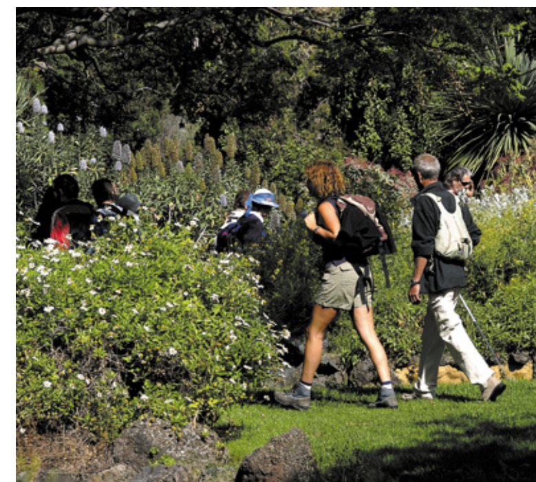
▼ KANARYJSKI OGRÓD BOTANICZNY VIERA Y CLAVIJO LAS PALMAS DE GRAN CANARIA