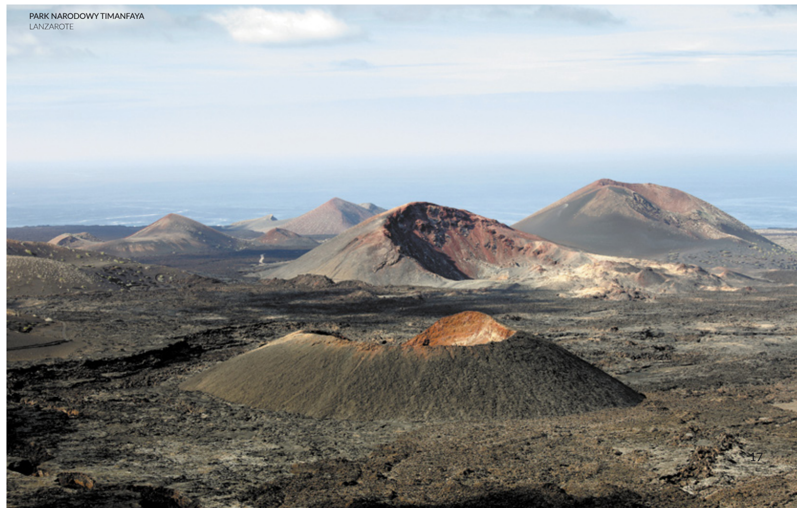
PARK NARODOWY TIMANFAYA LANZAROTE

O zachowanie nienaruszonego środowiska Parku Timanfaya dba się, ograniczając dostęp tylko do niektórych wyznaczonych obszarów. Najaktywniejsi turyści będą mogli poznać jego zakamarki na grzbiecie dromadera, pieszo, konno lub na rowerze. Miłośnicy nauki zaspokoją głód wiedzy w centrum informacyjnym Mancha Blanca. Dzieciom natomiast spodoba się uczucie ciepła emanującego spomiędzy skał uspiętego wulkanu. Wejść na górze Rajada i podziwiać ogromne morze lawy, które ciągnie się aż do wybrzeża.