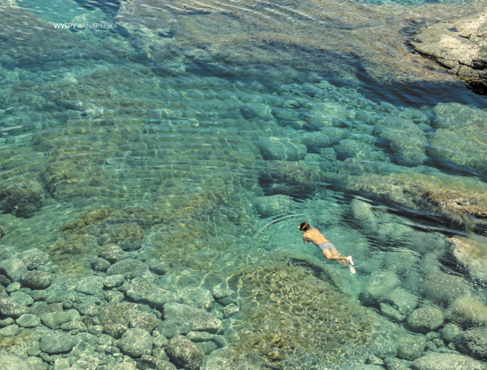
▲ NATURALNE BASENY LOS CHARCONES LANZAROTE