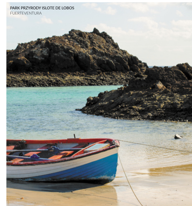
PARK PRZYRODY ISLOTE DE LOBOS FUERTEVENTURA

Wiatry i morskie fale u wybrzeży Fuerteventury sprzyjają ćwiczeniu umiejętności na desce windsurfingowej. Nurkowanie na wszystkich poziomach zaawansowania jest uprawiane wyjątkowo chętnie na plażach półwyspu Jandía oraz w Caleta de Fuste . Żeglarstwo, surfing, narty wodne lub wędkarstwo (jeśli szukasz mocnych wrażeń, wybierz połowy marlina) to inne sporty do twojej dyspozycji na wyspie.