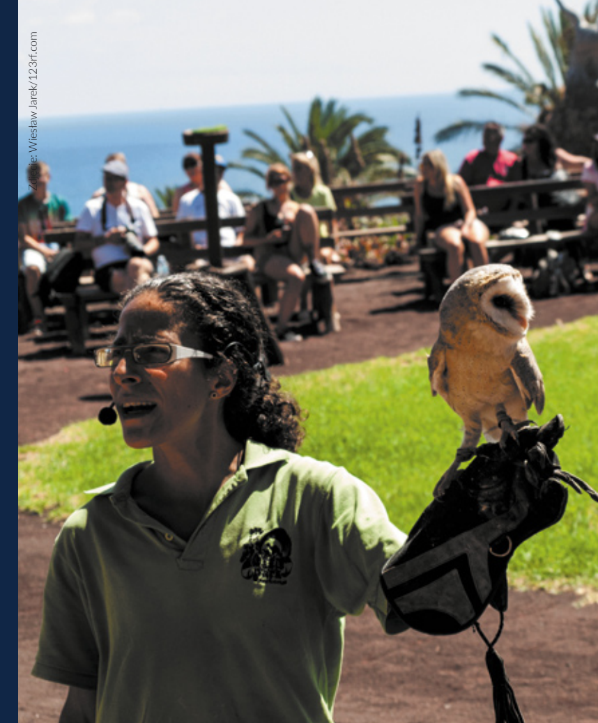
▲ OASIS PARK FUERTEVENTURA

Wielu emocji dzieciom dostarczy też wizyta w Lanzarote Aquarium , gdzie mogą spacerować podwodnym tunelem wśród różnych gatunków rekinów czy spędzić czas w akwariach dotykowych pozwalających dowiedzieć się więcej o gatunkach takich jak jeżowce i strzykwy.