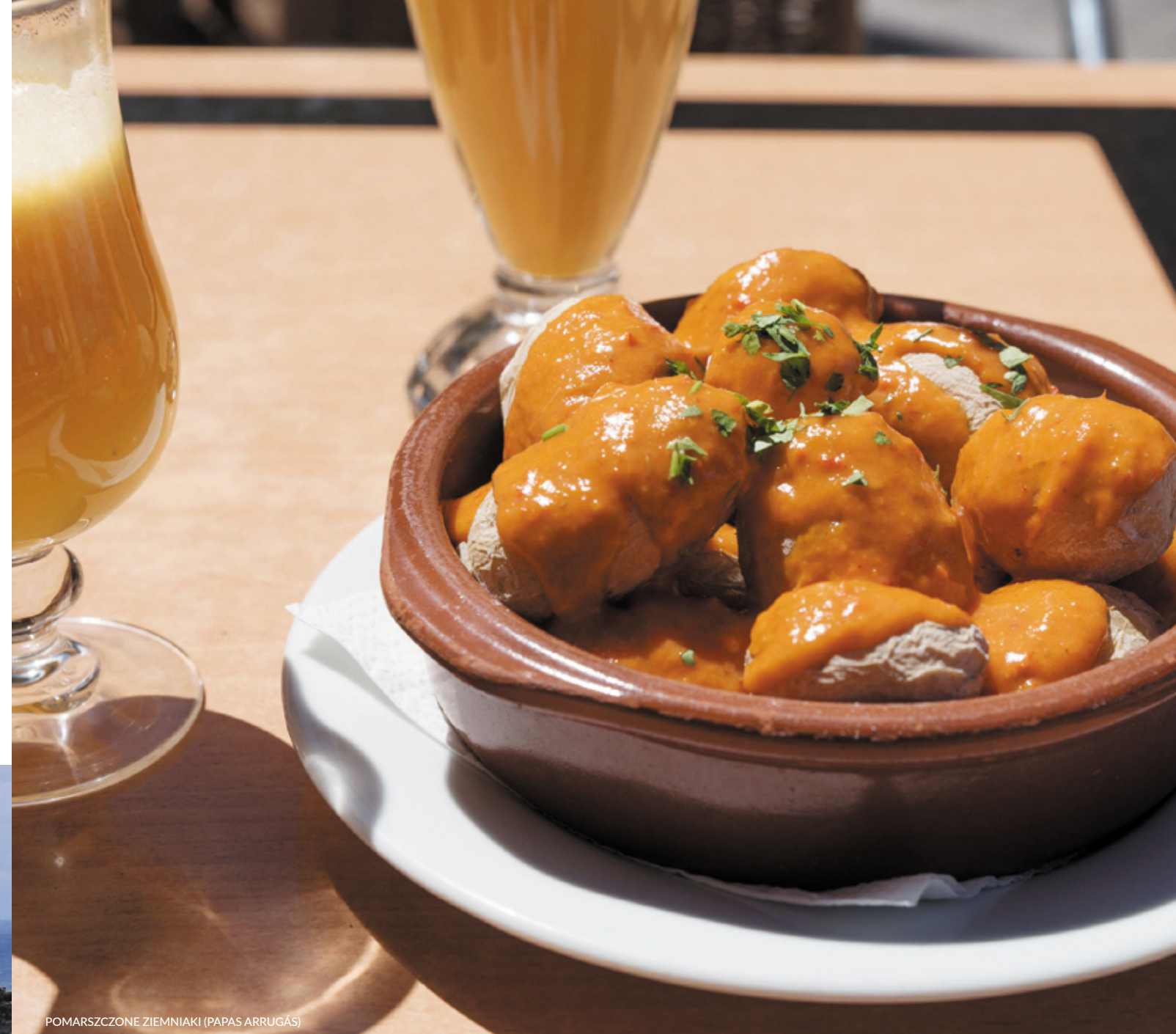
POMARSZCZONE ZIEMNIAKI (PAPAS ARRUGÁS)