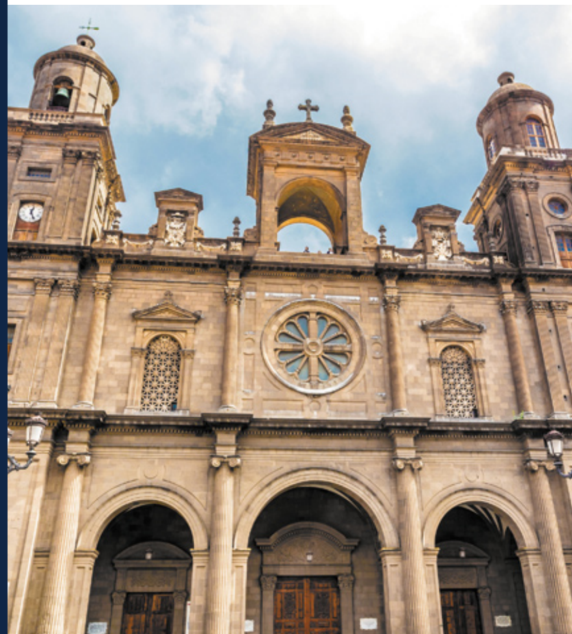
▲ BAZYLIKA KATEDRALNA ŚWIĘTEJ ANNY LAS PALMAS DE GRAN CANARIA

Tętniąca życiem stolica oferuje szeroki wachlarz możliwości spędzenia wolnego czasu, a także jest rajem dla miłośników zakupów czy sportów wodnych. Na północy wyspy znajdują się urokliwe miejscowości nadmorskie, idealne na wypoczynek i rozkoszowanie się lokalną kuchnią. Na południu zakochasz się w bezkresnych krajobrazach wydmowych plaż, które wiatr kształtuje każdego dnia inaczej. Stosownie do twoich upodobań wyspa zapewni ci miłe spędzenie czasu.