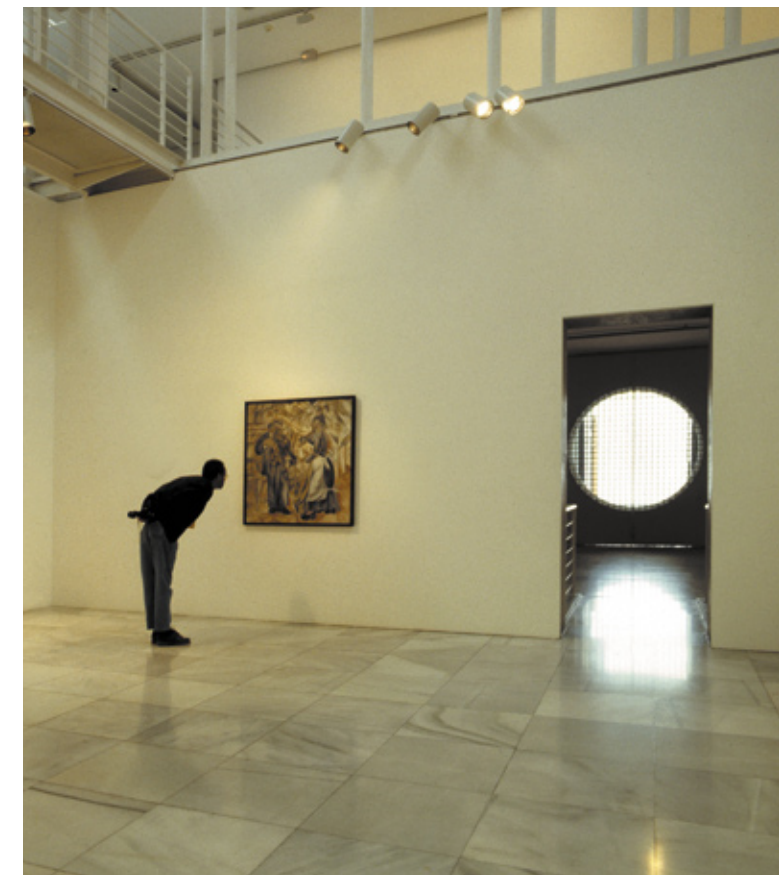
▲ ATLANTYCKIE CENTRUM SZTUKI WSPÓŁCZESNEJ, CAAM LAS PALMAS DE GRAN CANARIA

Inne cuda czekają na ciebie w Ogrodzie Botanicznym Viera y Clavijo , gdzie poznasz całe bogactwo flory.