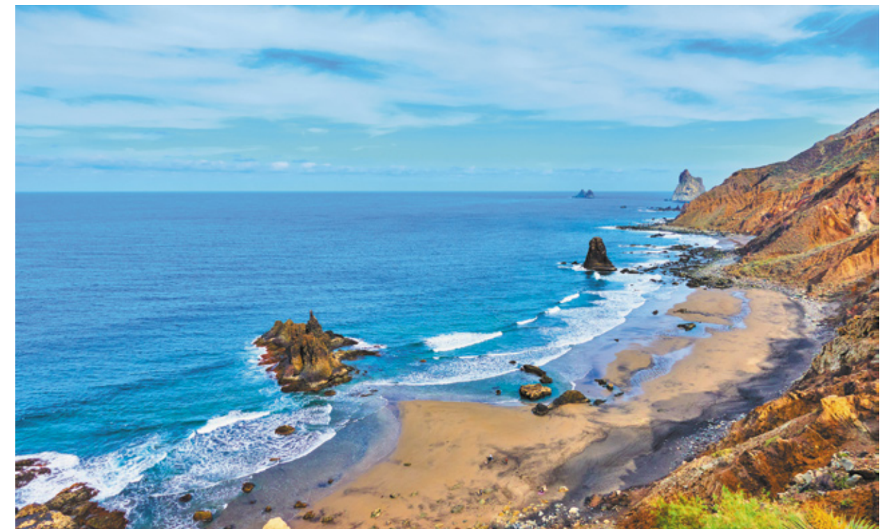
▲ PLAŻA BENIJO TENERYFA

południu z kolei można cieszyć się cichymi plażami o białym piasku z idealnymi miejscami do uprawiania sportów wodnych oraz różnymi sposobami spędzania wolnego czasu i lokalami tuż przy plaży czynnymi zarówno w dzień, jak i w nocy.