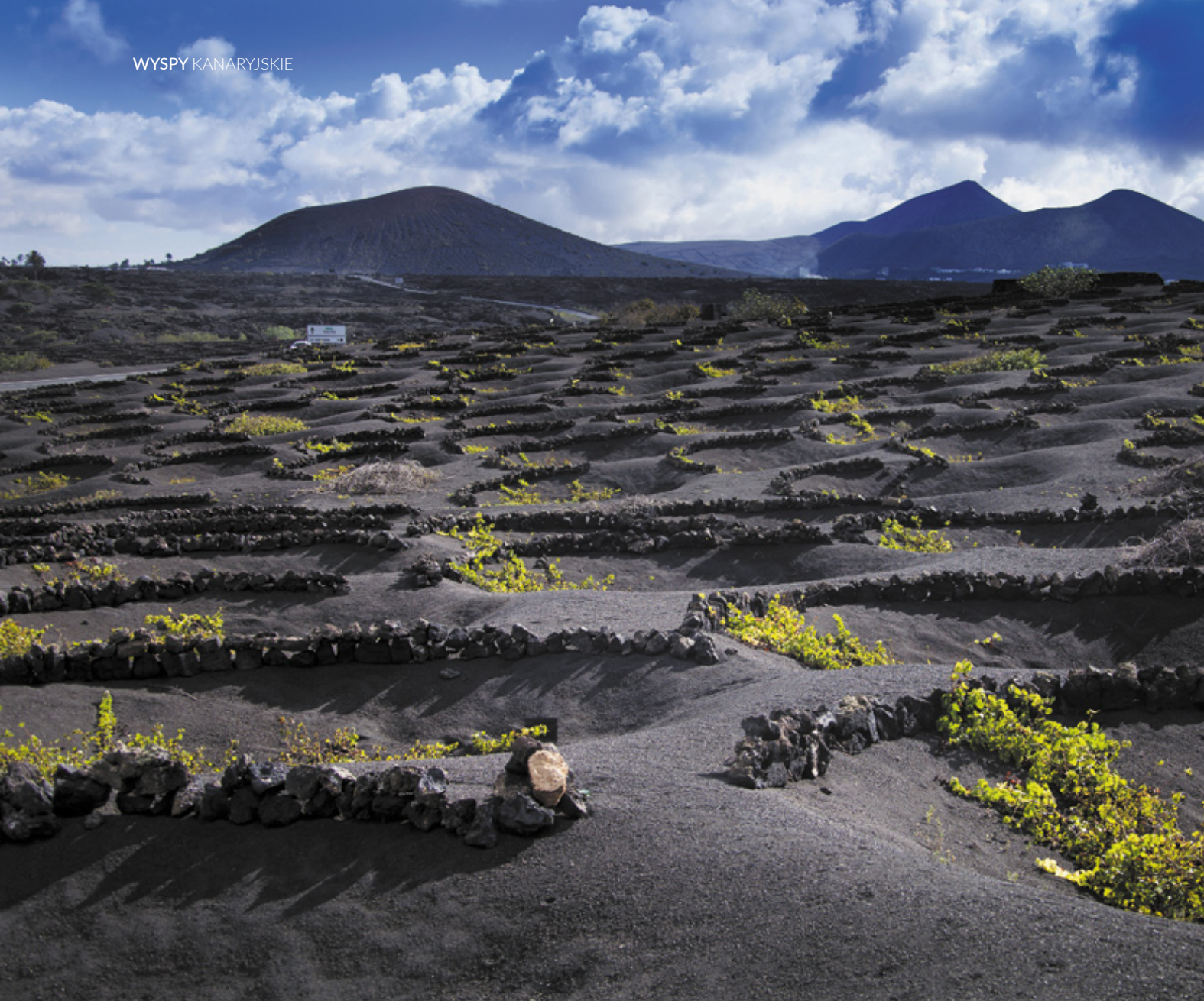
▲ LA GERIA LANZAROTE

Na wyspach szczęścia będziesz cieszyć się wykwinnymi rybami i owocami morza , takimi jak sparysoma kreteńska ( vieja ), granik ( mero ) lub wrakoń ( cherne ). Wyspy Kanaryjskie to także raj owocowy, w którym szczególną rolę odgrywa banan . Delektuj się 10 apelacjami win z archipelagu i skosztuj różnych serów , ze szczególnym uwzględnieniem majorero , kulinarnego klejnotu Fuerteventury wytwarzanego z mleka koziego. Kolejną gastronomiczną