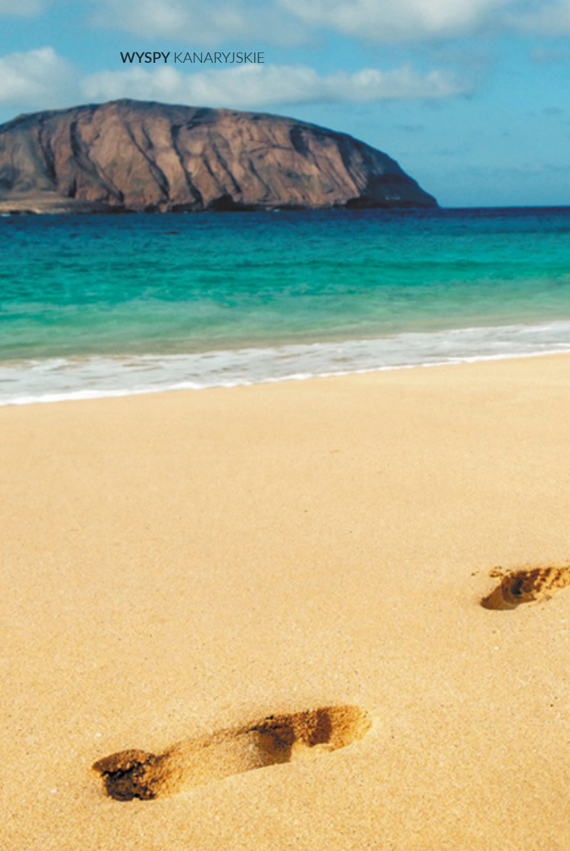
▲ PLAŻA LAS CONCHAS LA GRACIOSA

Inne obszary chronione to Park Przyrody Los Volcanes w Tinajo z charakterystycznymi ciekawymi formacjami powstałymi w wyniku erupcji wulkanicznych na wyspie w XVIII i XIX wieku. W parku istnieje kilka szlaków turystycznych, które pozwalają na obserwację lokalnych gatunków gadów i ptaków.