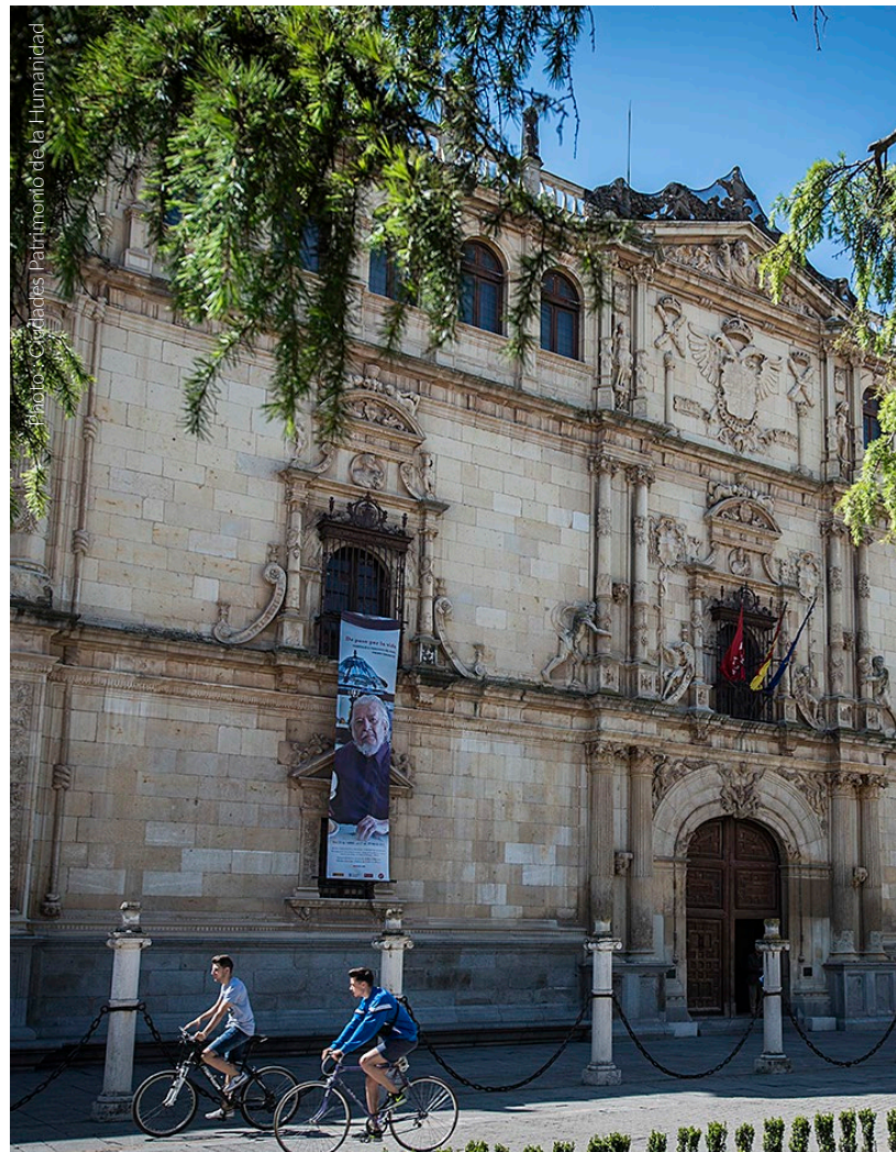
▲ ALCALÁ DE HENARES, RÉGION DE MADRID

Tout près de la vieille ville, à Encín Golf , vous attend un terrain très ludique, avec 18 trous qui vous permettront d'exprimer toutes vos capacités. Il forme une très belle image avec les montagnes de la ville proche de Los Santos de la Humosa. Si vous souhaitez améliorer votre jeu, vous pourrez vous entraîner sur un des meilleurs practices de toute l'Espagne, avec plus de 100 postes de tir. Un peu à l'écart du centre d'Alcalá, vous trouverez El Robledal , un terrain approprié pour les joueurs de tous les niveaux. Son parcours passe dans les maquis et les bois de chênes verts et le terrain irrégulier forme des dénivelés et des obstacles parfaits pour vous mettre à l'épreuve.