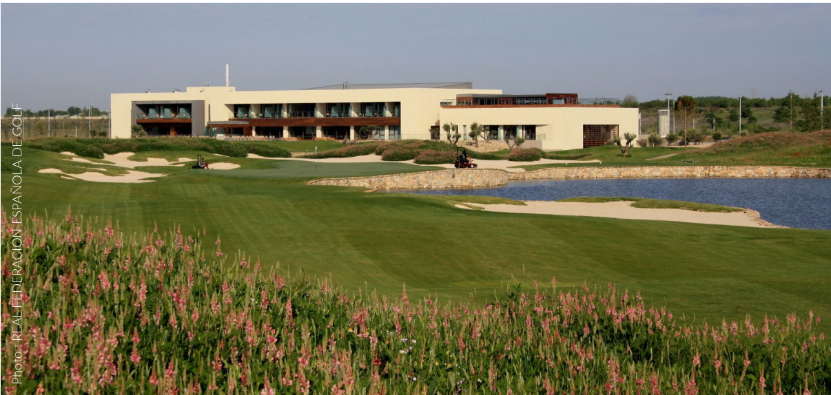
▲ TERRAIN DE GOLF EL ENCÍN, ALCALÁ DE HENARES RÉGION DE MADRID