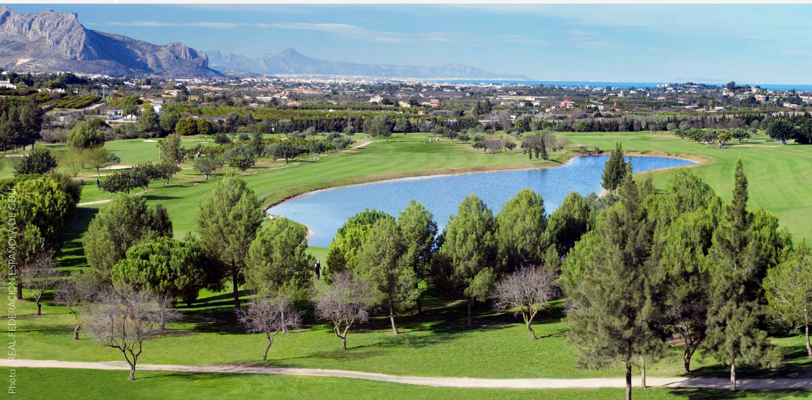
▲ SELLA GOLF RESORT &amp; SPA, DENIA

Sur la corniche de Cantabrie, dans l'Espagne verte, vous attendent des terrains de golf pour tous les goûts. Ainsi que de nombreux restaurants étoilés au Michelin répartis entre la Galice, la Cantabrie, les Asturies et le Pays basque. À cinq minutes du centre de Saint-Sébastien, dans un environnement montagneux, le Real Nuevo Club de Golf de San Sebastián Basozabal vous propose l'un des parcours les plus exigeants du pays. Il dispose d'un restaurant avec terrasse où déguster la délicieuse cuisine de la région et admirer la vue panoramique sur la campagne. Les amateurs de haute cuisine ne manqueront pas de se rendre aux restaurants Martín Berasategui, Akelarre et Arzak, qui arborent chacun trois étoiles Michelin.