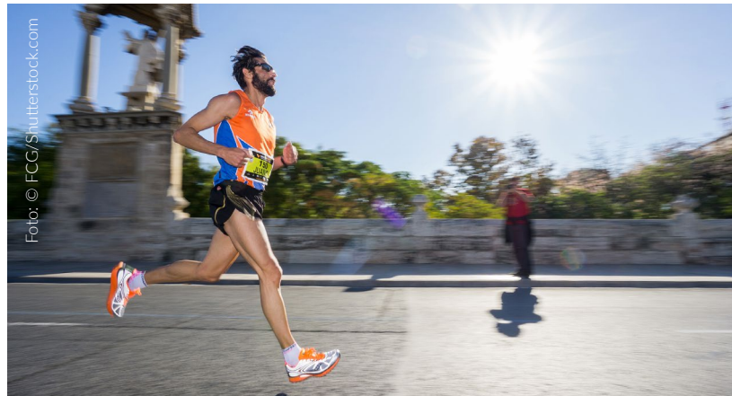
▲ CAMPEONATO DO MUNDO DE MARATONA IAAF VALÊNCIA

Correr com boa temperatura, perto do mar e diante de um público animado? Em Valência vais encontrar um circuito totalmente plano junto à vanguardista Cidade das Artes e das Ciências , com uma temperatura entre os 17 e os 22 graus centígrados e uma organização excelente. Por algum motivo a IAAF (Associação Internacional de Atletismo) lhe outorgou a etiqueta Gold Label nas suas duas modalidades, maratona e meia maratona. A espetacular zona da meta está situada numa passarela sobre a água junto ao Umbracle e ao Museu das Ciências.