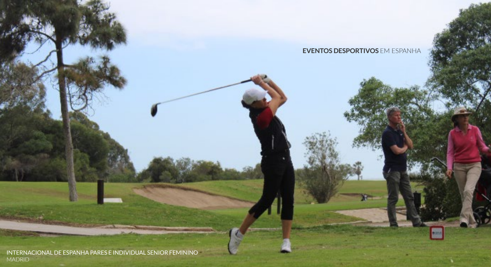
INTERNACIONAL DE ESPANHA PARES E INDIVIDUAL SENIOR FEMININO MADRID