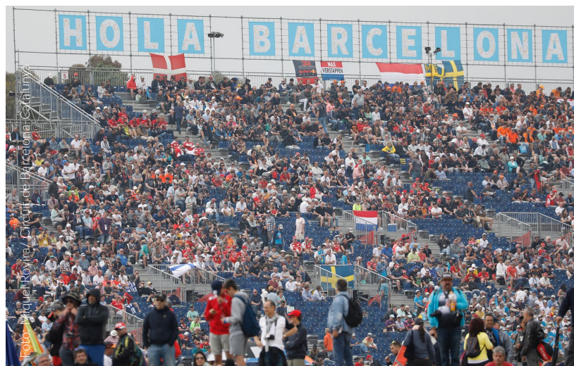
▲ GRANDE PRÉMIO DE ESPANHA DE FÓRMULA 1 MONTMELÓ