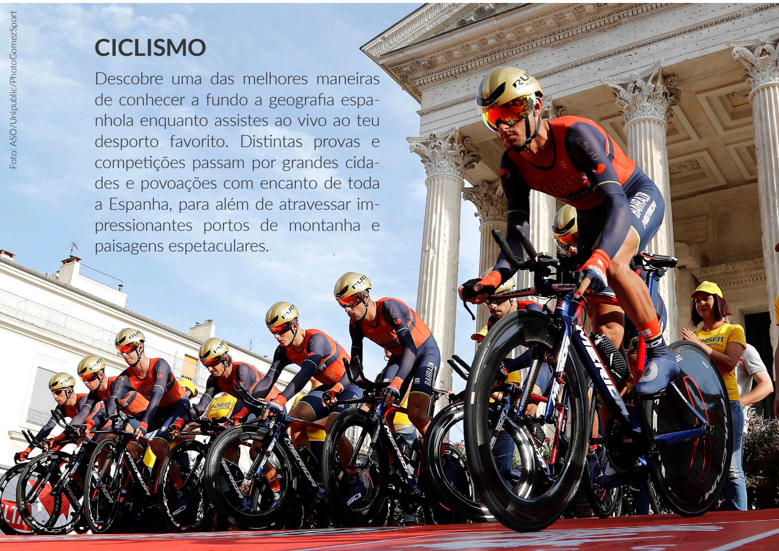
▲ VOLTA A ESPANHA EM BICICLETA

Descobre uma das melhores maneiras de conhecer a fundo a geografia espanhola enquanto assistes ao vivo ao teu desporto favorito. Distintas provas e competições passam por grandes cidades e povoações com encanto de toda a Espanha, para além de atravessar impressionantes portos de montanha e paisagens espetaculares.