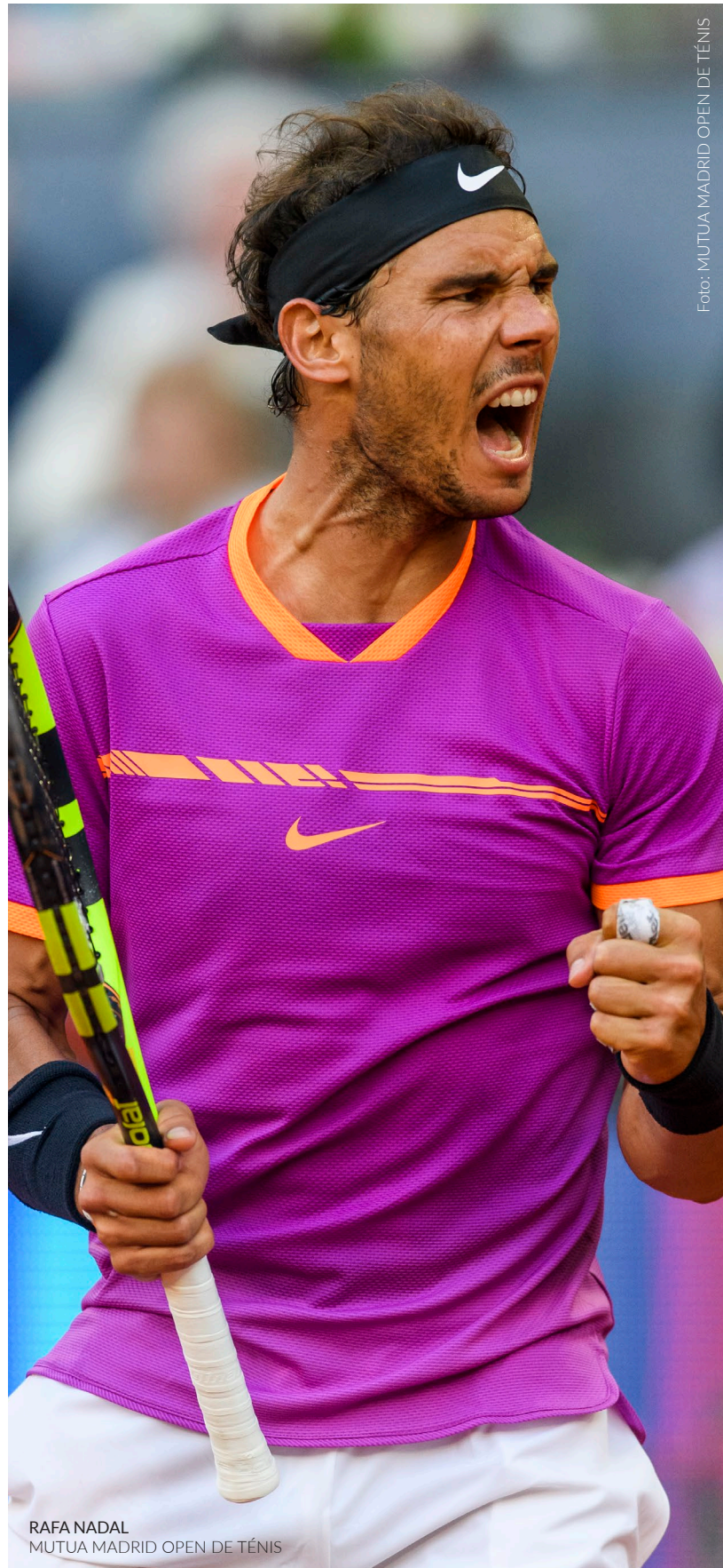
RAFA NADAL MUTUA MADRID OPEN DE TÊNIS

Para além de contar com uma ampla zona comercial, na qual estão presentes as marcas nacionais e internacionais mais representativas, poderás participar num torneio de ténis virtual que cada ano atrai mais jogadores. Se venceres, terás o privilégio de conhecer pessoalmente os ganhadores do Madrid Open.