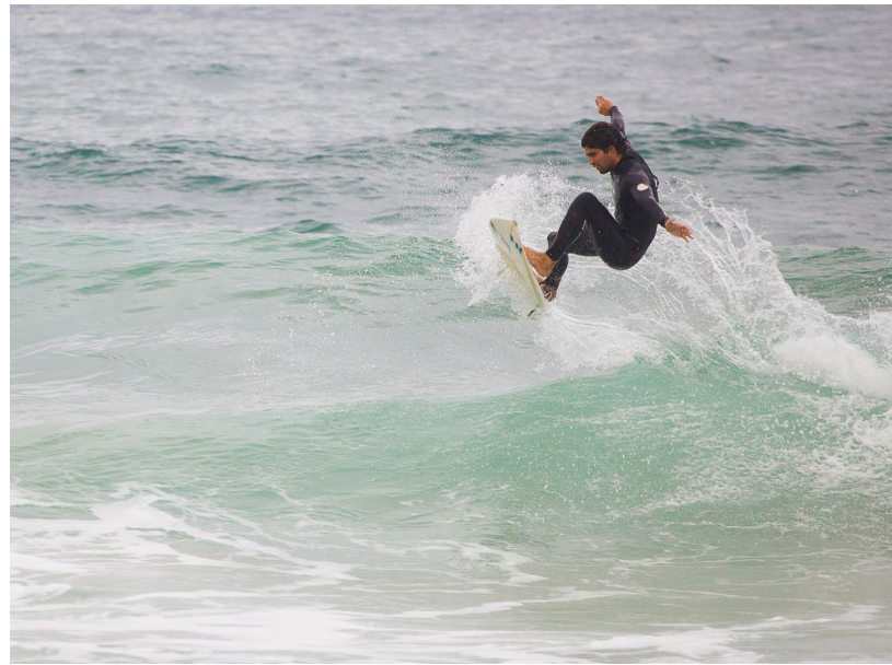
▲ FUERTEVENTURA WINDSURFING &amp; KITEBOARDING WORLD CUP