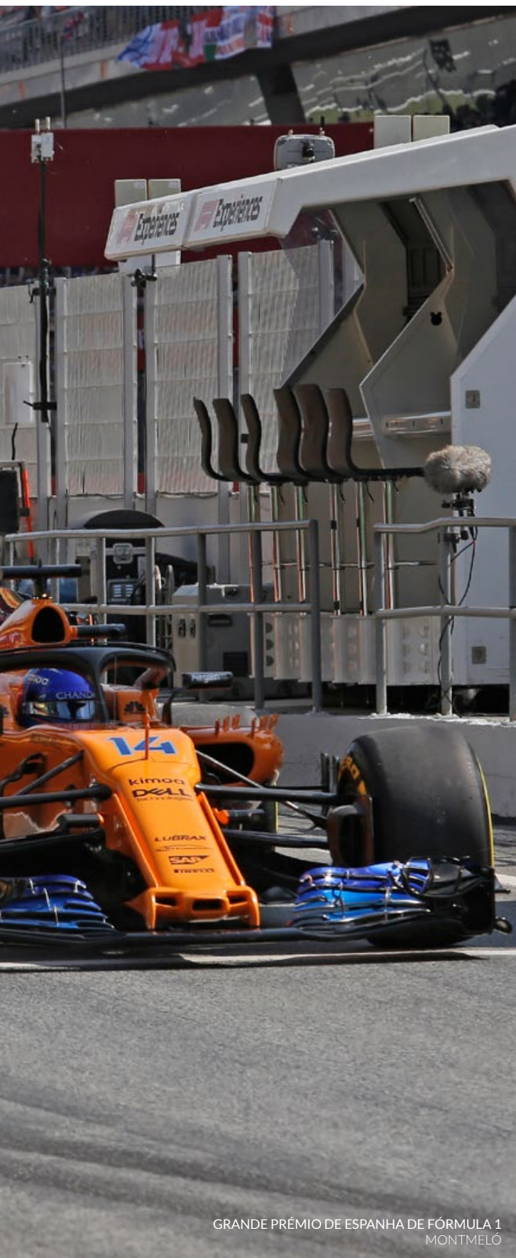
GRANDE PRÉMIO DE ESPANHA DE FÓRMULA 1 MONTMELÓ