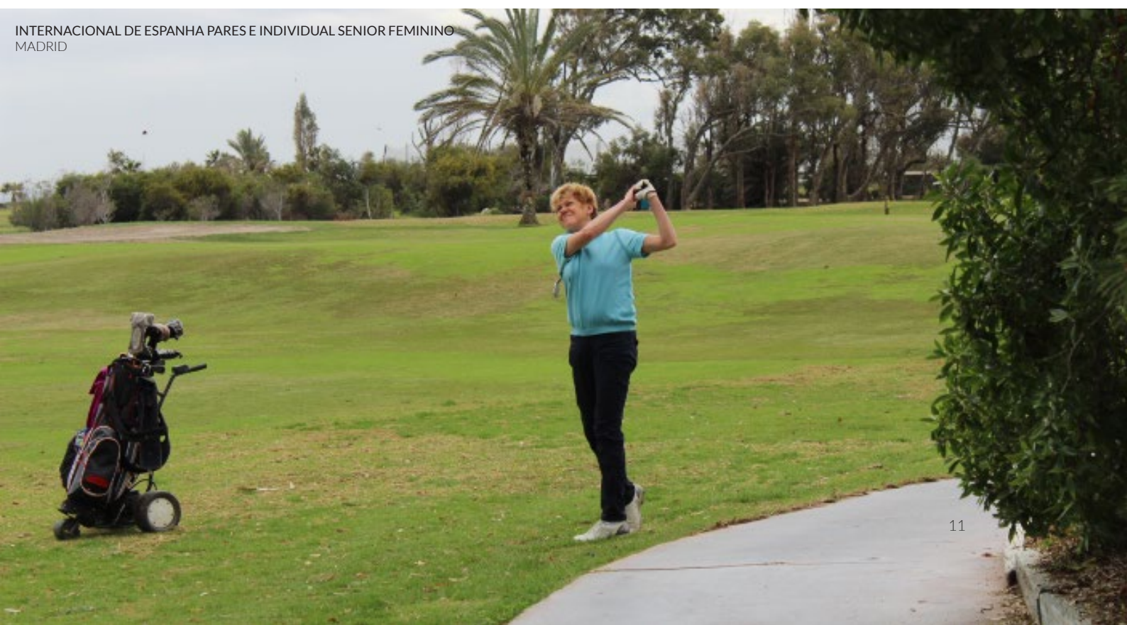
INTERNACIONAL DE ESPANHA PARES E INDIVIDUAL SENIOR FEMININO MADRID

📍 Onde: muda de sede em cada edição Quando: Março