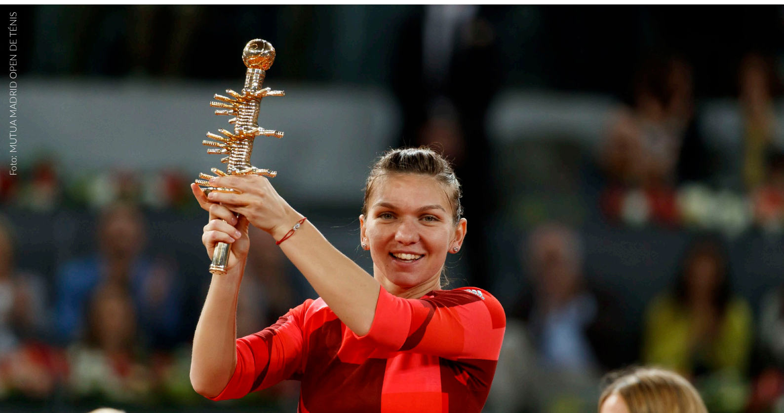
▲ MUTUA MADRID OPEN DE TÊNIS

Se quiseres ver os jogos desde uma perspetiva original, como se fosses o «olho de falcão», visita o Tennis Garden, uma passarela que se eleva sobre as pistas e que permite ver os jogadores em ação desde uma posição única.