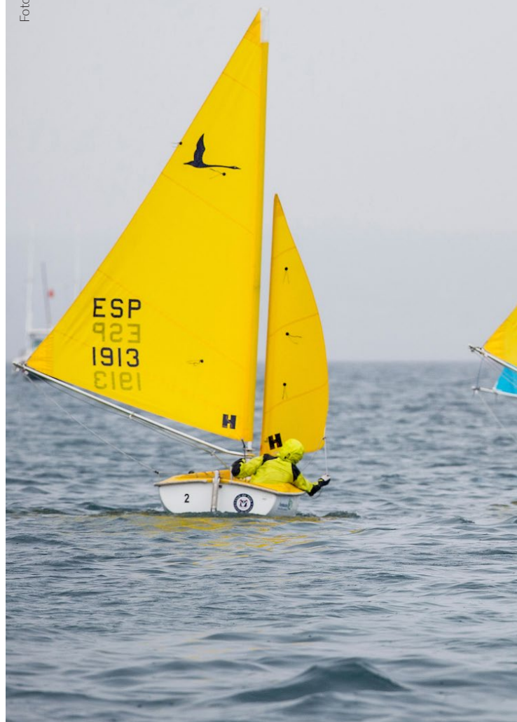
▲ PALMAVELA ILHAS BALEARES