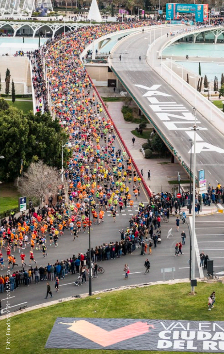
▲ CAMPEONATO DO MUNDO DE MEIA MARATONA IAAF 2018 VALÊNCIA