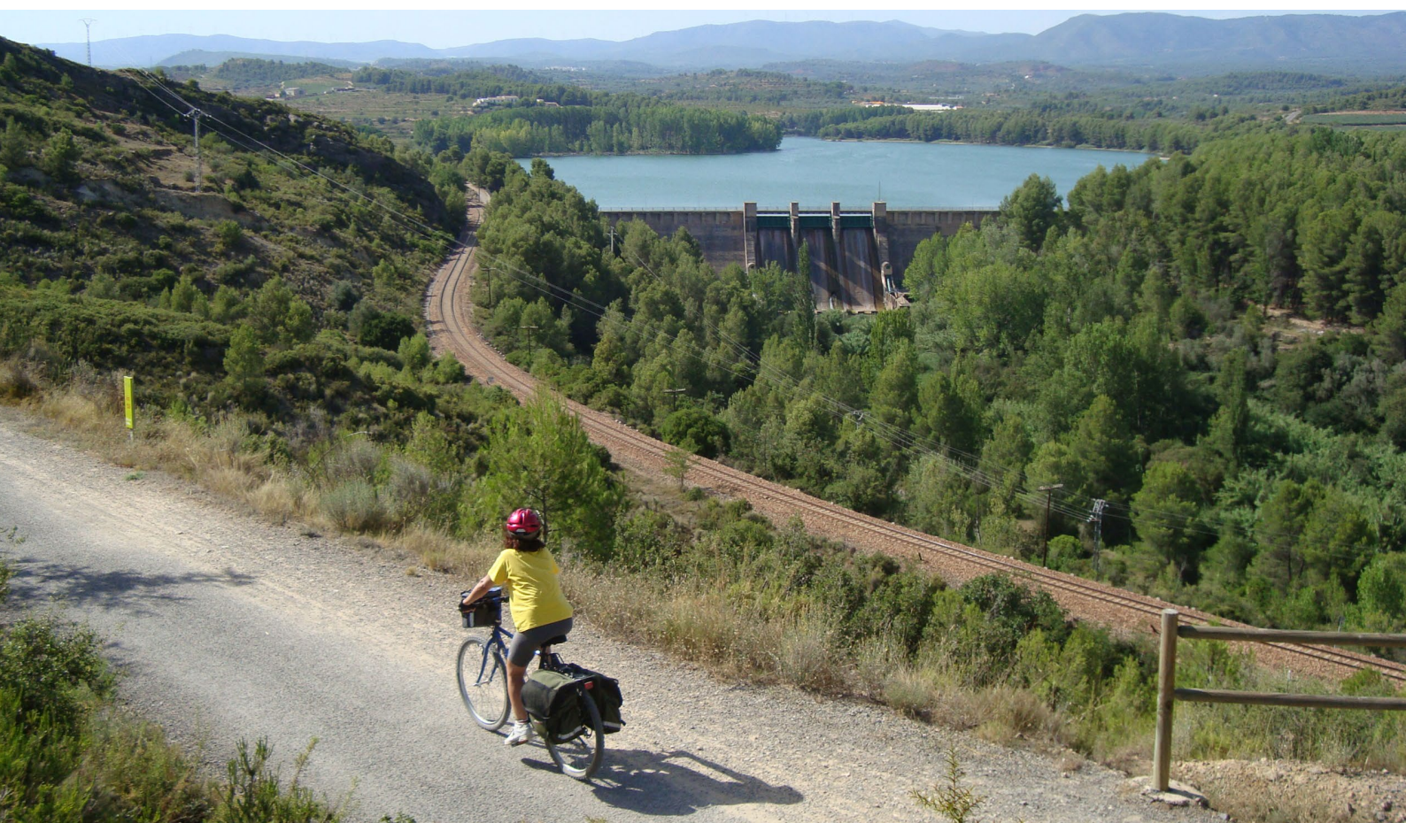
▲ VIA VERDE DI OJOS NEGROS CASTELLÓN