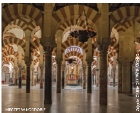
MECZET W KORDOBIE

Możesz wybrać jedną z jedenastu tras tematycznych zaproponowanych przez władze lokalne w programie „Kordoba rowerem”. Niektóre przebiegają przez najbardziej charakterystyczne miejsca, place i mosty. Inne prowadzą przez ogrody i parki lub wzdłuż brzegów rzeki Gwadalkiwir.