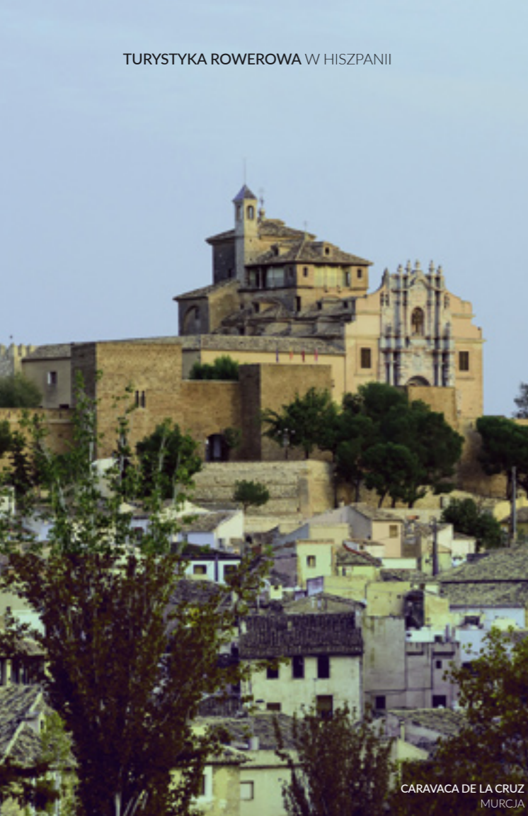
CARAVACA DE LA CRUZ MURCIA