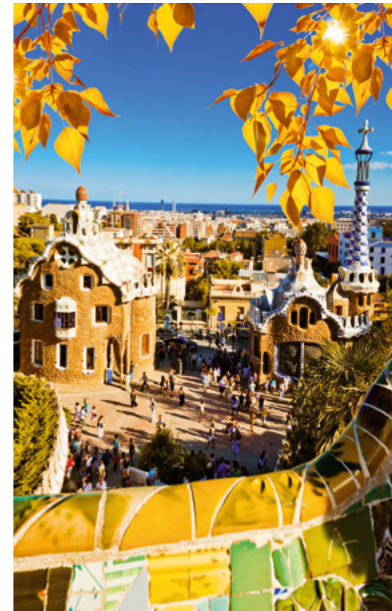
▲ PARK GÜELL BARCELONA

Przejazd przez tę śródziemnomorską stolicę jest szczególnie łatwy – teren jest płaski, a klimat bardzo przyjemny o każdej porze roku. Aby zwiedzić centrum, można skorzystać z rozbudowanej sieci ścieżek rowerowych. Ponadto do dyspozycji jest tzw. rowerowy pierścień zaprojektowany specjalnie z myślą o rowerzystach, który otacza miasto i łączy się z drogami rowerowymi prowadzącymi do centrum.