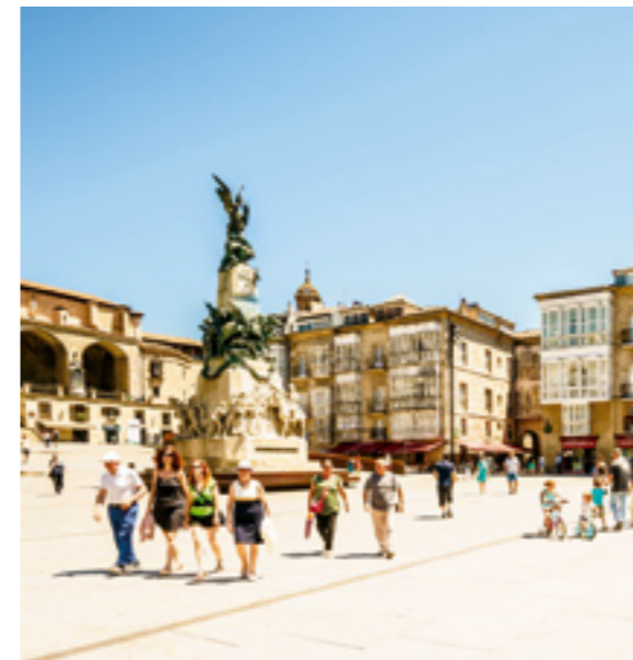
▲ PLAC PLAZA DE LA VIRGEN BLANCA VITORIA

Dobrym rozwiązaniem jest skorzystanie z wycieczki z przewodnikiem. Zabierze cię on do najważniejszych miejsc, skosztujesz słynnych pintxos i będziesz cieszyć się najlepszymi widokami. Jeśli chcesz sobie ułatwić życie, skus się na wycieczkę rowerem elektrycznym.