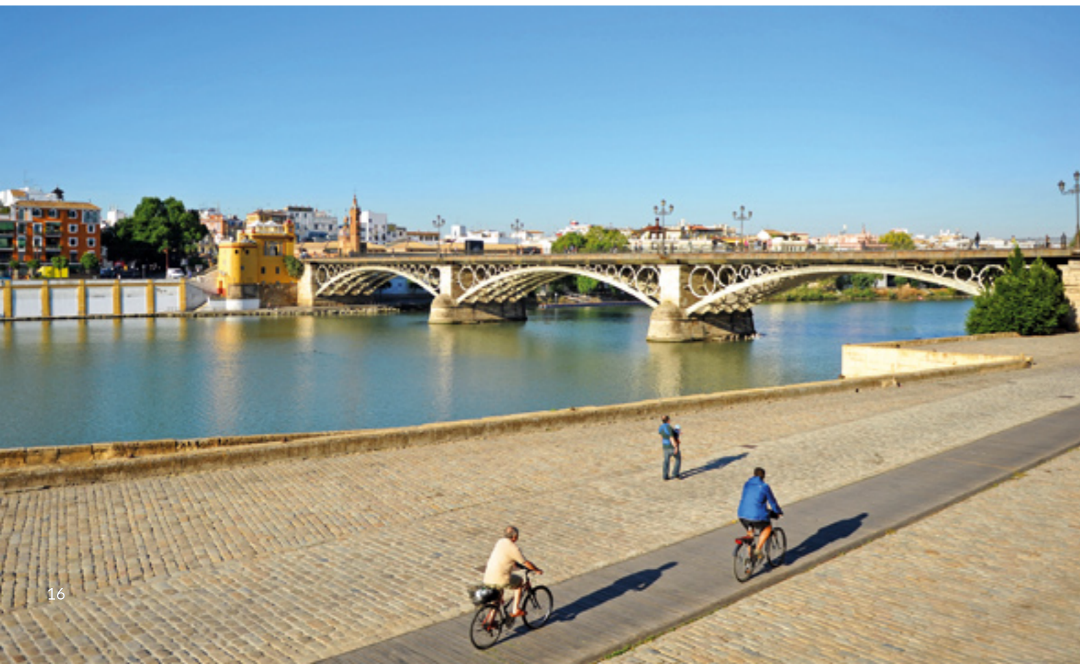
▼ MOST ISABEL II SEWILLA

Kiedy zechcesz jechać w cieniu, wybierz trasy prowadzące wśród drzew w parku Marii Luizy , podziwiasz lokalną roślinność i odkryj schowany w jego wnętrzu imponujący Plaza de España (Plac Hiszpański). Stąd można jechać dalej ścieżką rowerową wiodącą do brzegów rzeki Gwadalkiwir.