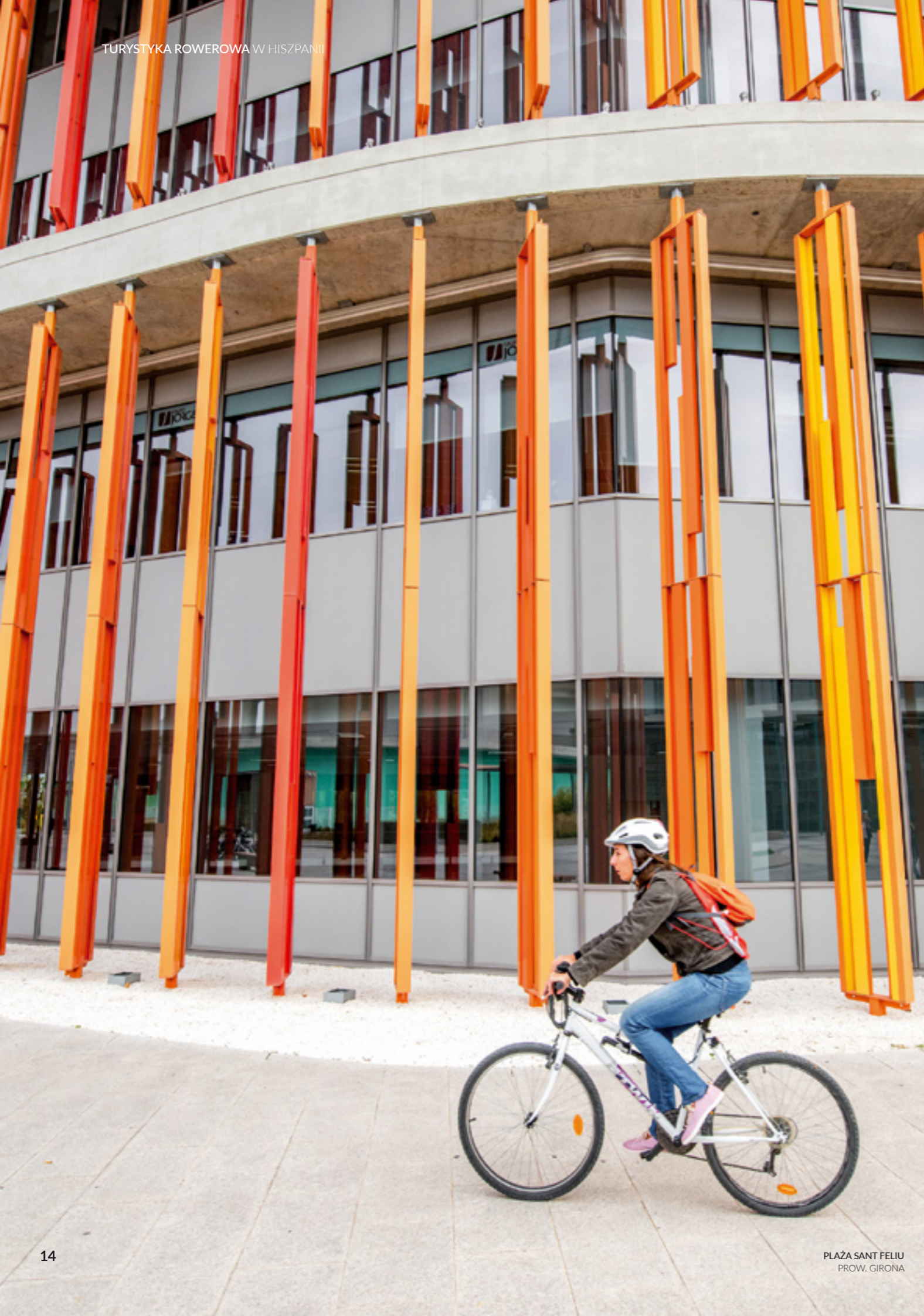
PLAŻA SANT FELIU PROV. GIRONA