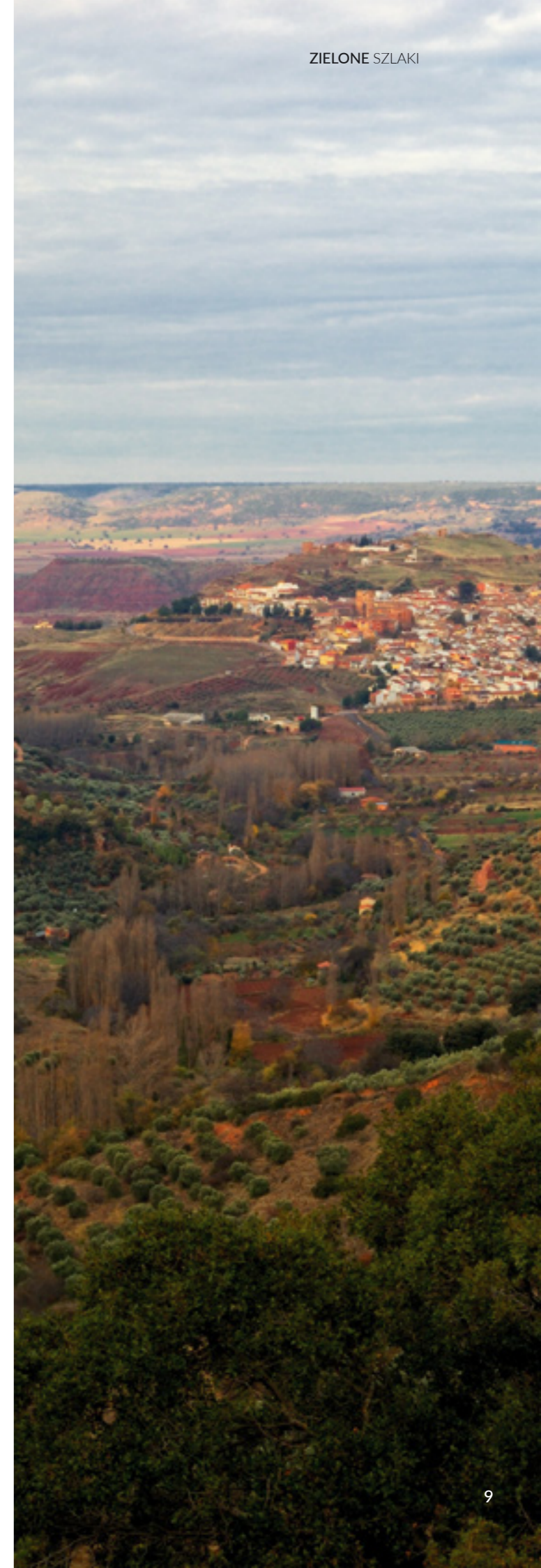
► ALCARAZ PROW. ALBACETE

Przed wyruszeniem na szlak zwiedź miasto Albacete, korzystając ze ścieżek rowerowych, by podziwiać jego zabytki. Następnie podążaj śladami bohatera powieści Cervantesa na około 75-kilometrowej trasie będącej częścią wielkiego Szlaku Don Kichota w Kastylii-La Manchy. Miniesz tereny uprawne równiny Albacete, a następnie dotrzesz do dorzecza rzeki Jardín. Zaskoczą cię bardziej surowe i górzyste krajobrazy, z przeważającymi drzewami iglastymi i dębami. Pokonasz ponad 20 tuneli i wiaduktów, aż dojedziesz do miasta Alcaraz.