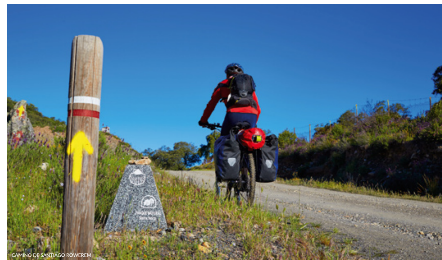
CAMINO DE SANTIAGO ROWEREM

Jeśli lubisz wielodniowe wyprawy rowerowe, w Hiszpanii masz do wyboru liczne szlaki.