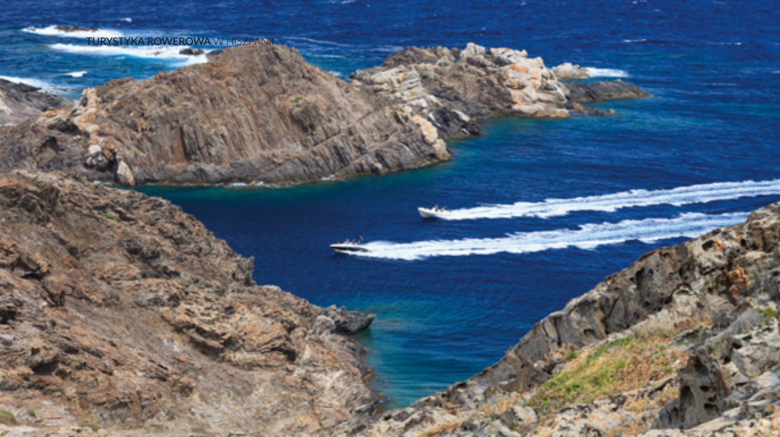
▲ PRZYŁĄDEK CREUS PROW. GIRONA

Opracowanie tej trasy jest wynikiem inicjatywy rowerzystów z regionu, którzy oferują przewodniki i trasy do trackerów GPS do pobrania na stronie www.transandalus.org . Ściągnij stamtąd informacje i zaplanuj podróż, bowiem trasa nie jest oznaczona w terenie.