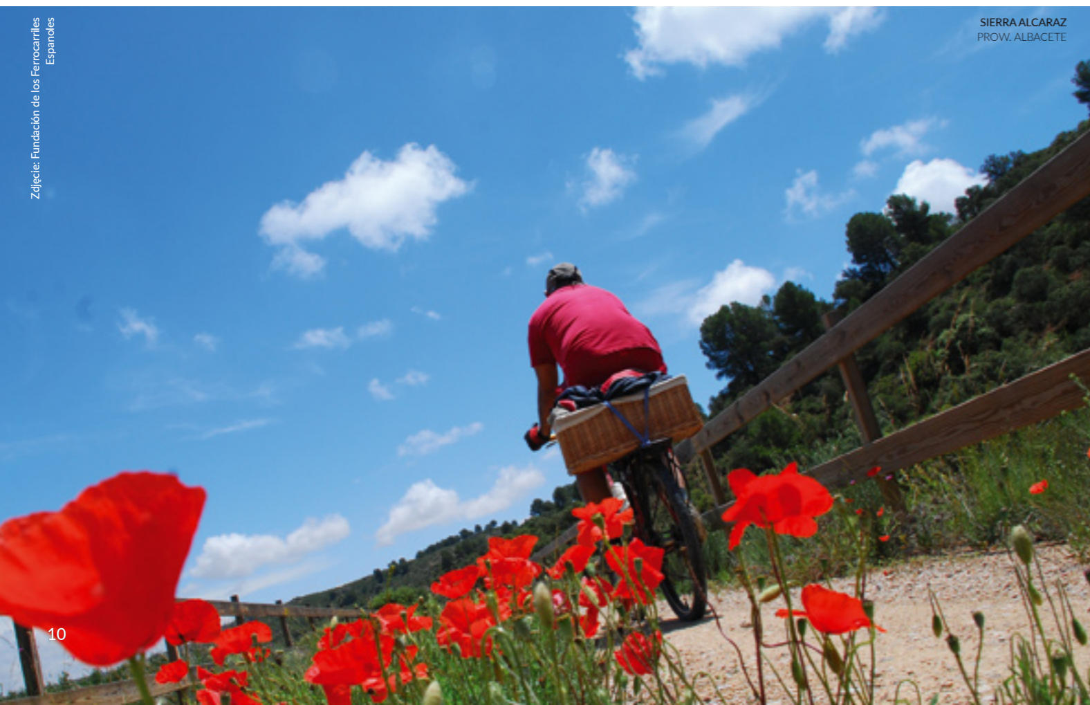
SIERRA ALCARAZ PROV. ALBACETE