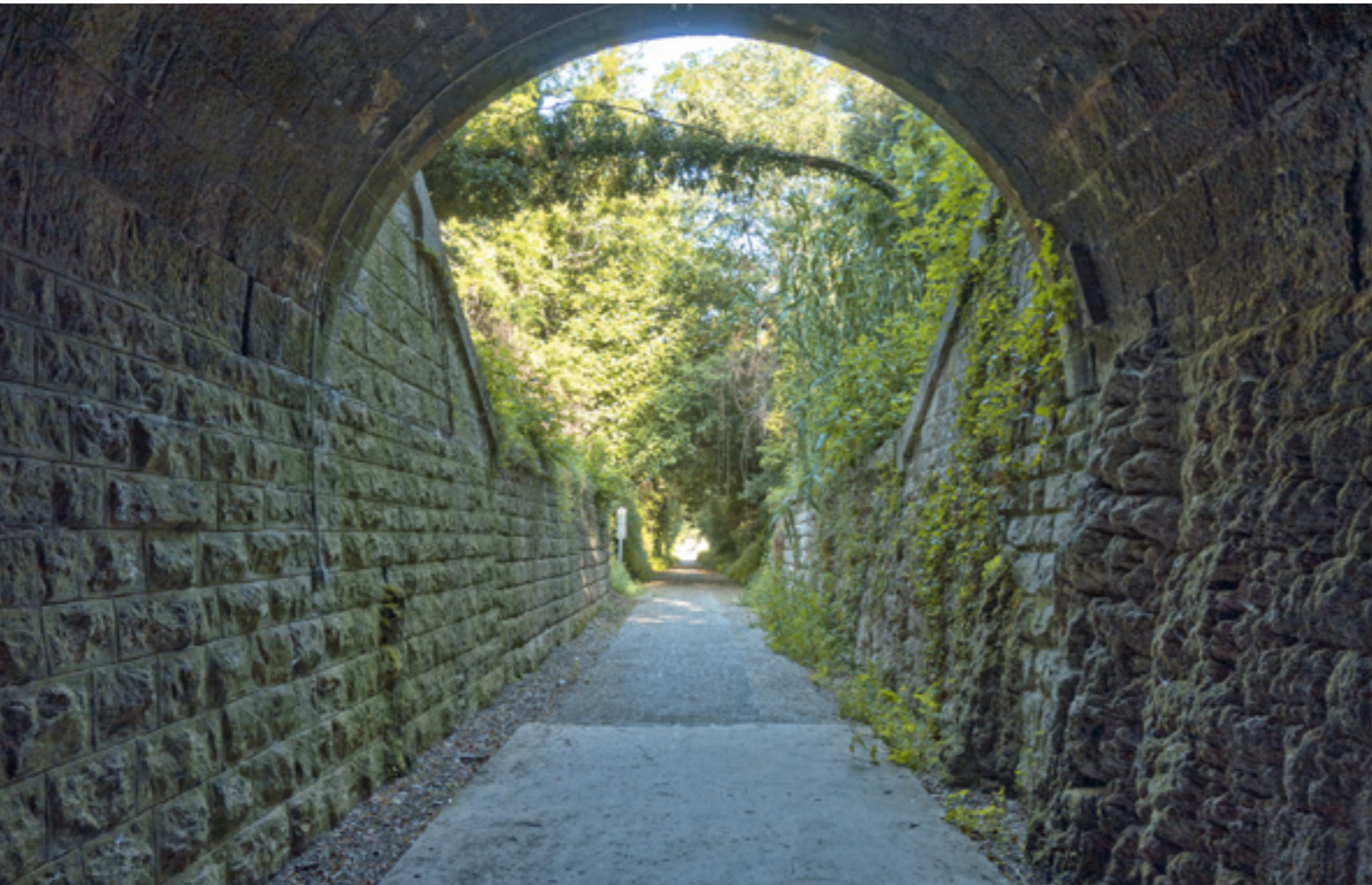
▲ ZIELONY SZLAK OJOS NEGROS CASTELLÓN