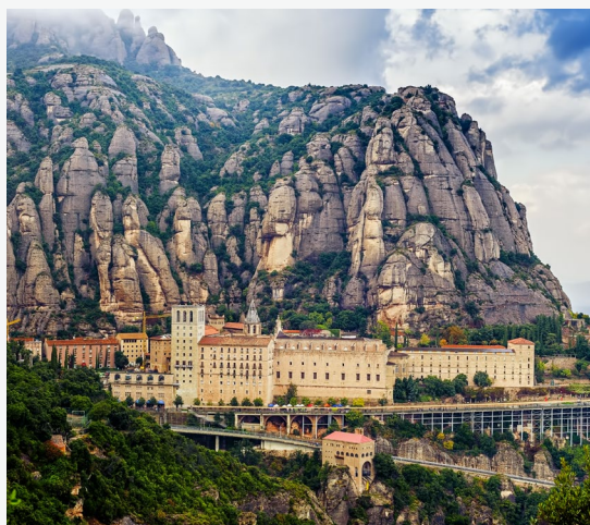
▲ MONASTÈRE SANTA MARIA DE MONTSERRAT

Figueres (province de Gérone) abrite le théâtre-musée surréaliste de Salvador Dalí et la plus grande forteresse du XVIIIe siècle d'Europe : le château de Sant Ferran . Autre arrêt incontournable, la source du Llobregat , dans la commune de Castellar de n'Hug. Le spectacle de l'eau qui jaillit sous la forme d'une belle cascade est réjouissant.