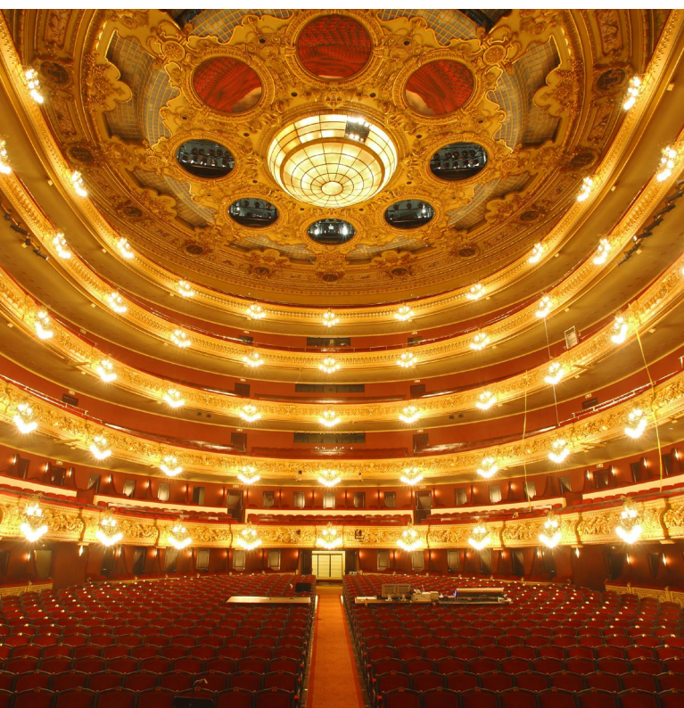
▼ GRAN TEATRE DEL LICEU