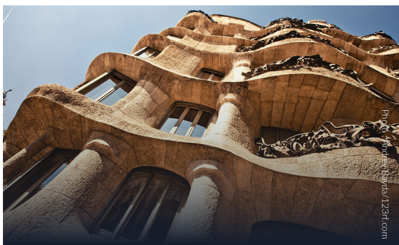
▲ LA PEDRERA