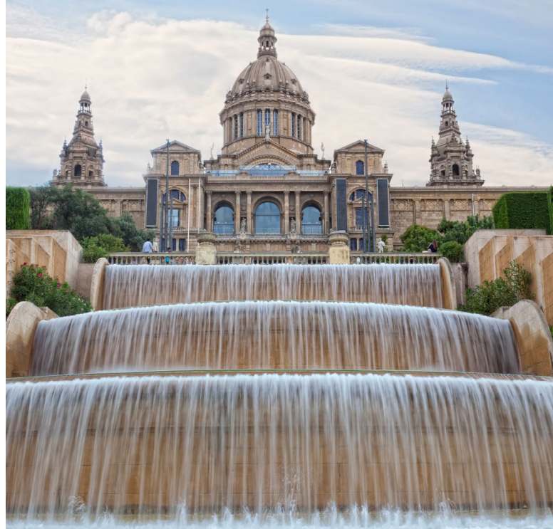
▲ PALAIS NATIONAL DE MONTJUÏC

Aux pieds de Montjuïc s'étend la Plaça d'Espanya , où convergent certaines des rues les plus dynamiques de Barcelone, dont le Paral·lel ou la Gran Vía . Le parc Joan Miró se trouve à deux pas. Profitez d'une paisible promenade dans ses allées pour y contempler Femme et oiseau , l'une des œuvres les plus importantes du génie