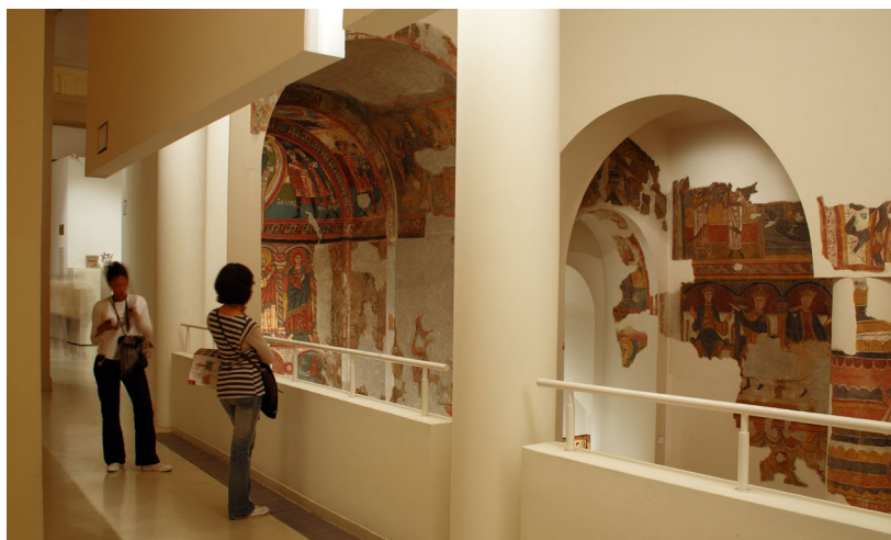
▲ INTÉRIEUR DU MUSÉE NATIONAL D'ART DE CATALOGNE (MNAC)

CaixaForum : profitez de l'un des centres culturels les plus prestigieux d'Espagne. N'hésitez pas à accéder à son offre complète d'expositions temporaires, de conférences et d'activités pédagogiques pour toute la famille.