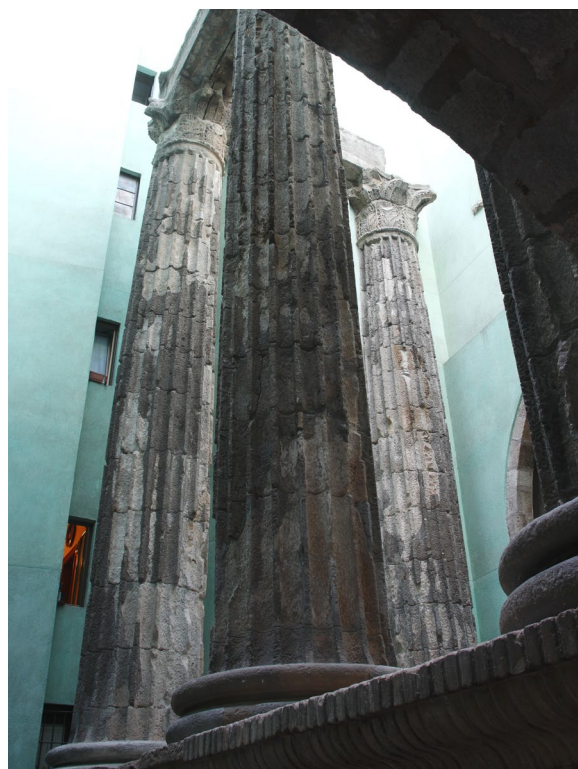
▲ TEMPLE D'AUGUSTE

Les vestiges de l'époque médiévale sont répartis dans tout le quartier de Ciutat Vella . La Plaça del Rei , compte parmi les lieux les plus intéressants, avec son Palau del Lloctinent (palais du lieutenant) et l'imposant Palau Reial Major . Ne manquez pas de visiter aussi les églises voisines. Les plus remarquables restent la basilique gothique Santa Maria del Pi , la basilique Santa María del Mar et le monastère roman de Sant Pere de les Puelles .