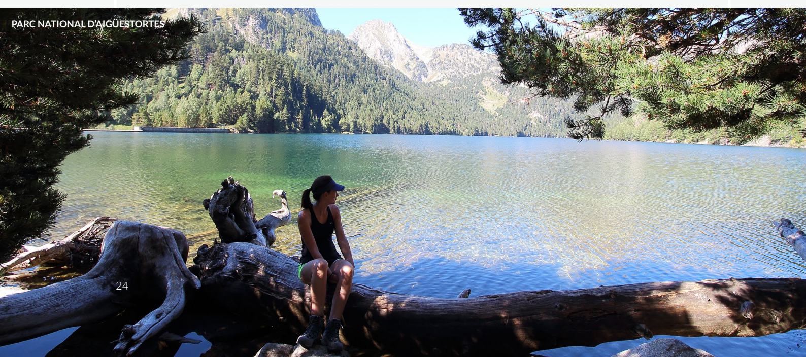
PARC NATIONAL D'AIGÜESTORTES

Le parc naturel du Cadí-Moixeró , entre les provinces de Barcelone, Gérone et Lleida, est une destination idéale à explorer à pied, à cheval ou à vélo. Ne manquez pas non plus d'admirer le parc naturel de la zone volcanique de la Garrotxa (Gérone) : vous resterez sans voix devant l'un des plus beaux paysages volcaniques d'Espagne.