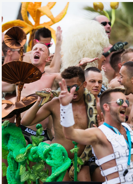
▲ 锡切斯骄傲游行 锡切斯

距离巴塞罗那20分钟的车程坐落着小镇锡切斯，这座风景如画的小镇是LGBTQI+的天堂。沿着这座给十九世纪后期一代加泰罗尼亚艺术家提供了创作灵感的小镇的海滩和街道漫步。