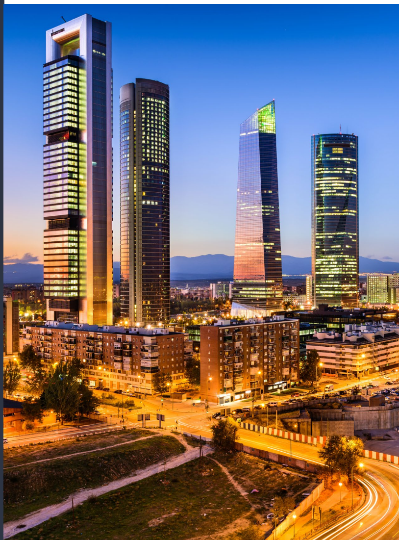
▲ COMPLEXE DES CUATRO TORRES MADRID

La Torre de Cristal , l'édifice le plus haut d'Espagne, ne manquera pas de vous donner le vertige avec ses 249 mètres d'altitude . Elle a été construite par César Pelli , l'architecte des célèbres tours Petronas de Kuala Lumpur, en collaboration avec le cabinet madrilène Ortiz León Arquitectos . Sa façade en forme de crystal taillé et le jardin vertical de sa coupole l'imposent parmi les bâtiments les plus impressionnants de l'architecture de la ville.