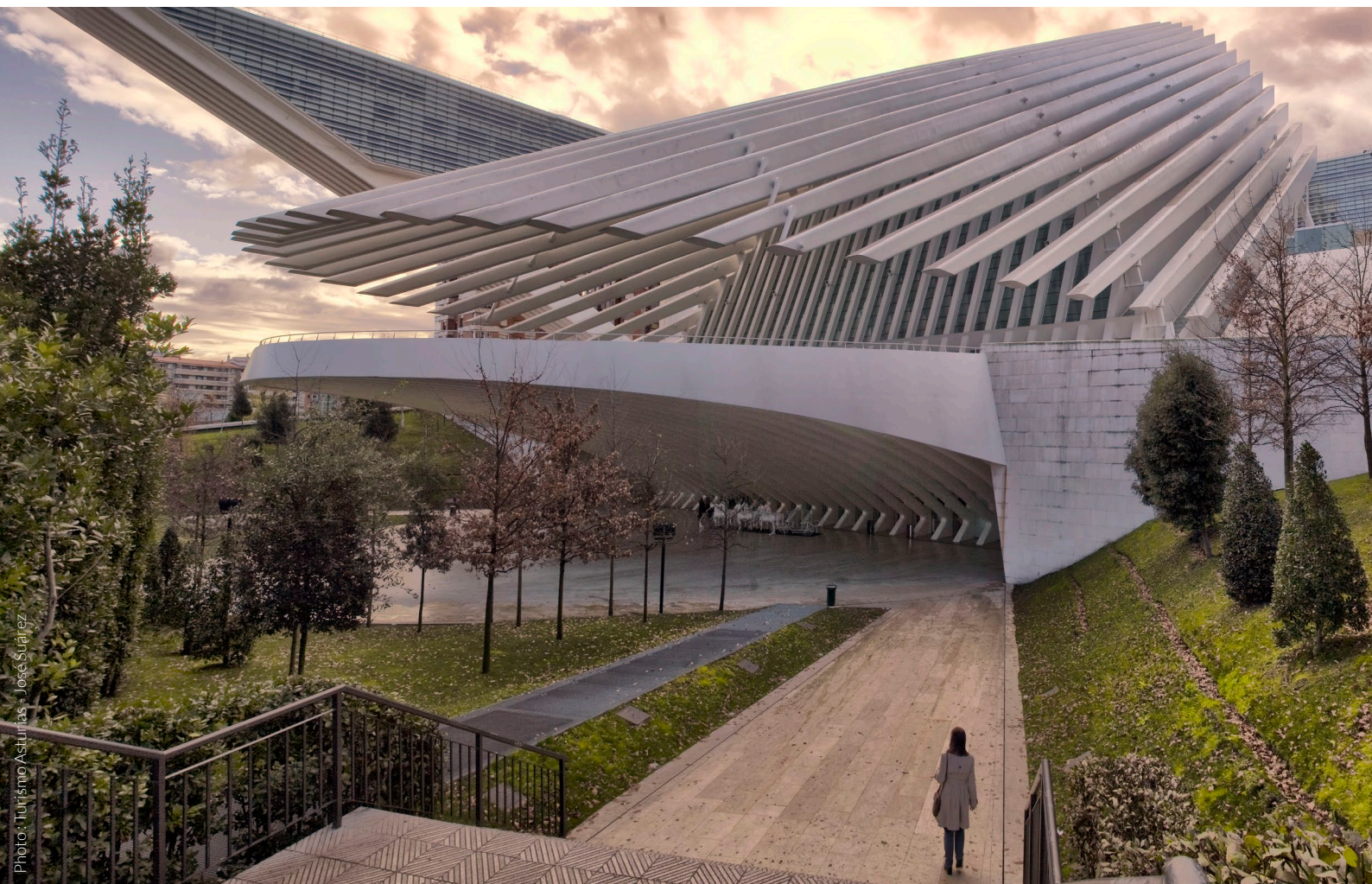
▲ PALAIS DES CONGRÈS OVIEDO