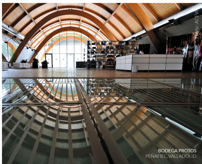
BODEGA PROTOS PEÑAFIEL, VALLADOLID

La toiture de la cave forme un élément visuel très fort. Le meilleur endroit pour l'apprécier se situe précisément sur les hauteurs du château : les cinq travées recouvertes de pièces en céramique de grand format rappellent la couleur et la forme des tuiles typiques de la région.