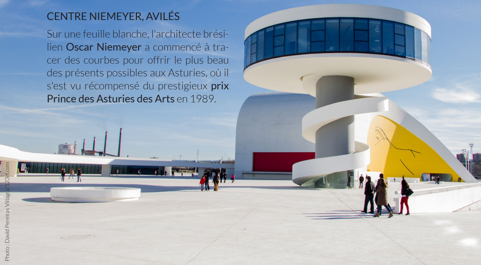
▲ CENTRE NIEMEYER AVILÉS