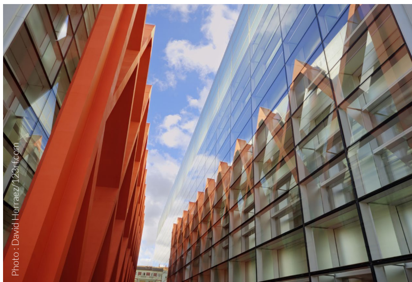
▲ MUSÉE DE L'ÉVOLUTION HUMAINE PROVINCE DE BURGOS

L'entrée du bâtiment principal assure une sensation de continuité, les parois en verre permettant de maintenir le