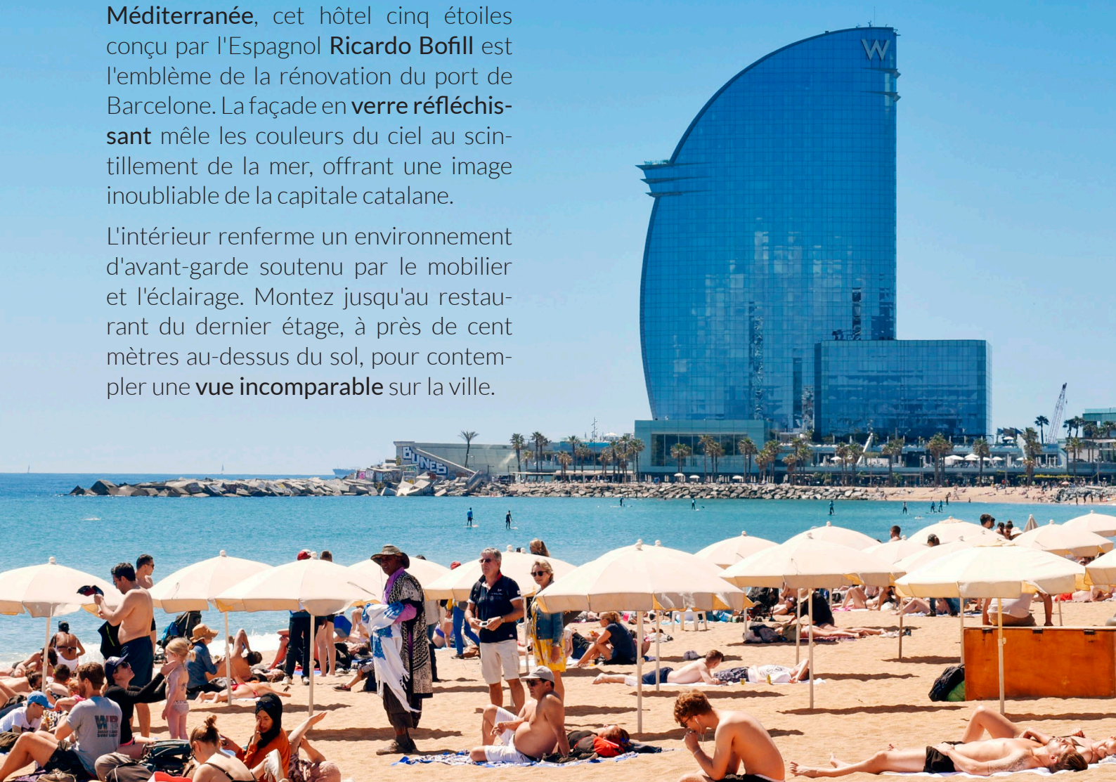
▲ W HOTEL BARCELONE

L'intérieur renferme un environnement d'avant-garde soutenu par le mobilier et l'éclairage. Montez jusqu'au restaurant du dernier étage, à près de cent mètres au-dessus du sol, pour contempler une vue incomparable sur la ville.